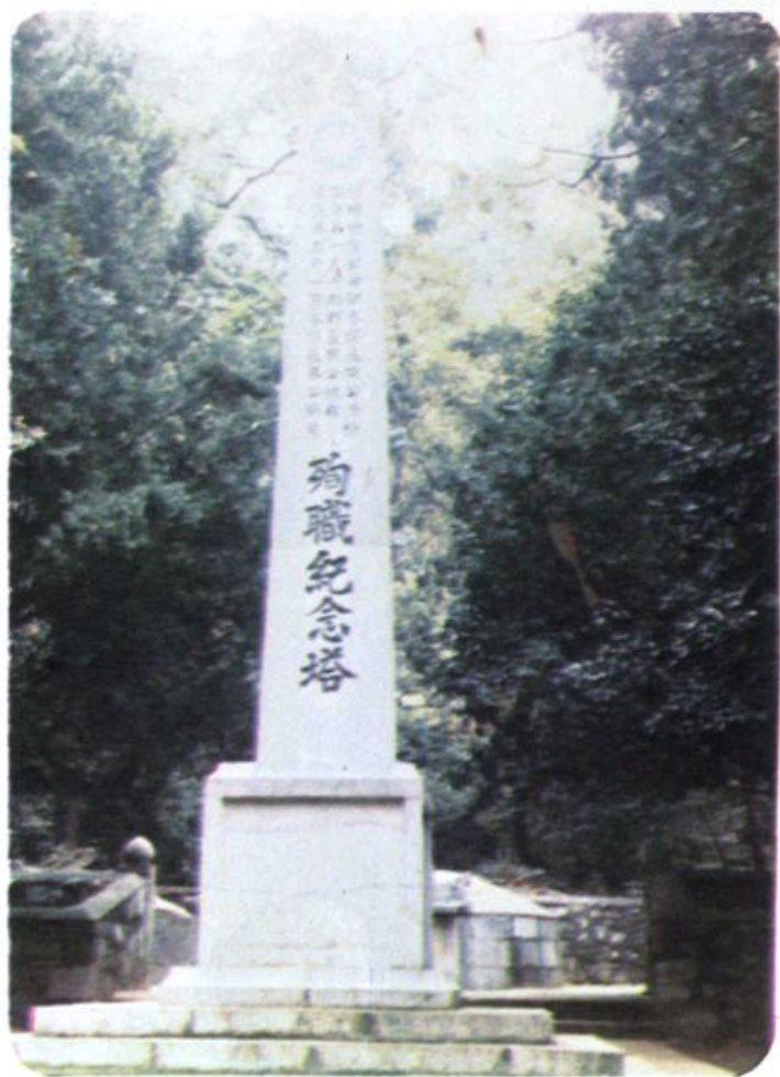
抗日陣亡將士呂旃蒙殉職紀念塔