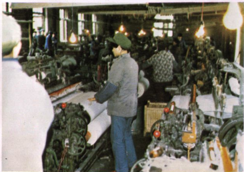
福利工厂织布车间