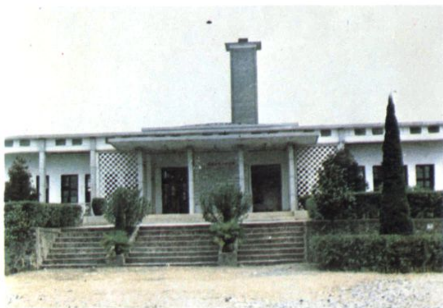
零陵縣殯儀館追悼廳