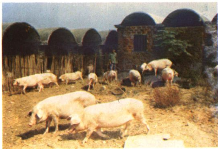
扶持退伍军人 发展牲猪生产