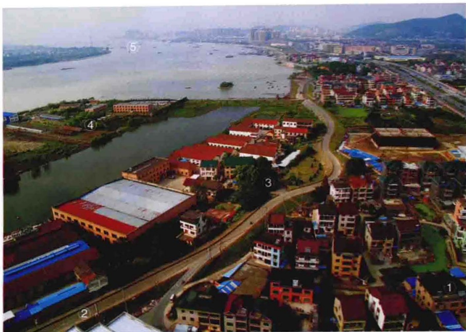
①下坟头、②西江塘、③塘外、④小围垦北部、⑤三江口鸟瞰(2011年摄于金城三江高层楼顶)