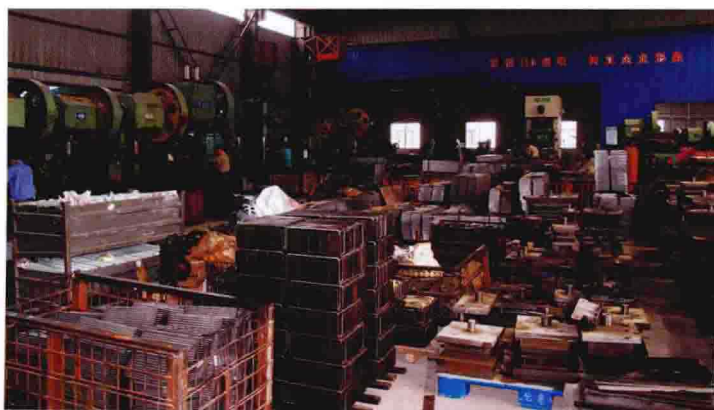
汽车、五金机械配件企业（2012年摄）