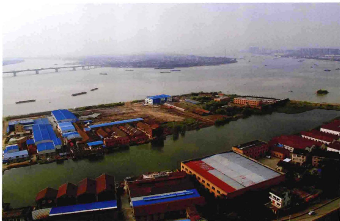
坐落在小围垦的工业小区（2011年摄）