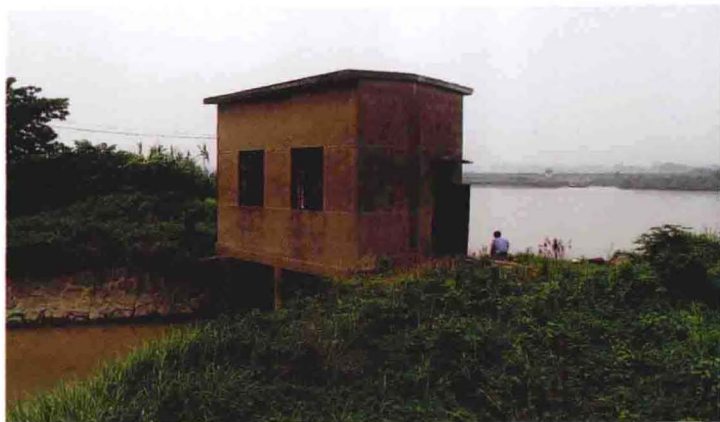
杨家浜机埠配套设施（2011年摄）