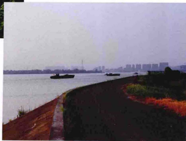
山后村外江小围堤（2012年摄）