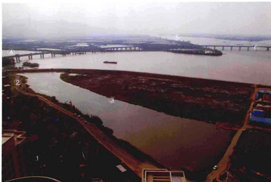
①孔家埠、②西江塘、③小围垦南部、④浦阳江、⑤富春江、⑥袁浦大桥鸟瞰（2011年摄于金城三江高层楼顶）