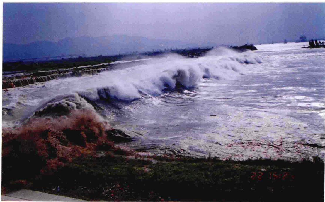
钱江涌潮——2002年八月潮到达山后小围垦北塘的情景