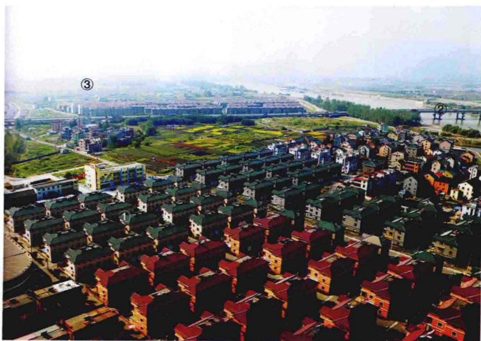
①宏大房（新村）、②孔家埠、③河南桥鸟瞰（2012年杨贤兴摄）