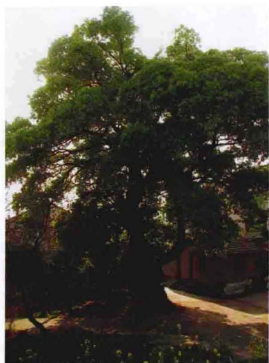
下坟头西江塘外大樟树（2011年摄）