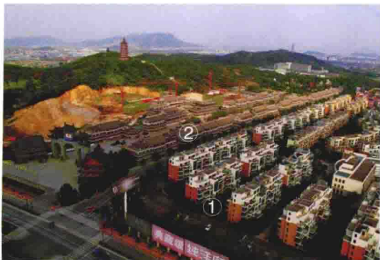
①三水一生、②东方文化园步行街鸟瞰 （2011 年摄于金城三江高层楼顶）