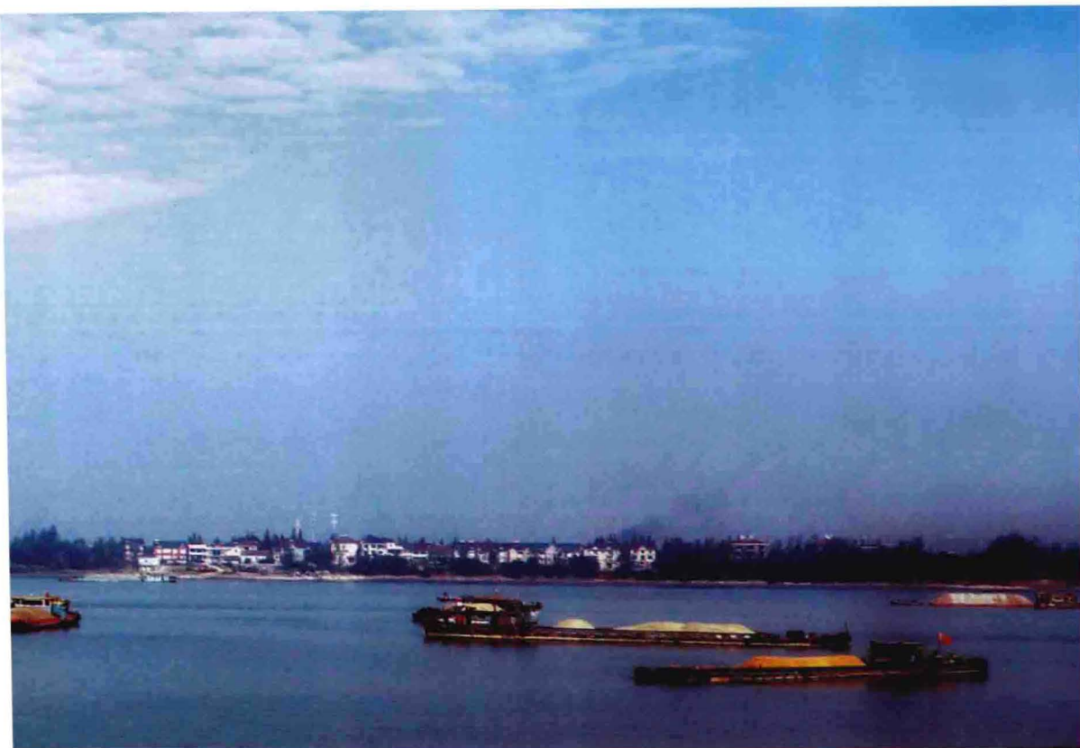
渔浦新景——三江口（山后小围垦外，2012年）