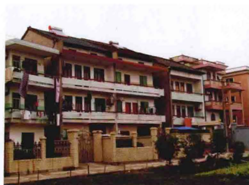
1990年代民居（2011年摄于双桥头）