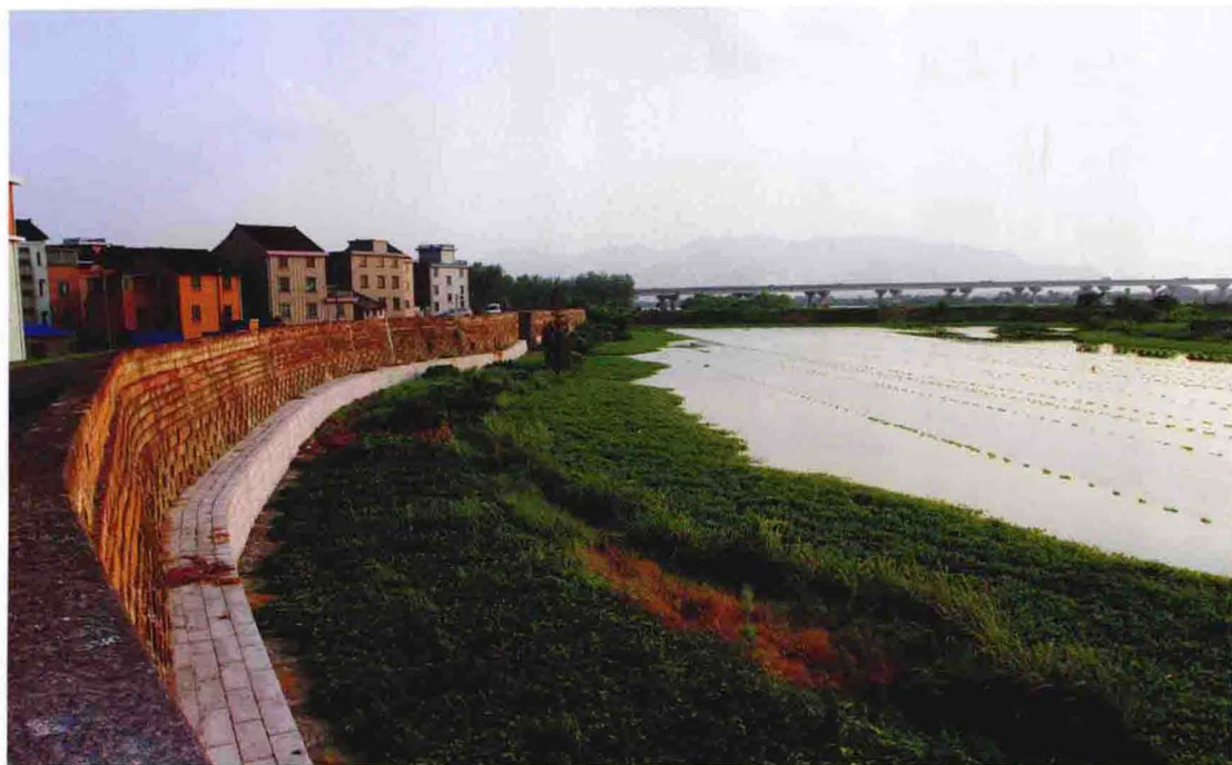
始筑于清朝的西江塘石塘（2012年摄）