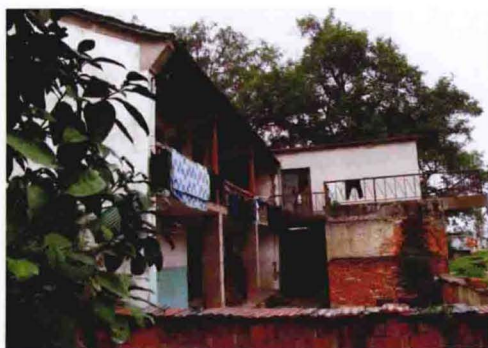
1970年代民居（2011年摄于双桥头）