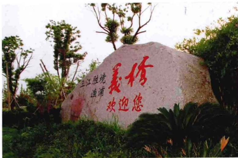
立于村区杭州绕城公路义桥互通出口与四季大道交汇处（2012年摄）