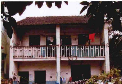
1980年代民居（2011年摄于双桥头）