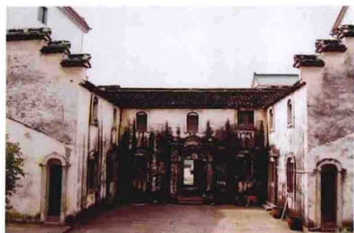
建于民国时期的民居（双桥头）