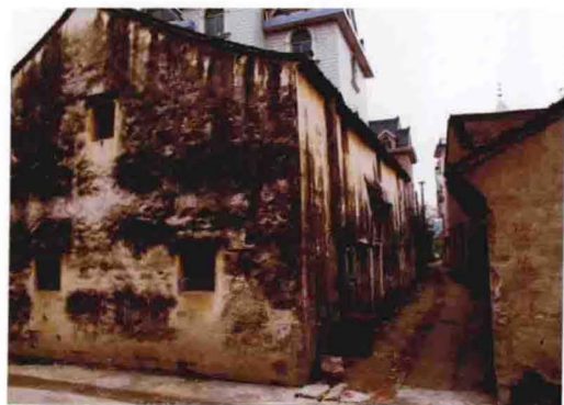
建于民国时期的民居（2011年摄于孔家埠）