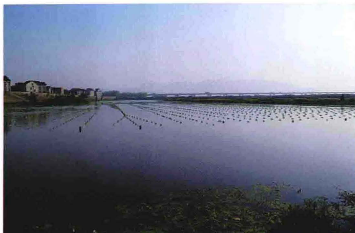
小围垦水产养殖（2011年摄）