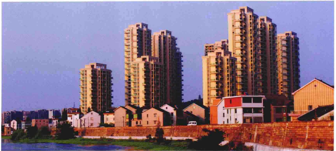
金城三江住宅小区远眺（2012 年摄）