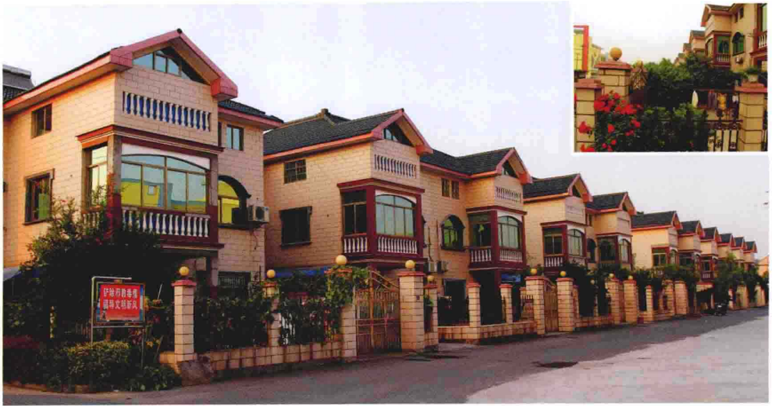
21 世纪初新农村（宏大房，2012 年摄）