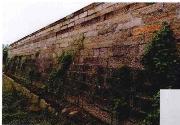
修筑于清朝的西江塘石塘