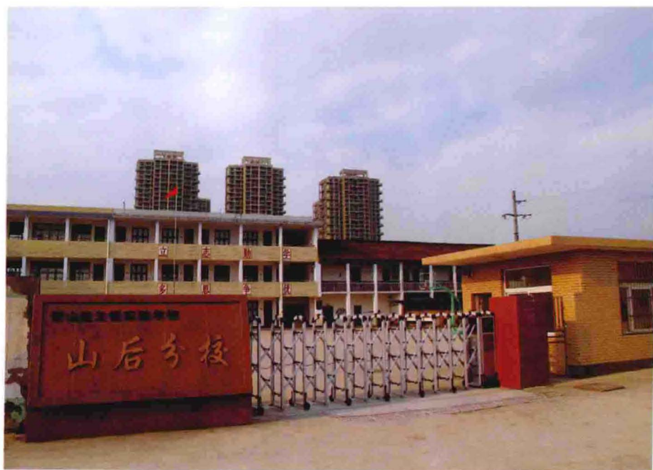
义桥实验学校山后分校（2012年摄）