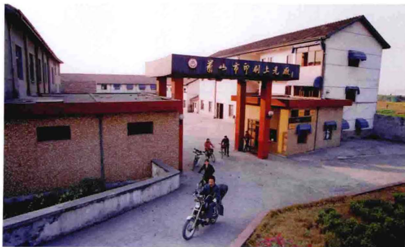
萧山市印刷上光厂