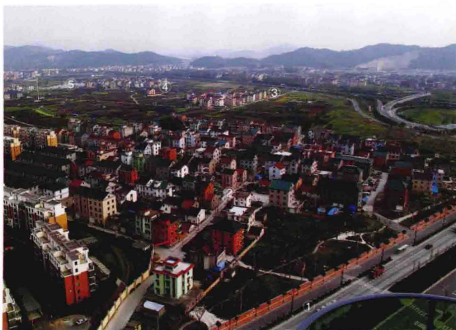
①四季大道、②双桥头、③东小华家、④亭子头、⑤官船潭鸟瞰(2011年摄于金城三江高层楼顶)