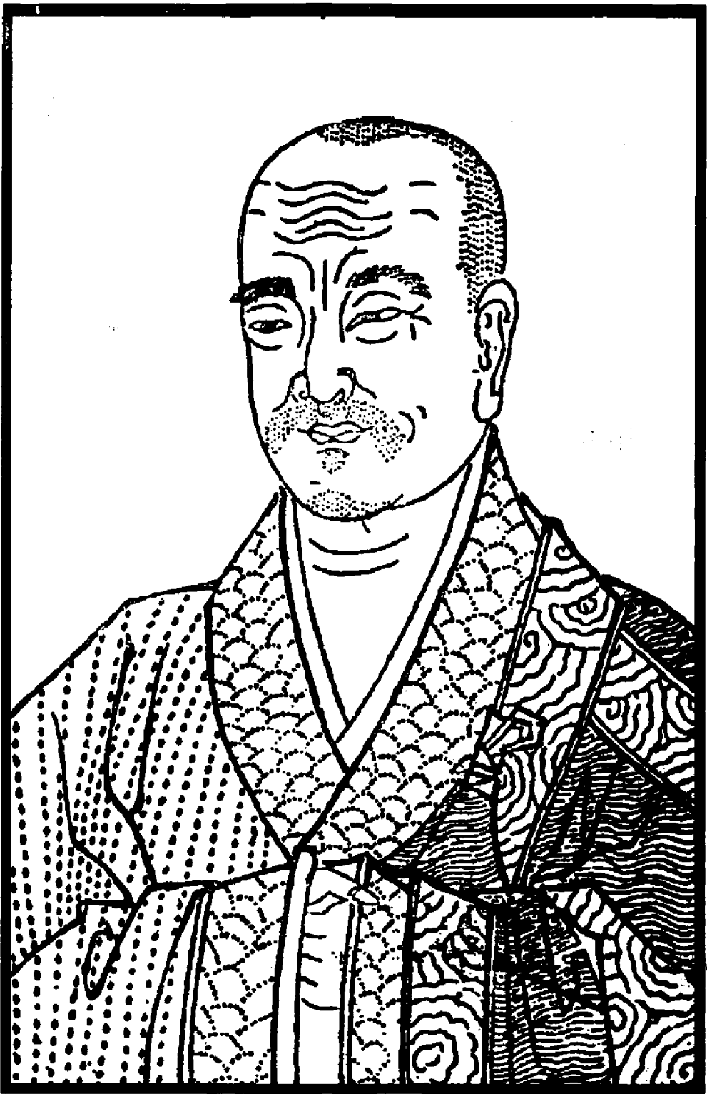
蓮社初祖晉廬山慧遠法師