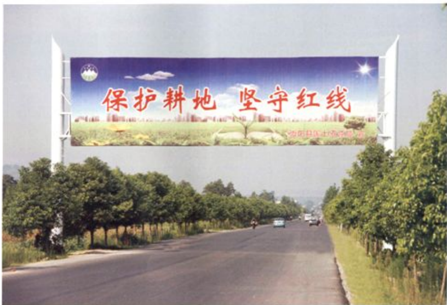
2011年8月，县国土资源局在106国道崇阳白霓段设立巨幅耕地保护宣传牌。