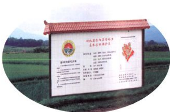
基本农田保护标志牌。