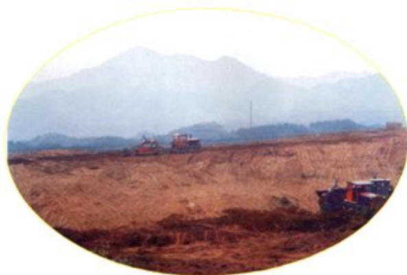
正在进行施工作业的跑马岭土地开发整理项目区。