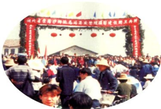
2001年10月18日，崇阳县首个省级投资土地开发整理项目——跑马岭土地开发整理项目开工典礼现场。