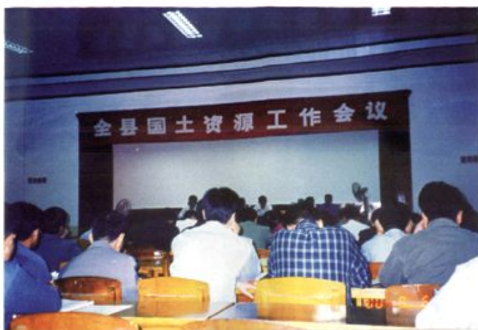
2000年9月6日，县委、县政府组织召开全县国土资源工作会议。