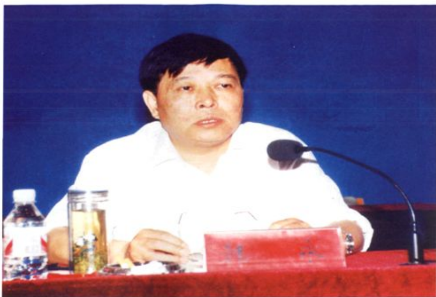
2001年5月12~13日，全省土地使用制度改革现场会在崇阳召开。图为省国土资源厅厅长韩永在会议上讲话。