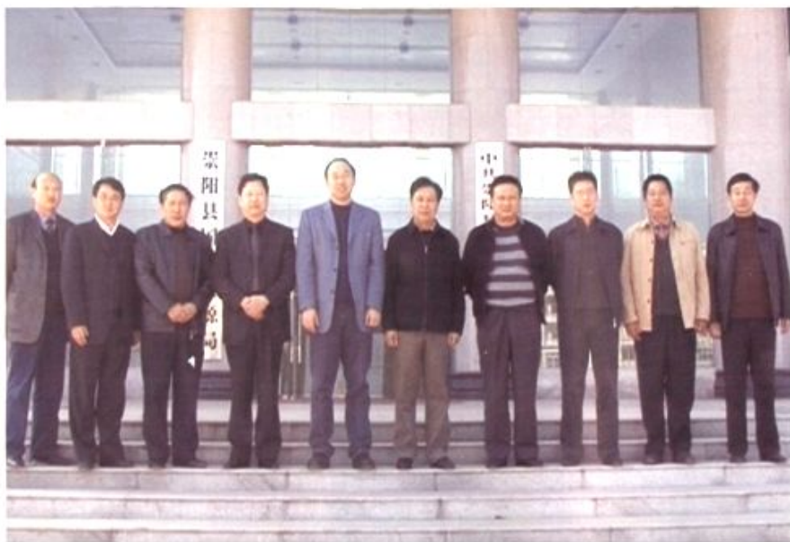
2008年12月9日，省国土资源厅厅长杜云生（右五）在市委常委、常务副市长胡立山（左五）、市国土资源局局长皮凌（左四）陪同下，来崇阳调研国土资源工作。