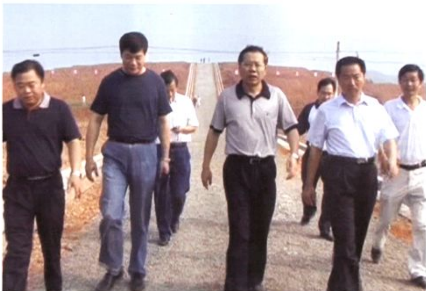
2009年5月20日，省委常委、省政府副省长汤涛（左三）在市政府副市长镇方松（左一）、县委书记程群林（右二）陪同下，视察崇阳低丘岗地改造工作。