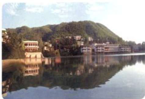
金沙避暑山庄风景区

THE TERRITORIAL RESOURCES HISTORY OF CHONGYANG COUNTY