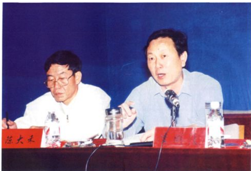
2001年5月13日，中共咸宁市委书记李明波(右)出席全省土地使用制度改革现场会并讲话。