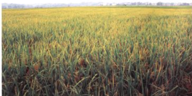
肖岭乡霞星村 基本农田保护区。