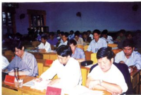
2000年9月6日，各乡镇、县直相关单位负责人参加全县国土资源工作会议。