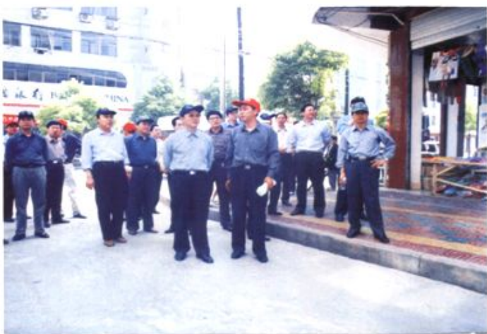
2001年5月12日，参加全省土地使用制度改革现场会的各市、州和部分县(市)国土资源部门负责人参观崇阳县首次以拍卖方式出让国有土地使用权建成的天城镇戴家井商业步行街。