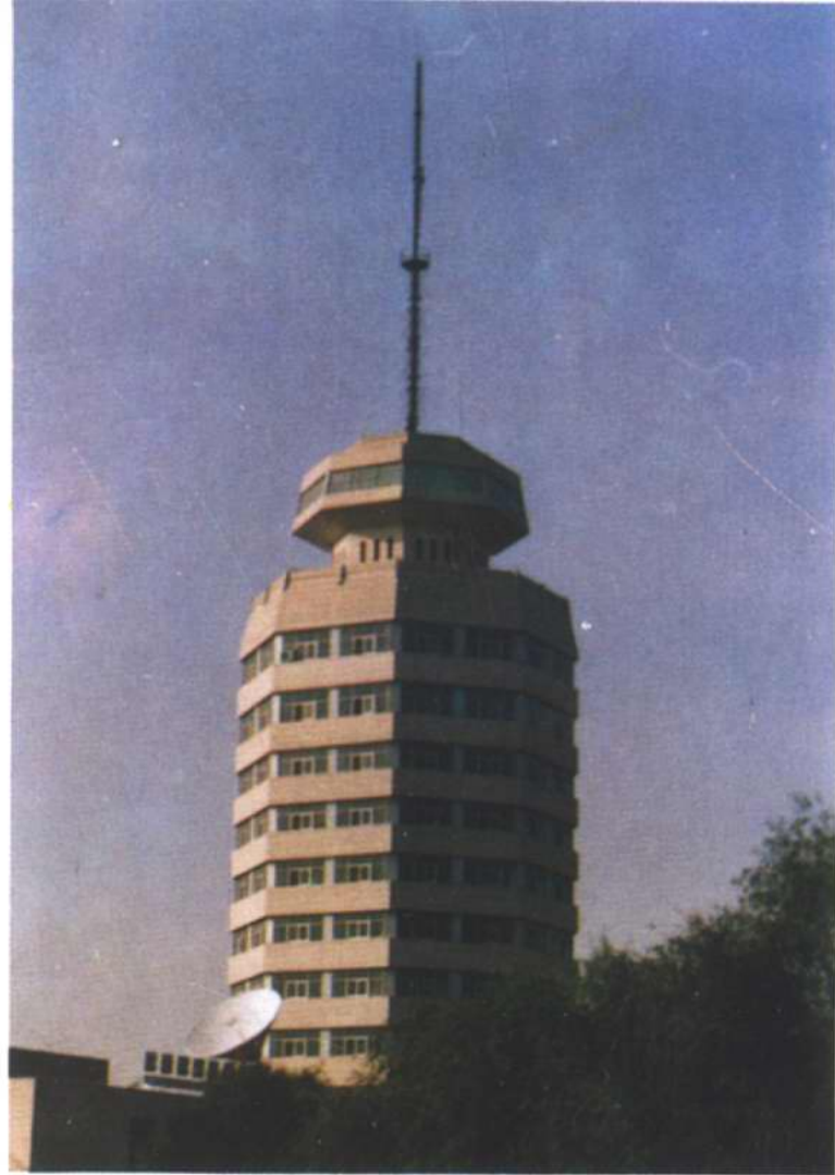
太原广播电视大楼