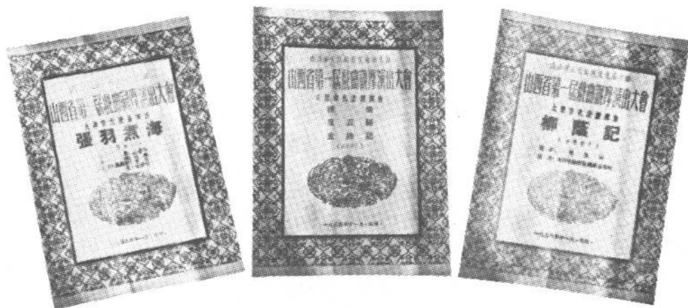
1954年，山西省第一届戏曲观摩会演太原市代表团演出剧目说明书。