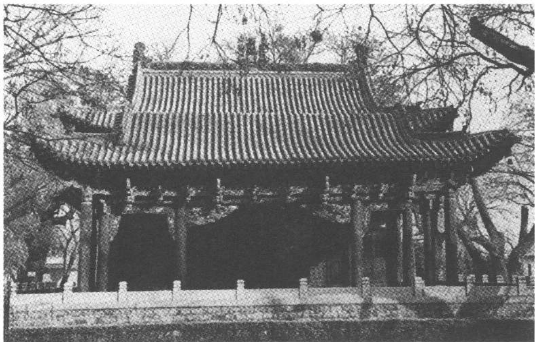
建于明嘉靖前的太原晋祠“水镜台”戏台。