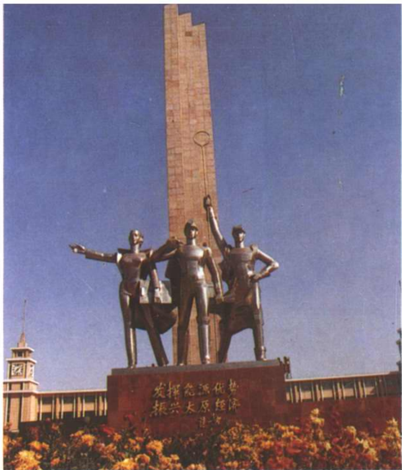
火车站《能源纪念碑》