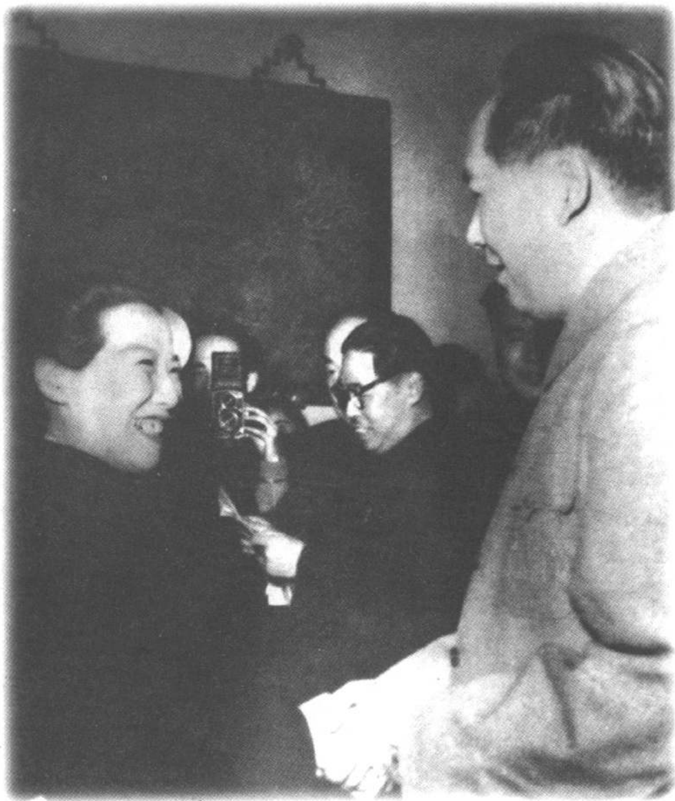
1952年,全国第一届戏曲观摩会演期间,毛泽东主席接见丁果仙等。