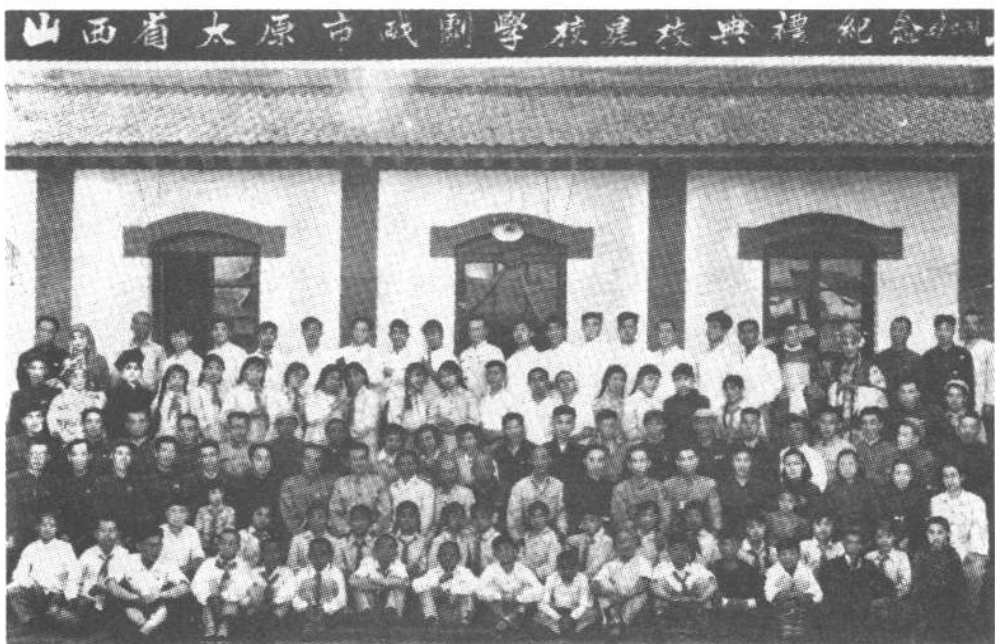
1957年5月,太原市戏剧学校建校典礼。