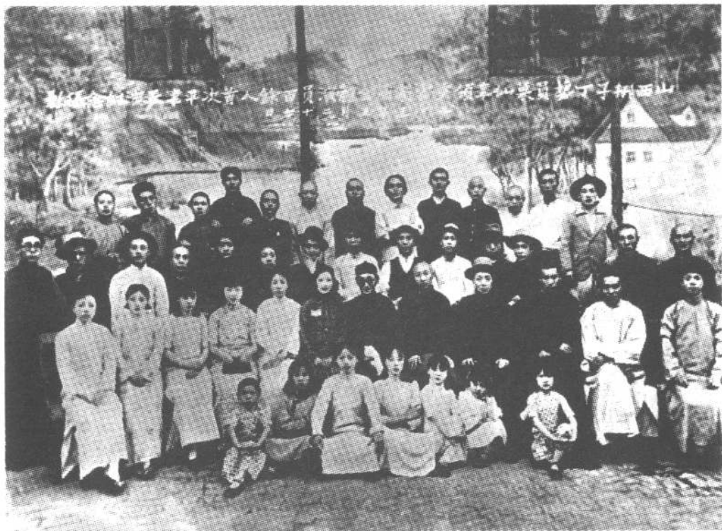
1936年，丁果仙率步云剧社赴天津演出留影。