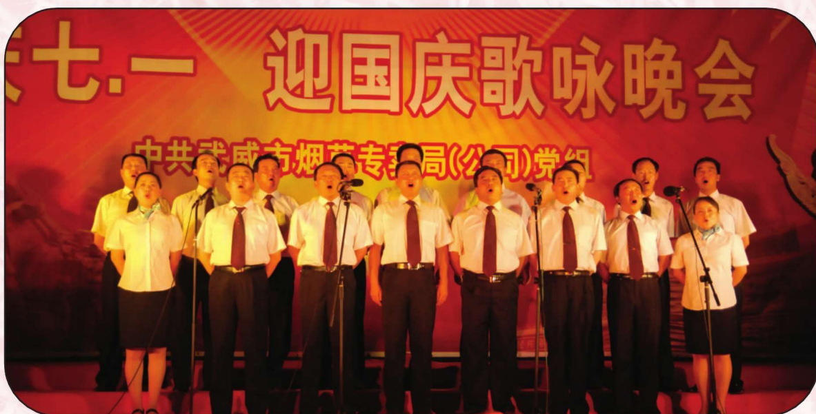
武威市烟草专卖局(公司)“庆七一·迎国庆”歌咏晚会