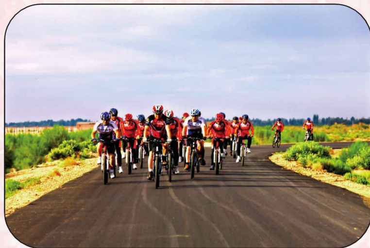
武威烟草“驰者无疆”自行车骑行俱乐部