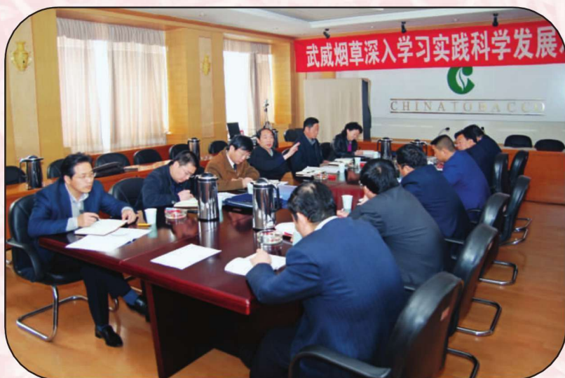
武威烟草深入学习实践科学 发展观