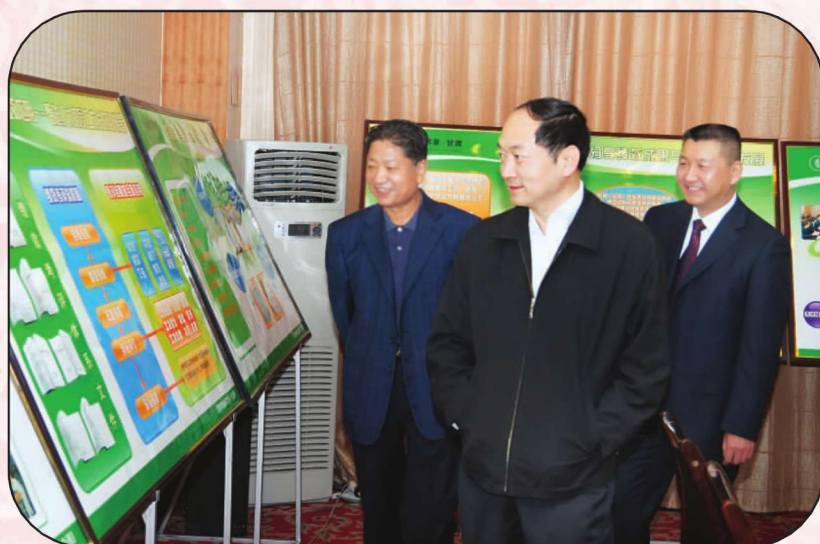
甘肃省烟草专卖局(公司)领导参观武威烟草绩效考核建设成果