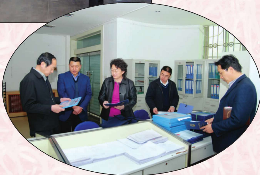
甘肃省烟草专卖局(公司)领导检查指导武威烟草网建工作