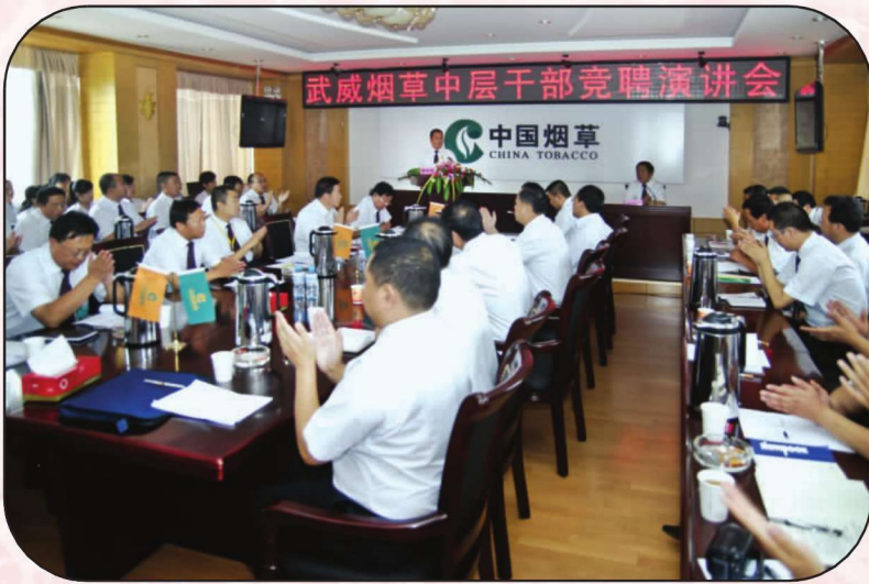
武威烟草中层干部竞聘 演讲会