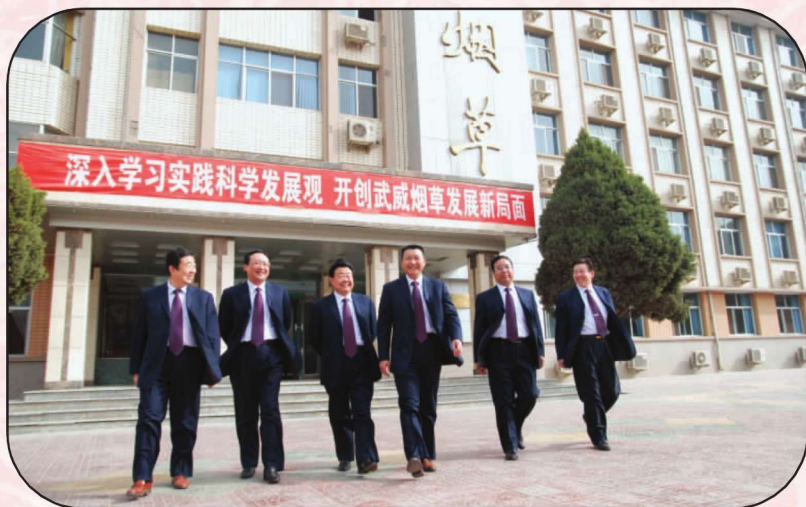
武威市烟草专卖局(公司) 领导班子(2008年)