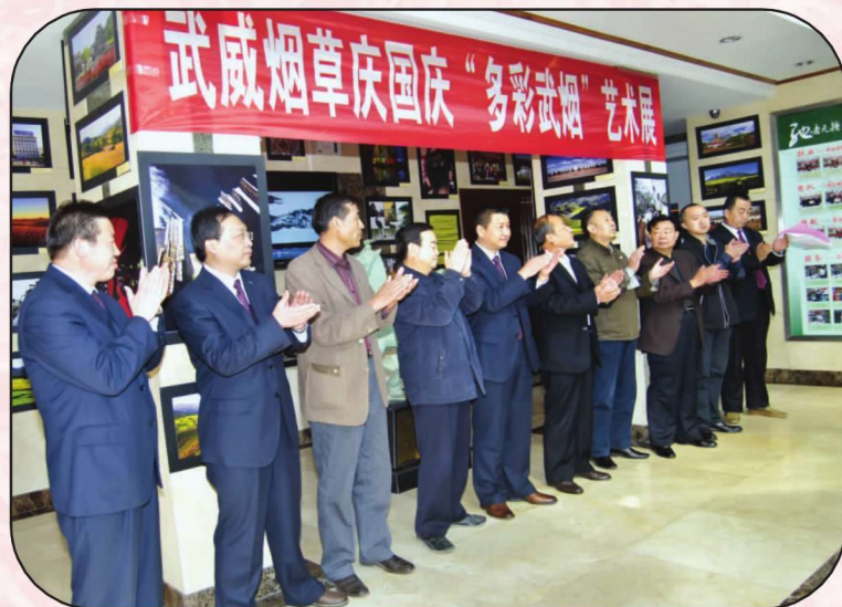
武威烟草庆国庆“多彩武烟”艺术展