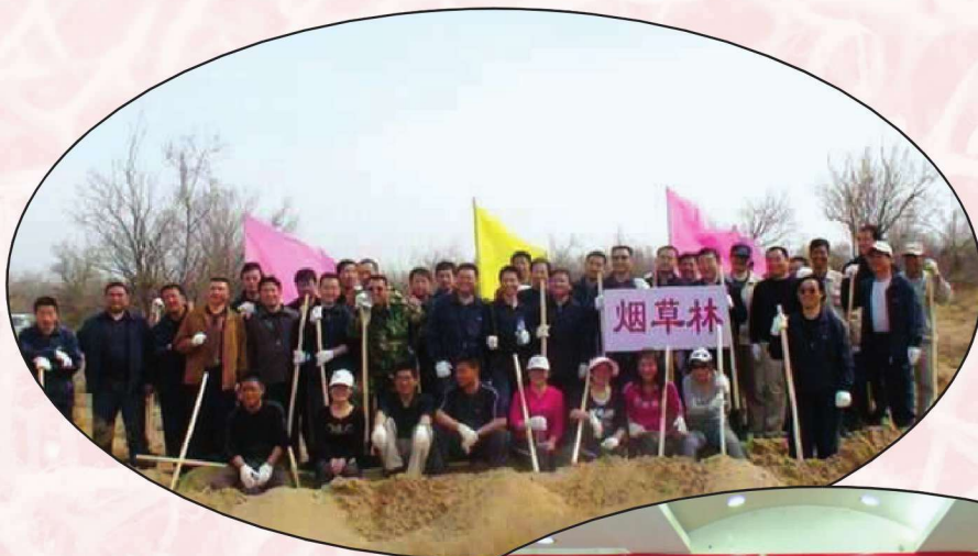
武威市烟草专卖局 (公司)积极参与义务植 树活动