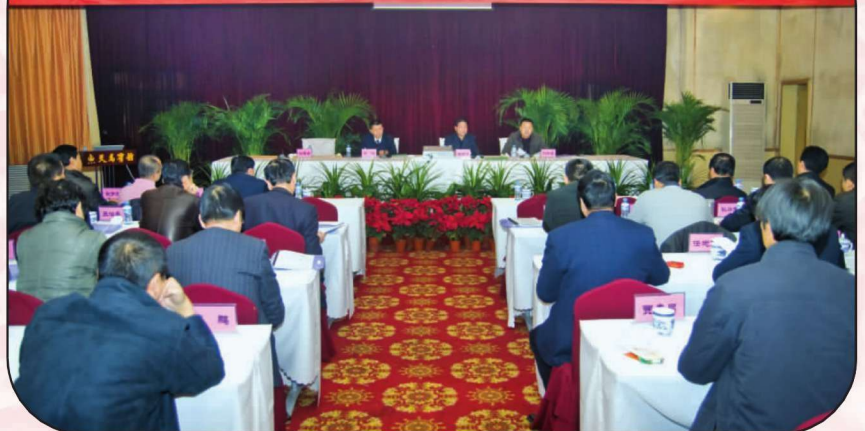
甘肃省烟草专卖内管综合监管系统应用推广现场会在武威召开