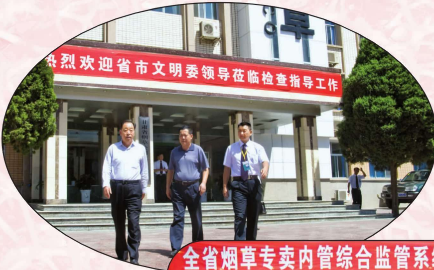
甘肃省文明委领导检查指导武威烟草精神文明创建工作