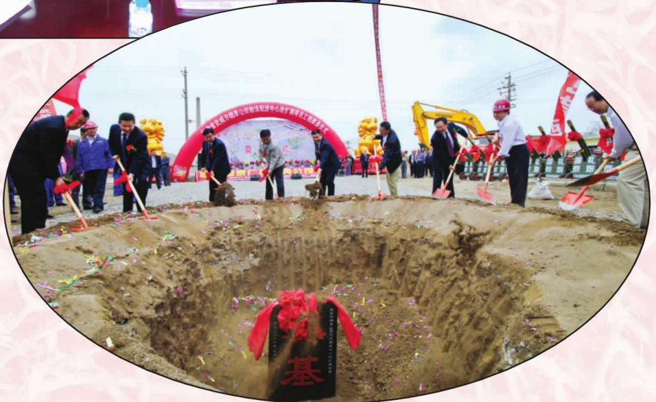
武威市烟草专 卖局(公司)物流配 送中心改扩建项目 工程奠基仪式