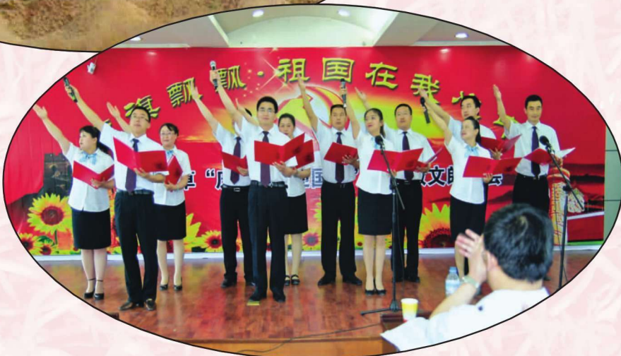
武威市烟草专卖局 (公司)“庆七一”诗歌朗诵 会