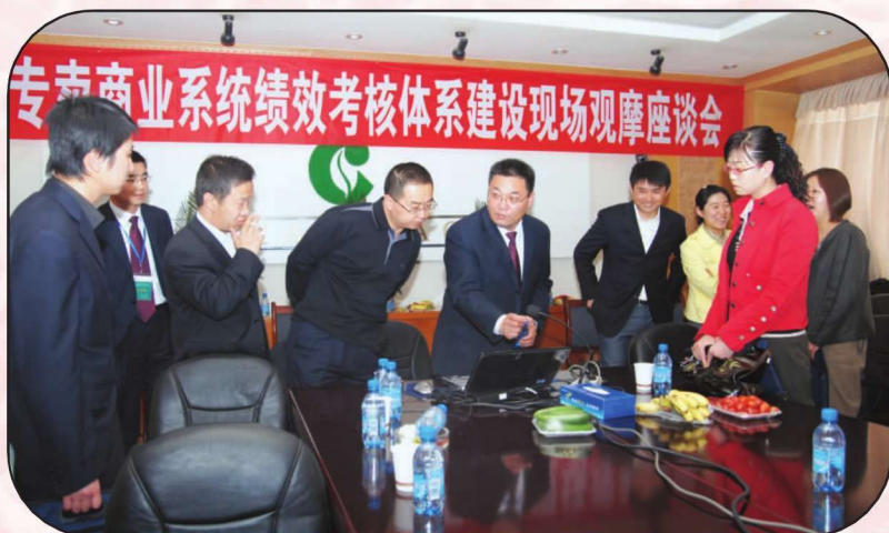
甘肃省烟草专卖商业系统 绩效考核现场会在武威召开