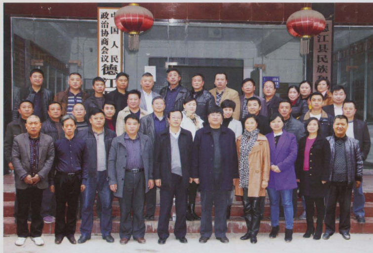
2014年政协机关干部职工合影