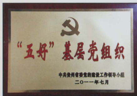
省委命名为五好基层党组织