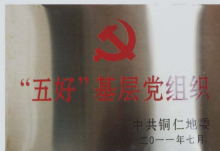
地委命名为五好基层党组织