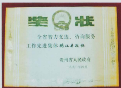
全省智力支边先进