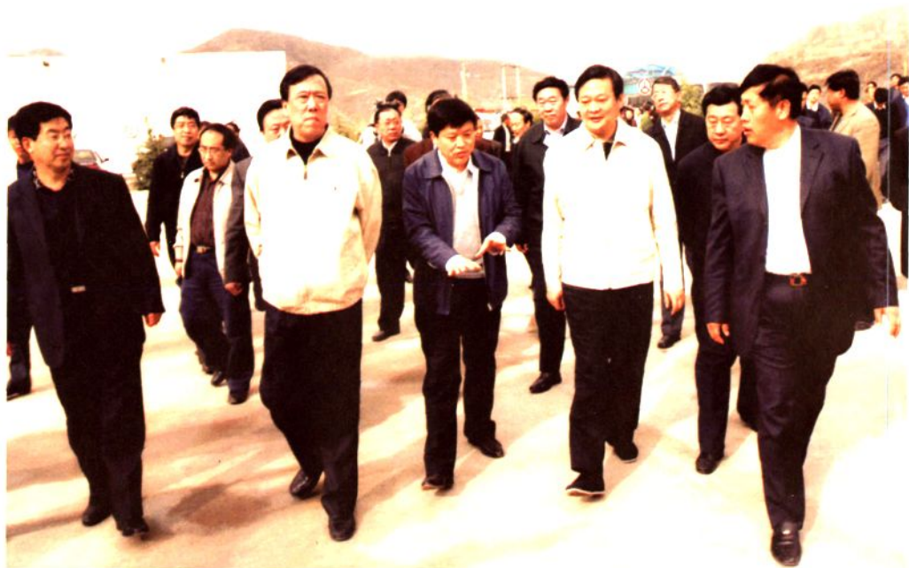
▲ 2006年4月14日，山西省省长于幼军（前排左四）在市县领导陪同下视察昔阳“双通”工程