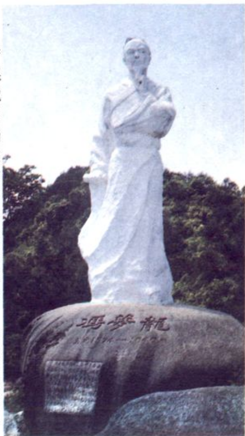
明朝通俗文学家、寿宁知县冯梦龙在寿宁的塑像

宁德地区档案馆开展征集工作。图为接收到的李鹏总理、刘华清副主席等中央、省有关领导为闽东苏区创建六十周年的题词原件。