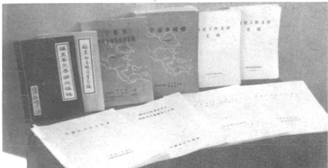
宁德地区地、县(市)档案馆。近年来依据档案史料编写的部分编研材料