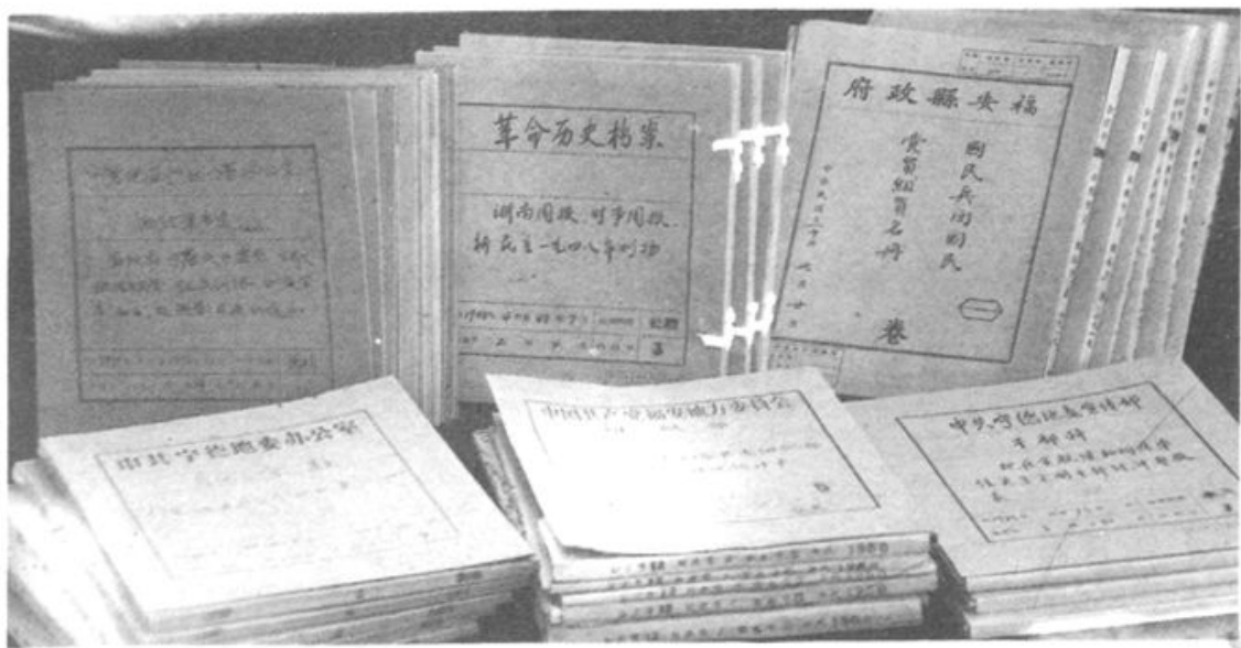
宁德地区档案馆馆藏的部分民国档案、革命历史档案、建国后的档案。