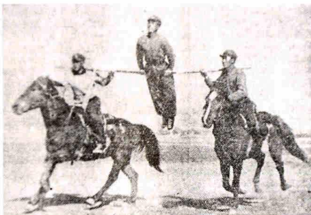
50年代兰州军区部队 马上单杠表演