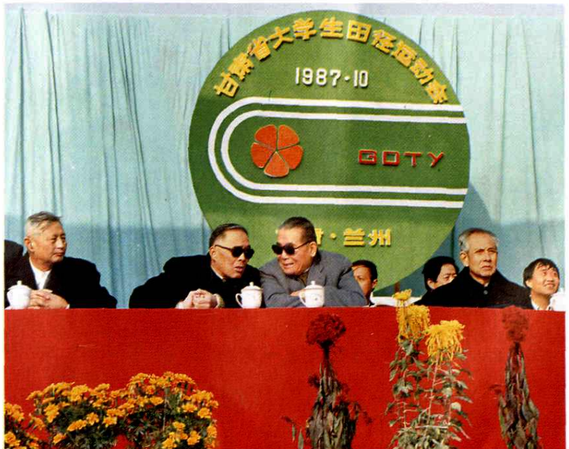
省委副书记刘冰(左二)、中顾委委员黄罗斌(左三)、省政协副主席李之钦(左四)等领导同志观看省大学生田径运动会