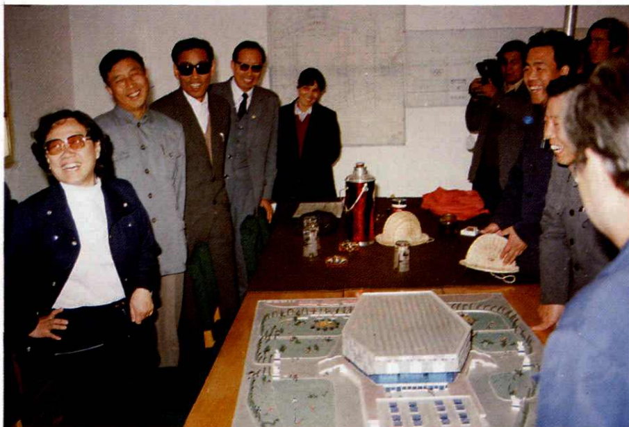
兰州体育馆初建时国家体委副主任张彩珍(左一)视察兰州体育馆设计模型