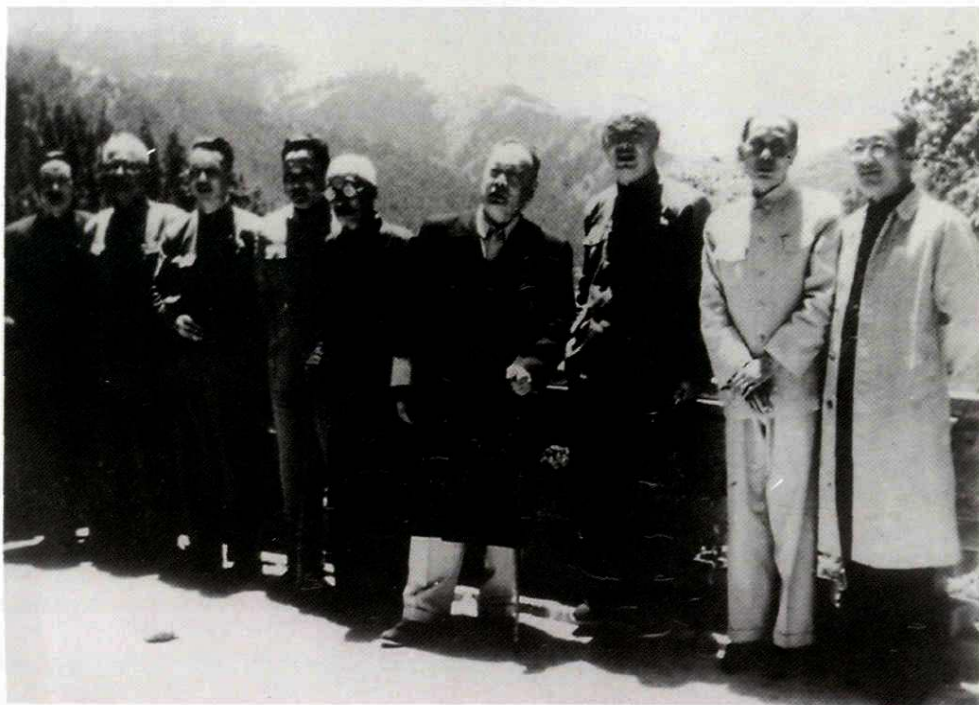
1956年邓宝珊省长(右三)邀请陈毅元帅(右四)与甘肃象棋高手彭述圣(右五)对弈后游览兴隆山时的合影