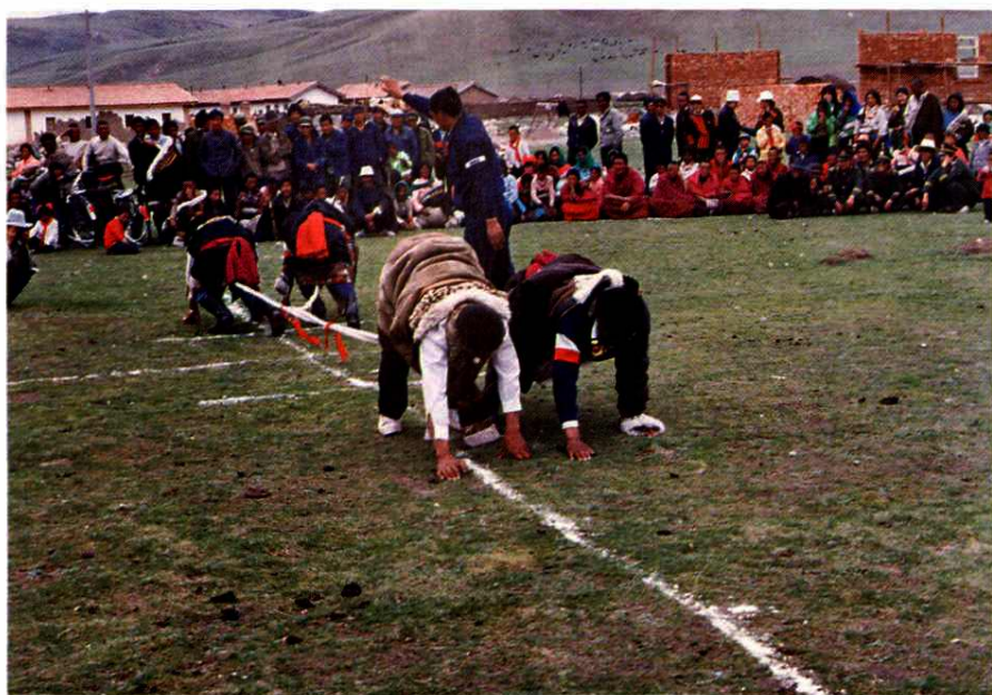
甘南藏族双人大象拔河