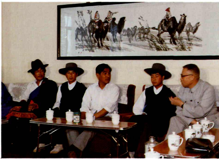
省委副书记卢克俭(左三)接见参加民族运动会的藏族运动员