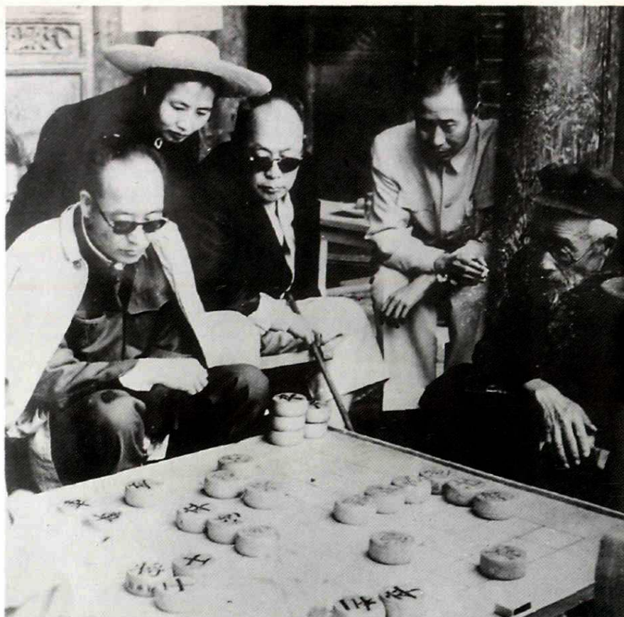
1956年6月，陈毅元帅、张经武将军、韩练成将军及张茜同志在兴隆山太白泉和兰州的彭述圣对弈