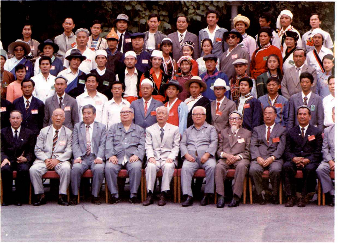
1987年9月在全国第三届少数民族运动会期间万里、杨静仁、刘澜涛、江华等党和国家领导人接见东乡、裕固、保安及其他少数民族体育先进集体代表时的合影