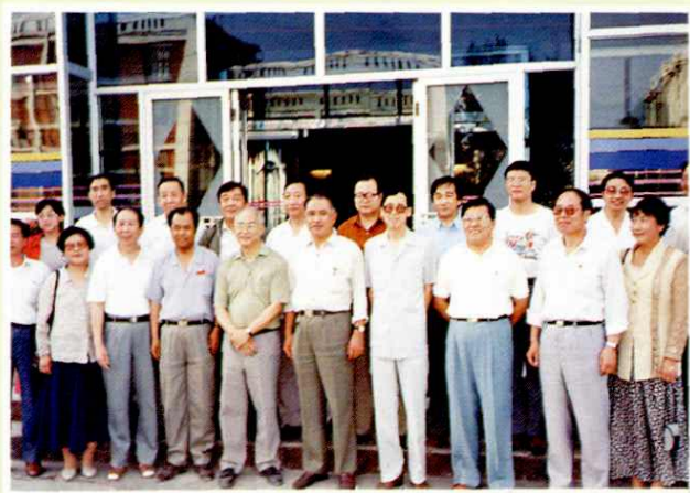
省体委副主任张嗣让(右二)陪同全国政协常委、原国家体委副主任、中国奥委会主席何振梁(前排左四)和有关部门领导来我省检查体育先进县建设情况时与省政协、嘉峪关市的领导合影。