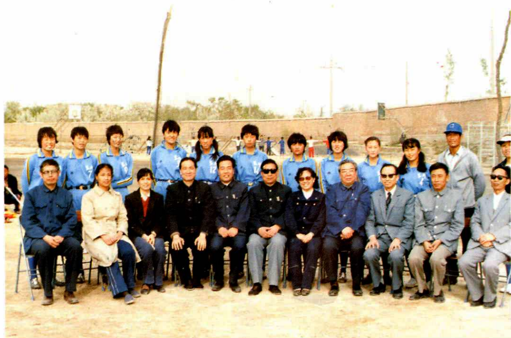
1985年, 国家体委副主任张彩珍(前排右五)与省体委主任张维国(前排右六)、副主任赵克信(左四)、兰州市副市长张文范(左五)、原省体委主任苏创夫(右四)在兰州市了解女子垒球队情况时的合影