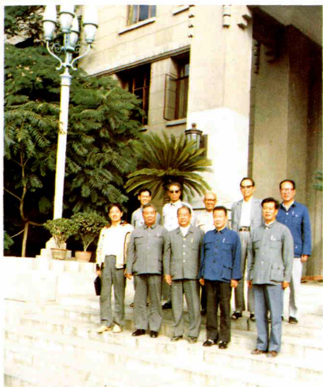
1985年 国家体委主任李梦华(前排右三)与省体委副主任张嗣让(后排右一)、梁守礼(前排右一)、田鸿章(后排左一)及原省体委主任钟仰高(后排右三)、苏创夫(前排左二)、副主任田景福(后排左二)在兰州饭店合影