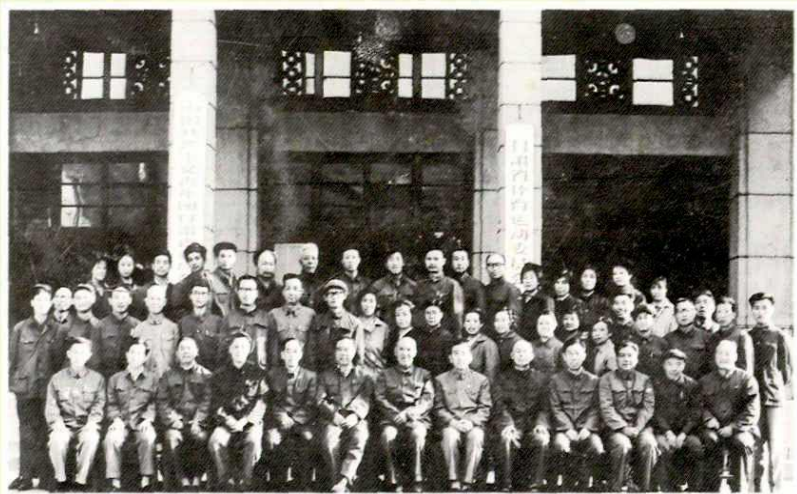
1979年9月国家体委主任王猛(前排右六)副主任李梦华(前排左六)来我省检查工作时与省体委领导钟仰高(左七)阮长庚(右五)和机关全体干部合影。