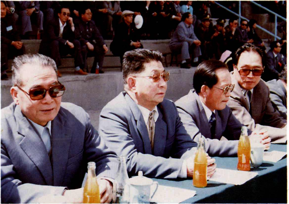
(左起)中顾委委员黄罗斌、省委书记李子奇、省长贾志杰、兰州市市委书记王金堂参加第一届全省农民运动会开幕式