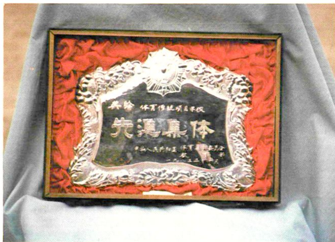
1983年国家体委奖给峨山县化念中心小学游泳传统项目学