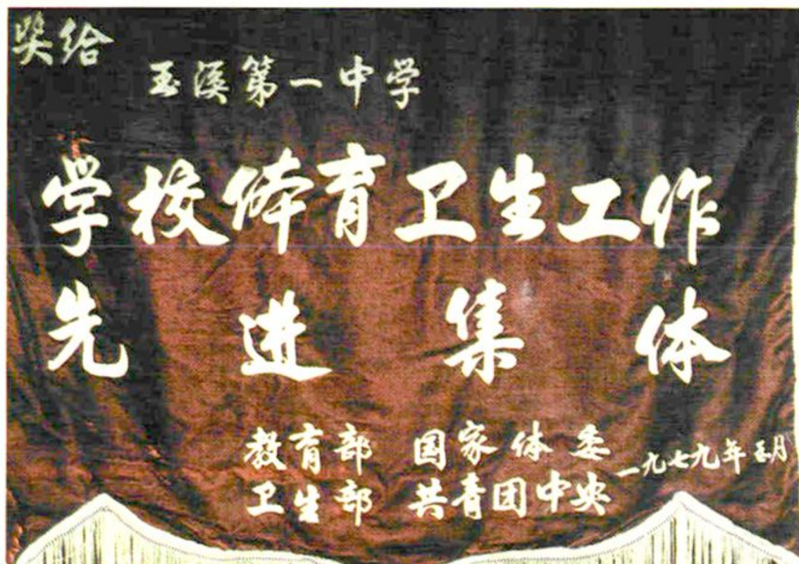
玉溪一中曾4次荣获国家“体育先进学校”称号