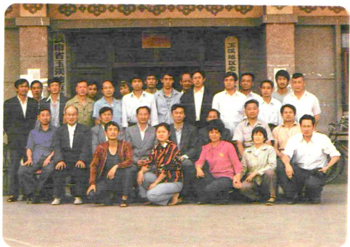
1987年5月9日国家体委副主任袁伟民到玉溪检查工作与地区体委全体同志合影。（二排左起第五名为袁伟民）