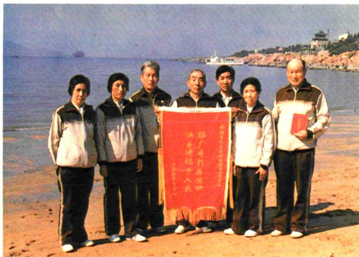
1987年玉溪地区代表队代表云南省出席青岛首届全国 导引养身功邀请赛