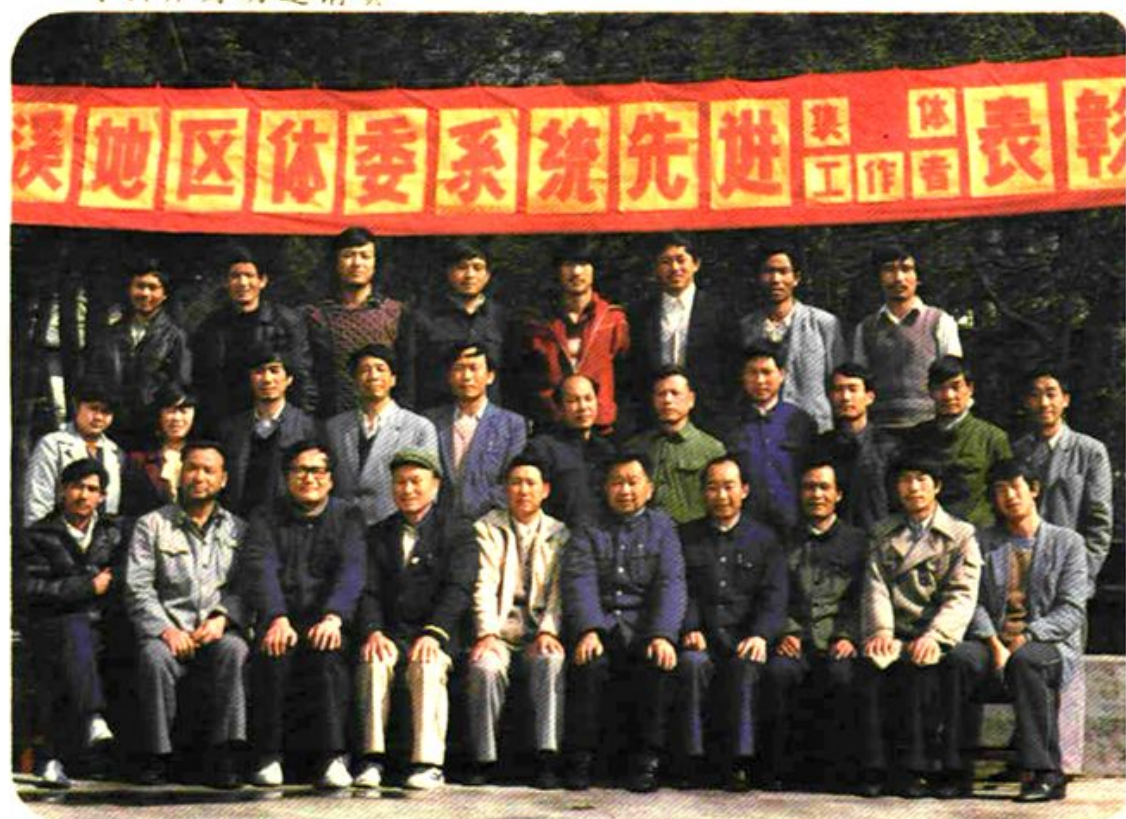
1987年玉溪地区体育系统表彰先进体育工作者及先进集体 试读结束，需要全本PDF请购买 www.ertongbook.com