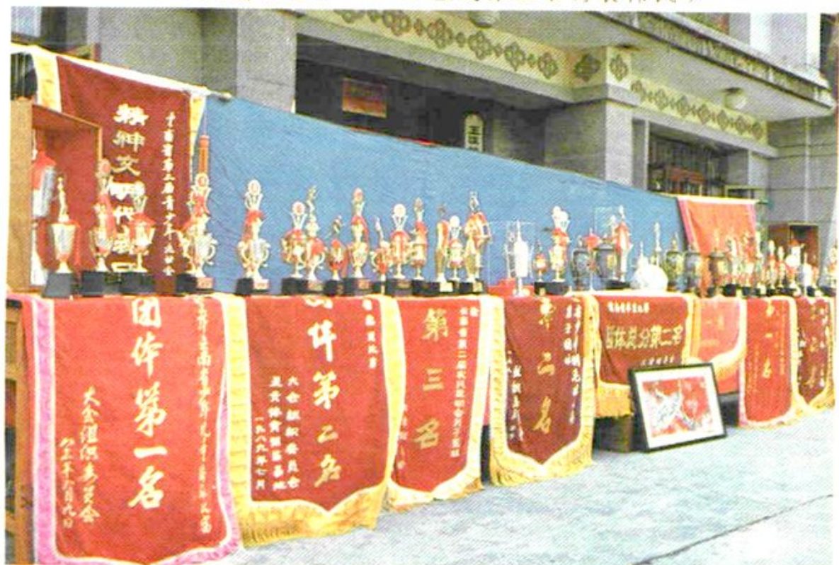
地区体育代表队荣获的部份锦旗、奖杯