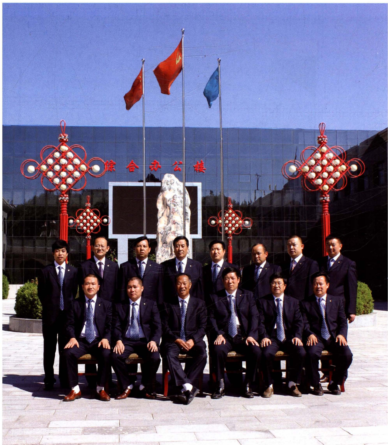
公司全体领导在行政办公楼前合影