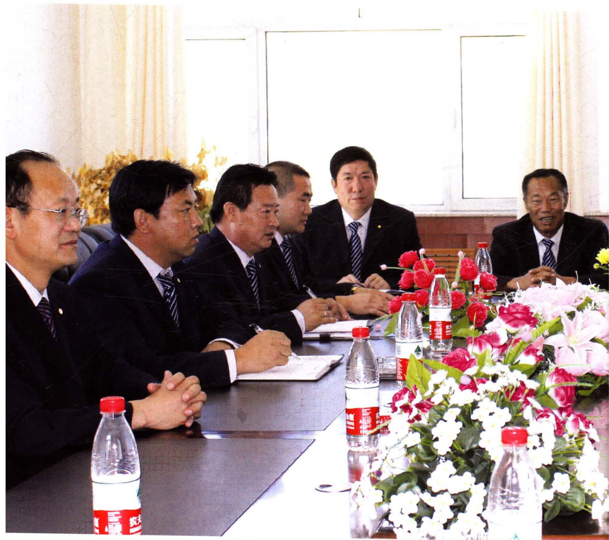
年富力强、团结战斗的公司（矿）领导班子