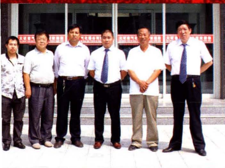
公司主要领导和主创人员