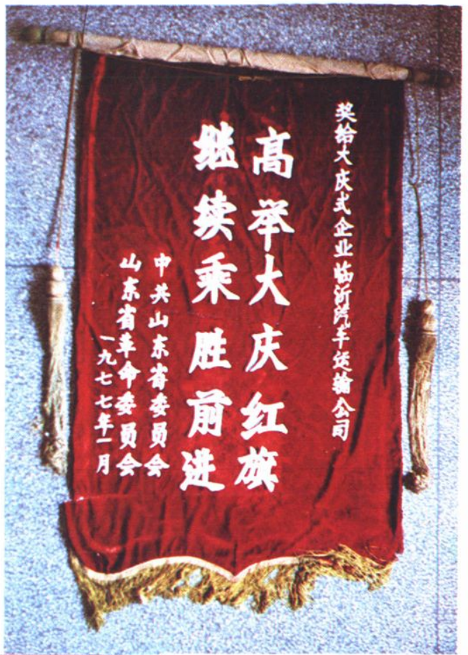
→一九七七年一月，被中共山東省委、山東省革委 授予『高舉大慶紅旗，繼續乘勝前進』錦旗。