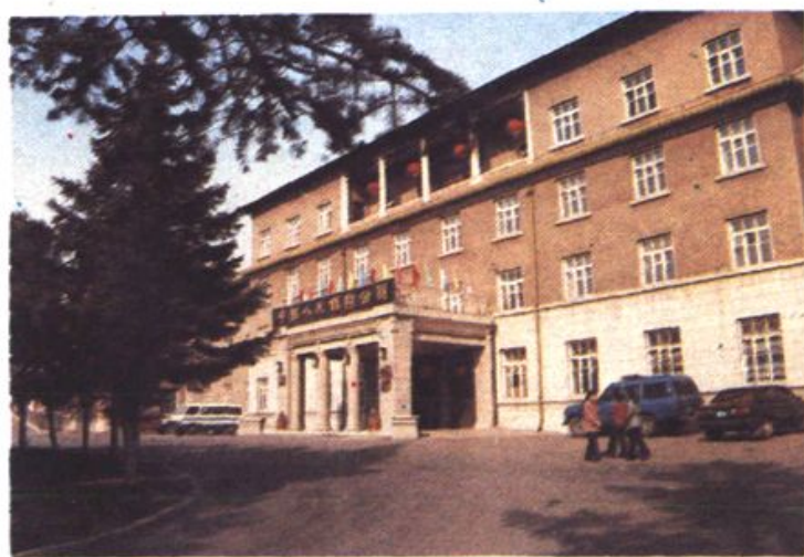
中国人民保险公司抚顺市分公司办公大楼