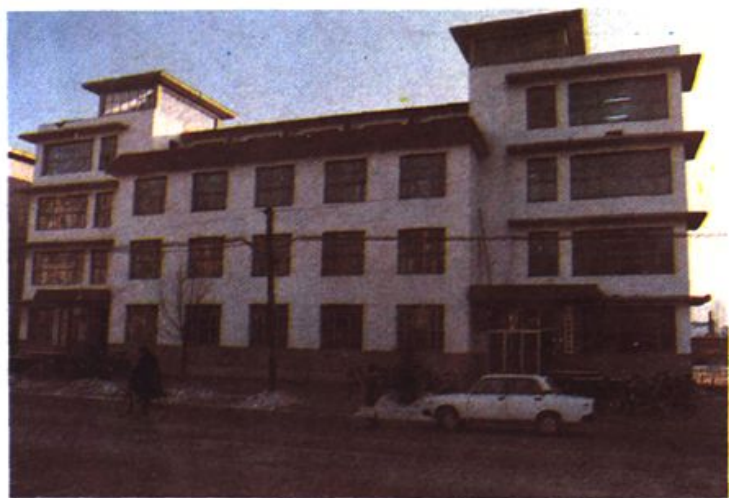
中国人民保險公司清原县支公司办公楼