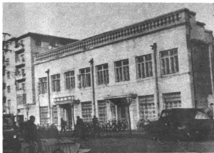
中国人民保险公司抚顺市支公司1953年— 1958年办公大楼