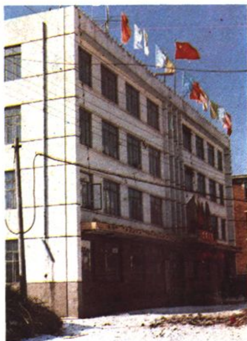
中国人民保險公司 新宾县支公司办公 楼