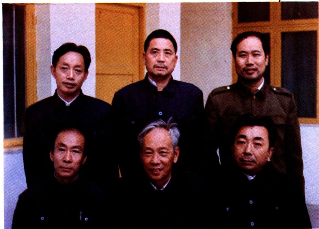
思南县金融志编纂领导小组成员