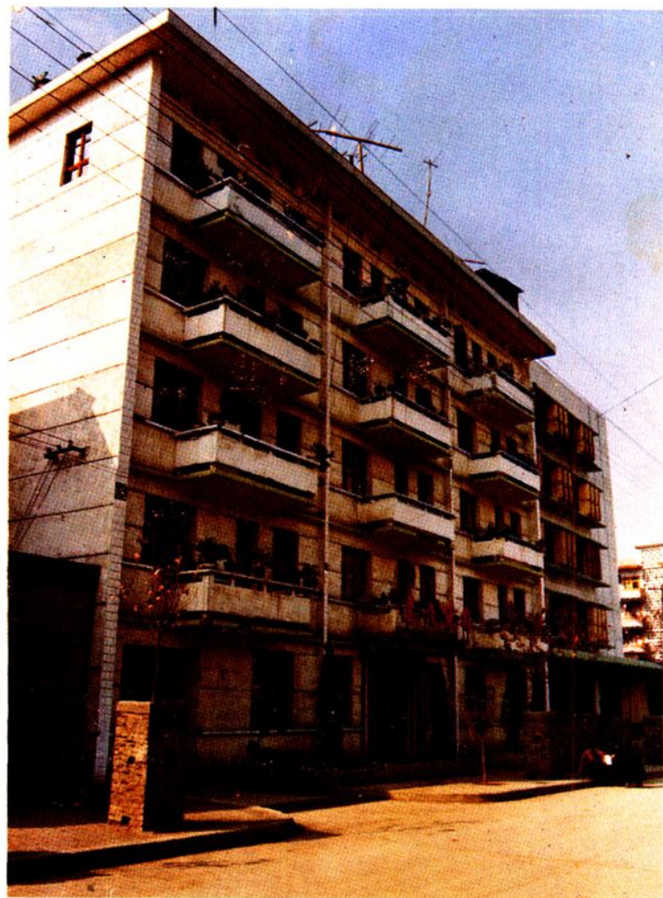
中国人民建设银行思南县支行