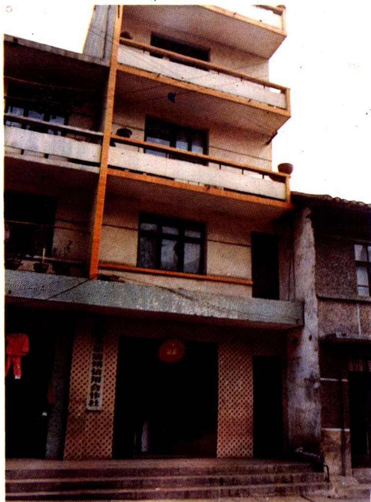
思南县思唐镇信用合作社