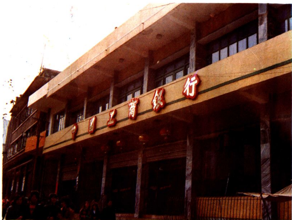
中国工商银行思南县支行