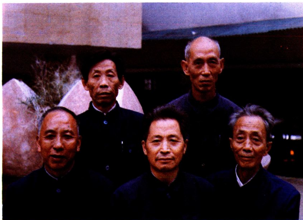
思南县金融志编写组工作人员