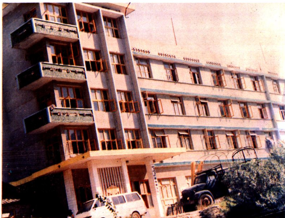
中国农业银行思南县支行