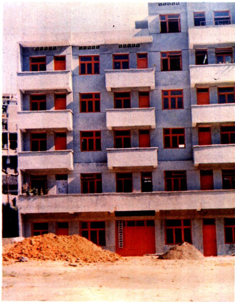
思南县信用合作社联合社