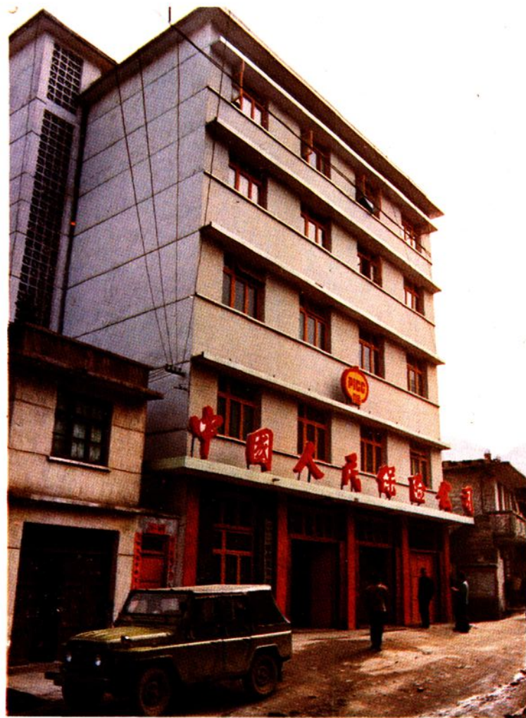
中国人民保险公司思南县支公司