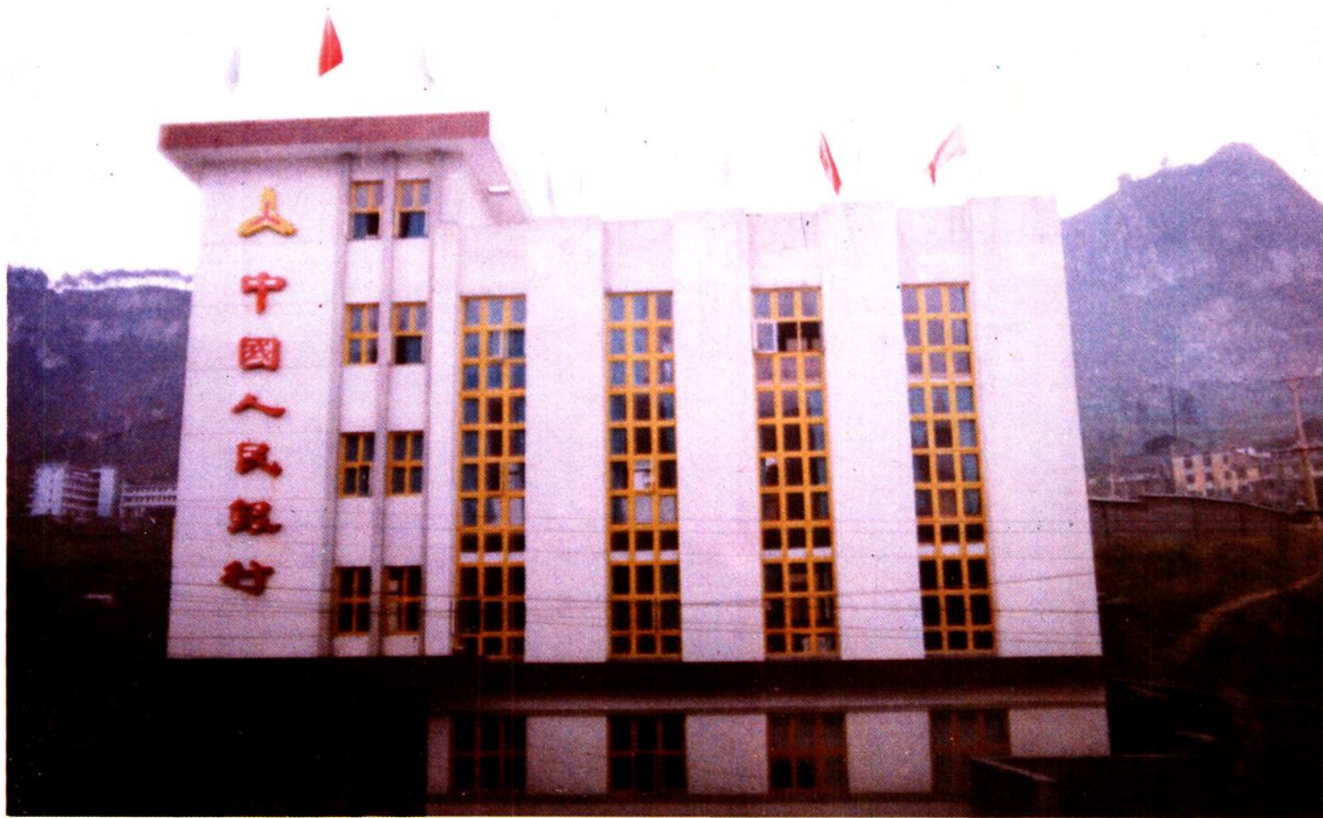
中国人民银行思南县支行