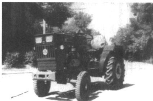
银拖-12/15型四轮拖拉机

银拖-12/15型四轮拖拉机 该机是为适应市场需要开发的系列产品,1983年从山东潍坊拖拉机厂引进,1984年样机试制。银拖-12和银拖-15型拖拉机,分别采用东风S195柴油机(额定功率8.82千瓦)和重柴CC195柴油机(额定功率11.03千瓦),拖拉机前进分六档,配带相应的农具,可进行耕地、耙地、播种、中耕、收割等田间作业。备有牵引挂拖装置,可带拖车进行运输作业,利用动力输出轴和皮带轮做动力,可进行排灌、脱粒及农副产品加工等固定作业。