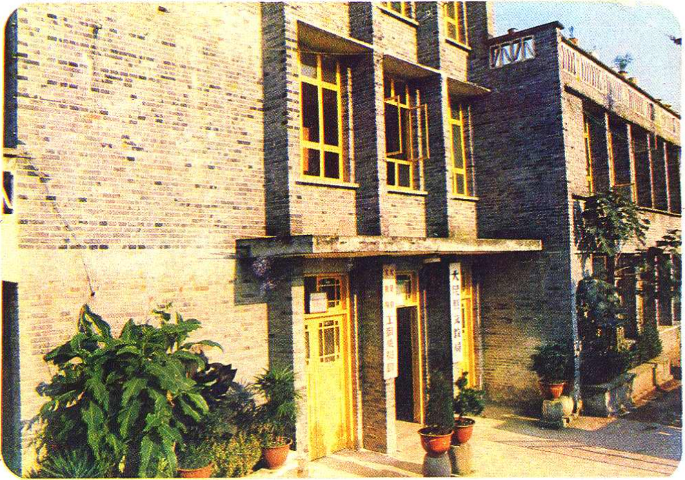
大足县文教局座落在城北龙岗山麓。