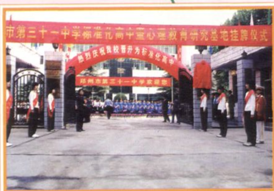
标准化高中暨心理教育研究基地挂牌仪式