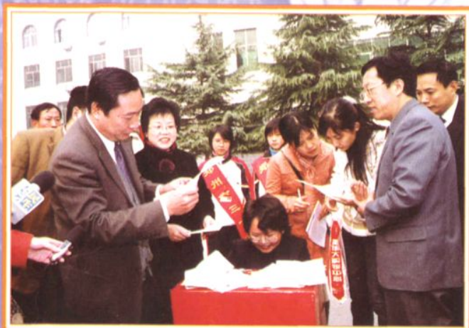
市教育局党委书记、局长司福亭(左一) 到校视察工作