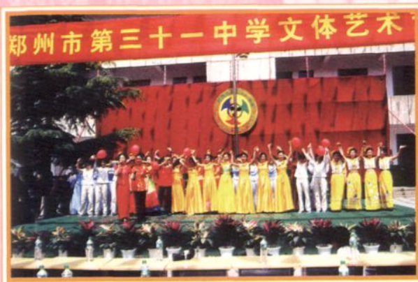
校第一届文体艺术节