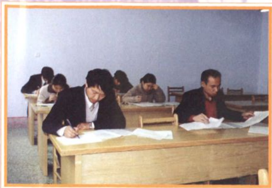
青年教师参加高三质量预测