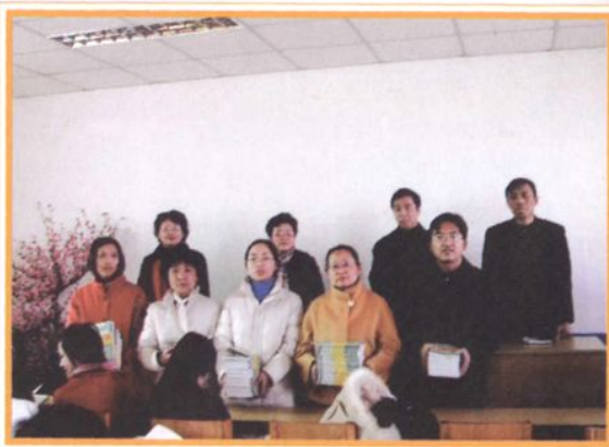
向教职工赠送《自动自发》一书