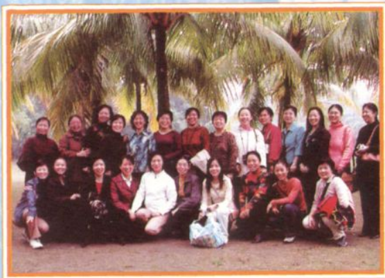
部分教职工到海南旅游