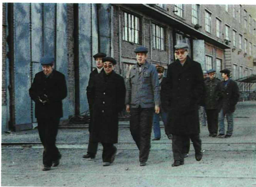
中国铁路总工会主席冯祖椿来公司视察(1989年12月)