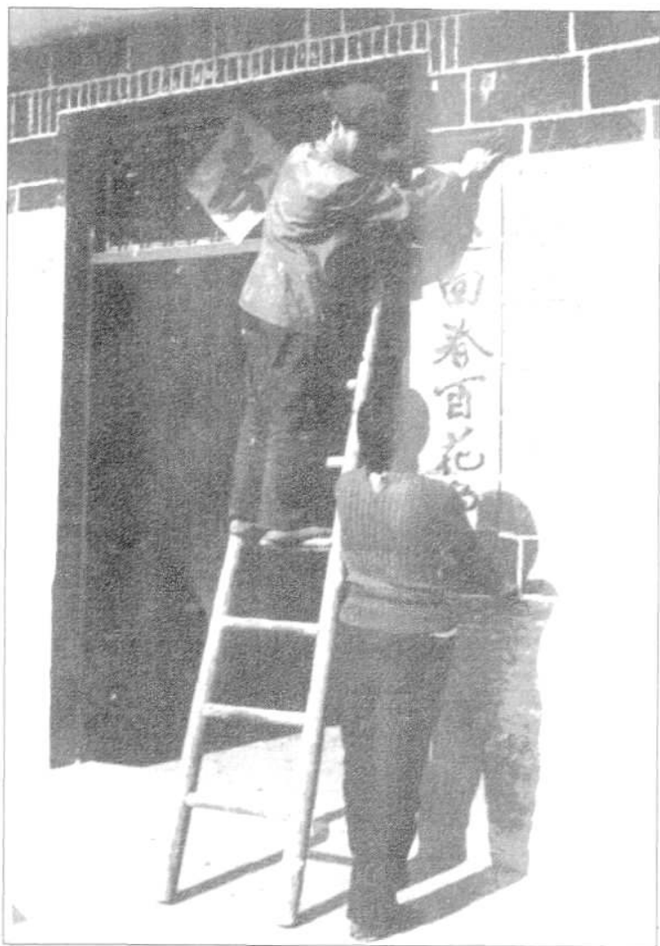
贴 春 联