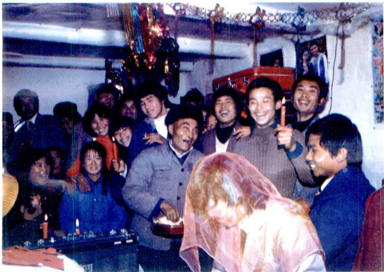
新 婚 撒 帳