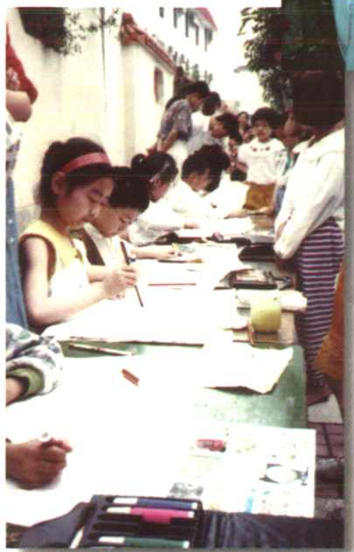
百名少儿书法现场比赛