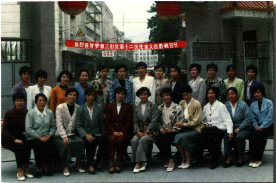
罗源县妇联十二届执行委员会全体委员