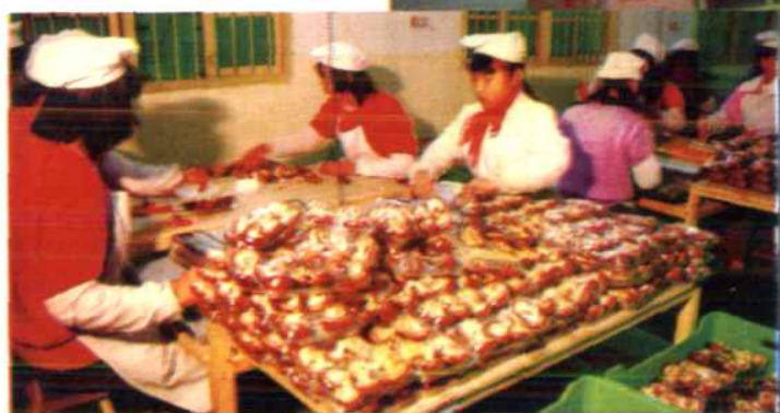
妇女参加保鲜香菇加工