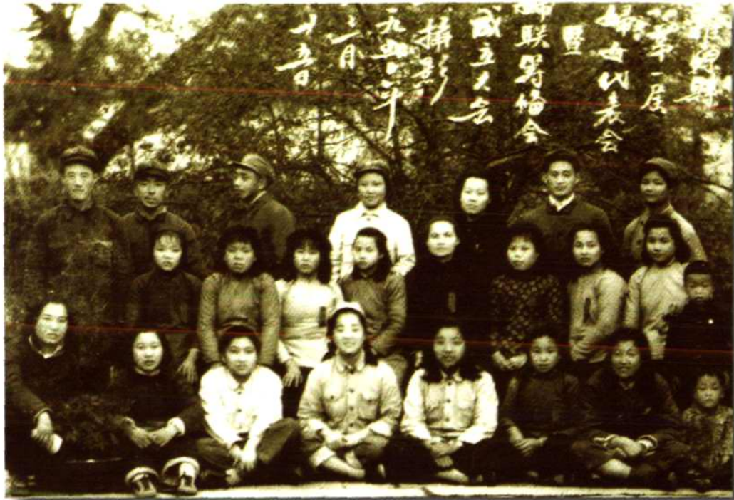
罗源县第一届妇女代表会暨县妇联筹备会 成立大会代表与筹备会成员