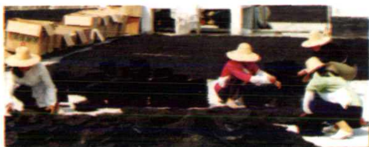
参加海带、紫菜 生产、加工