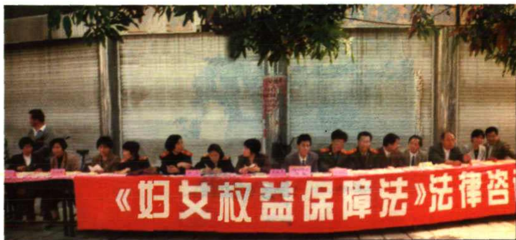
县妇联与有关部门联合开展《妇女权益保障法》宣传咨询活动