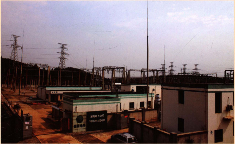
2008年12月竣工投入使用的220千伏下东变电站