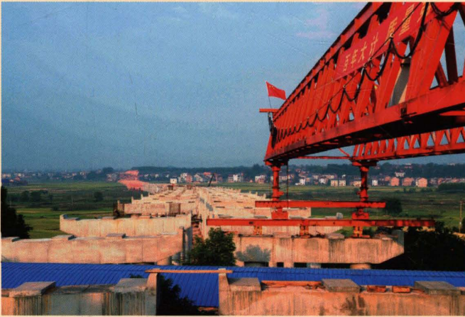
2010 年底，在建的耒茶 高速公路陈家湾大桥