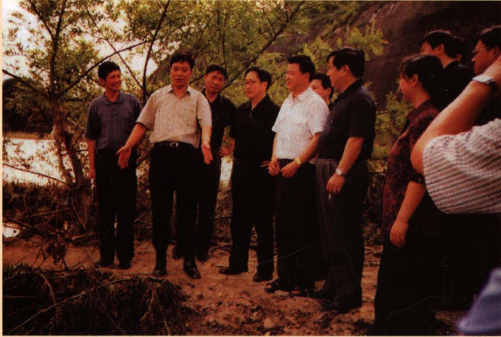
2002年6月，湖南省省长张云川（左二）现场察看茶陵“6·16”洪灾情况

2003年1月，中共中央委员、广西壮族自治区党委书记、区人大常委会主任曹伯纯（前排右二）到茶陵考察工作。图为曹伯纯书记参观毛泽东主席在茶陵住室后题词