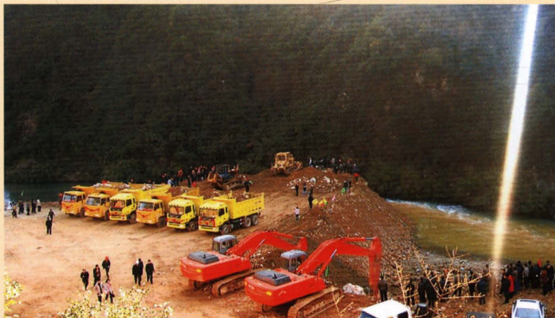
2006年12月18日，洮水水库截流