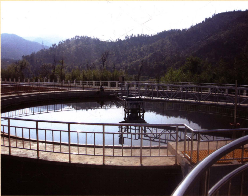
2009年11月竣工投入使用的县城污水处理厂