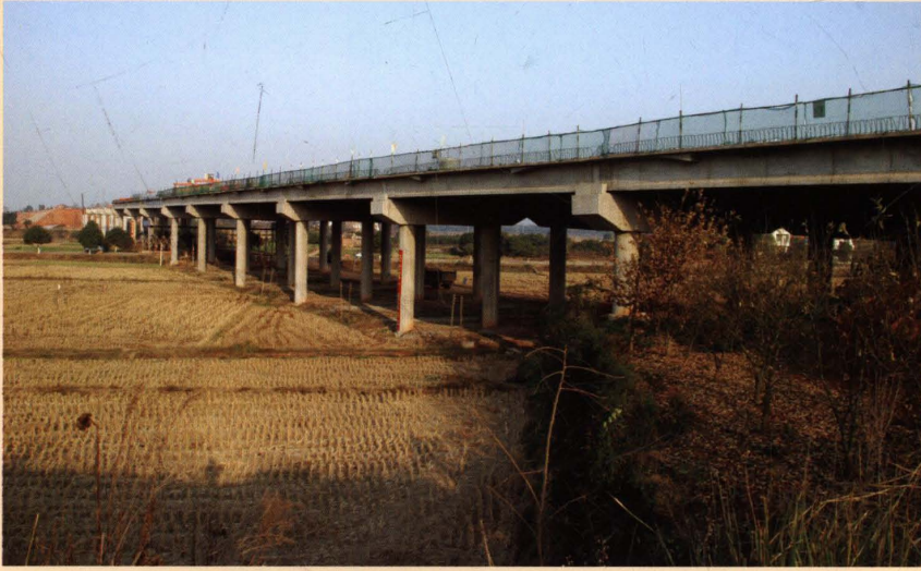
2010 年底，建设中的醴茶高速公路虎踞高架桥