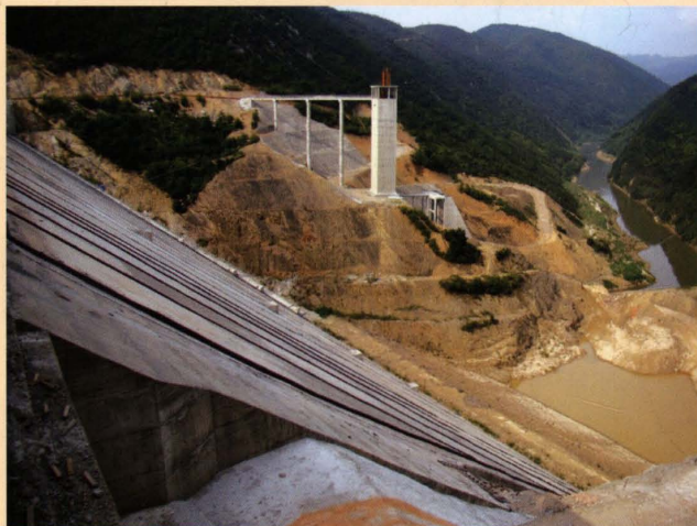
2010年，下闸蓄水前的洮水水库