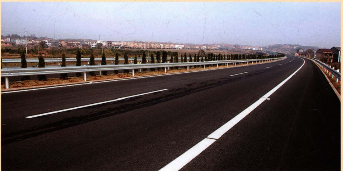
2009年12月，衡炎高速公路茶陵段建成通车