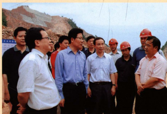
2007年6月，湖南省委书记张春贤（前排左二）视察洮水水库工程建设