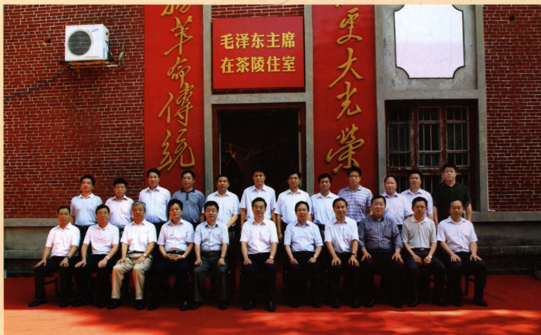
2011年6月，湖南省委书记周强（前排左六）参观毛泽东主席在茶陵住室