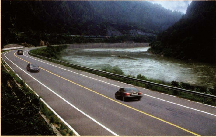
2003年10月，拓宽改造后的106国道仙人湾段