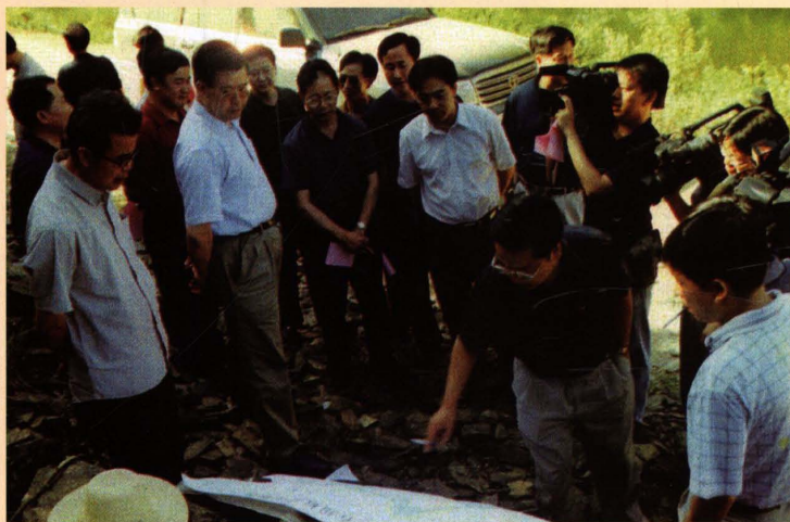
2003年7月，湖南省政协主席胡彪（前排左二）考察洮水水库工程建设