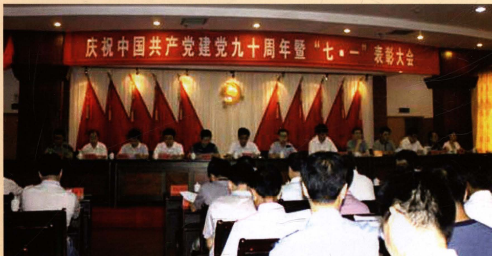
2011年7月1日，庆祝中国共产党建党九十周年暨“七·一”表彰大会