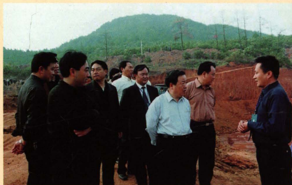
2004年11月24日，湖南省委副书记、省长周伯华（右三）视察茶陵农田水利建设