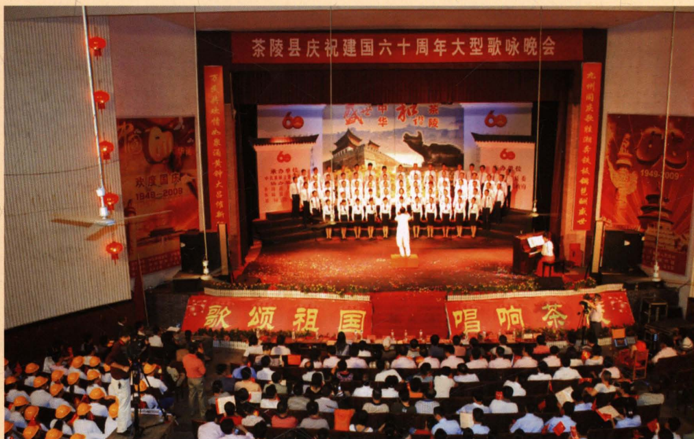
2009年10月1日，庆祝建国60周年大型歌咏晚会