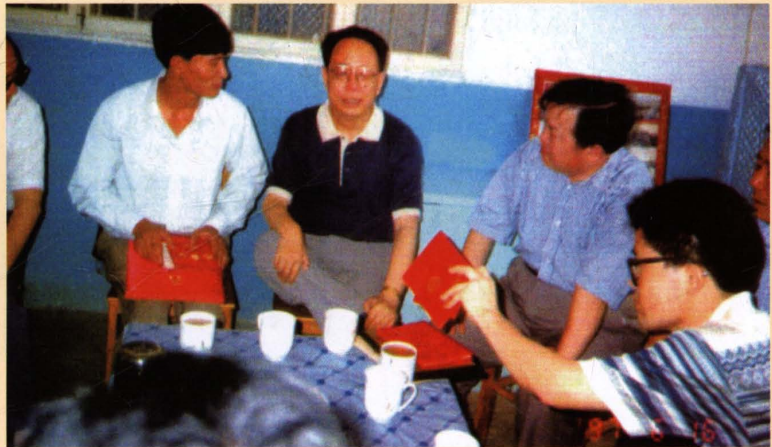
1997年6月，湖南省省长杨正午（中）视察茶陵