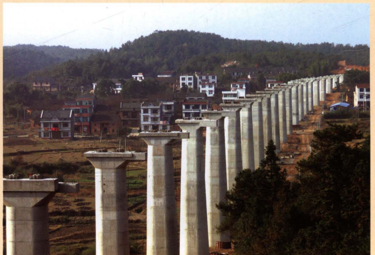
2010 年，在建的衡茶吉 铁路茶陵段麻塘特大桥