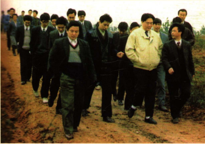
1995年3月，湖南省委书记王茂林（前排右二）视察虎踞名特水果生产基地