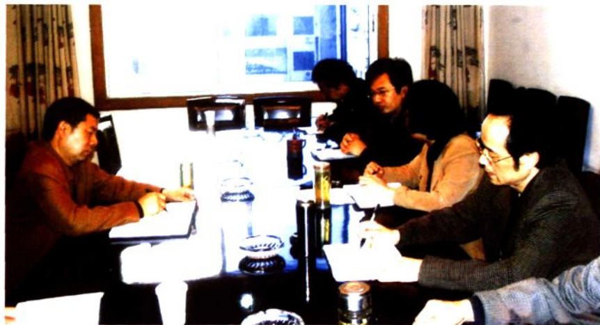
◀ 市委常委、常务副市长夏代荣（左）专题研究人事编制工作