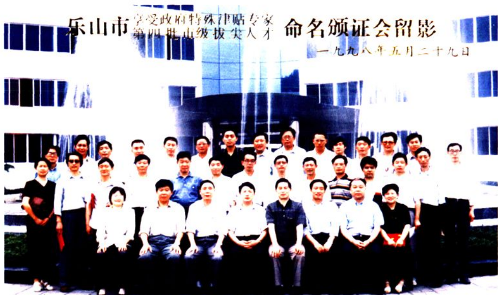
▲参加命名颁证会的部分优秀专家