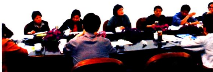
▶部署事业单位人事制度改革