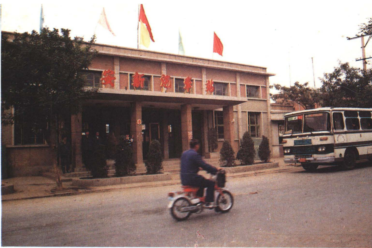
座落在华北明珠——白洋淀岸边的部级文明车站之一——国营安新汽车站外貌（1989年）