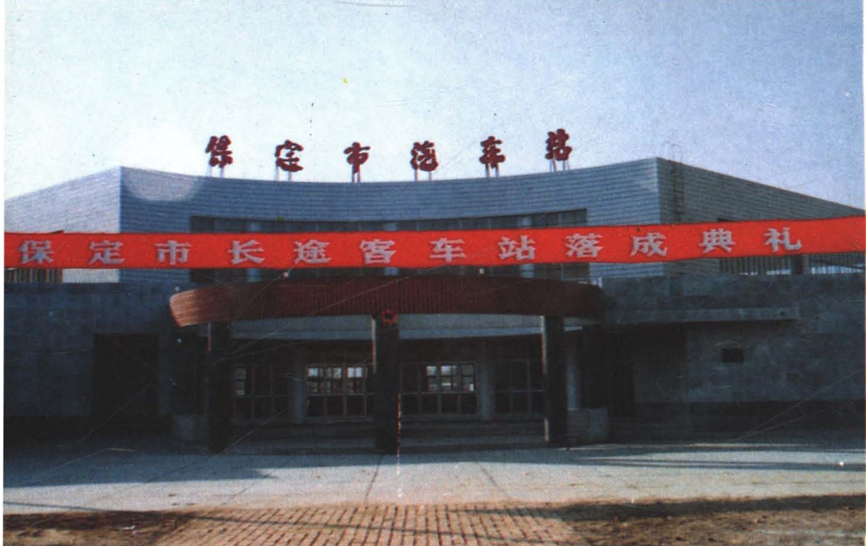
河北省第一座市级公用型客车站——保定市汽车站外貌（1990年）