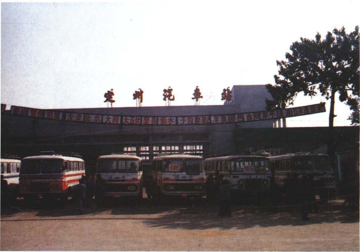
1988年扩建的国营定州汽车站外貌