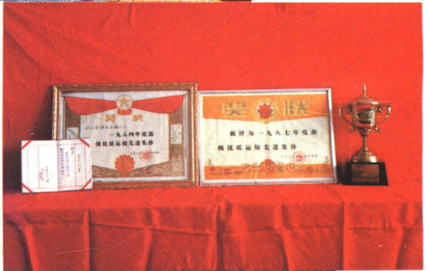
保定运输总公司自1984年~1989年,曾四次荣获部级优质运输先进集体称号,图为部分奖状和奖杯