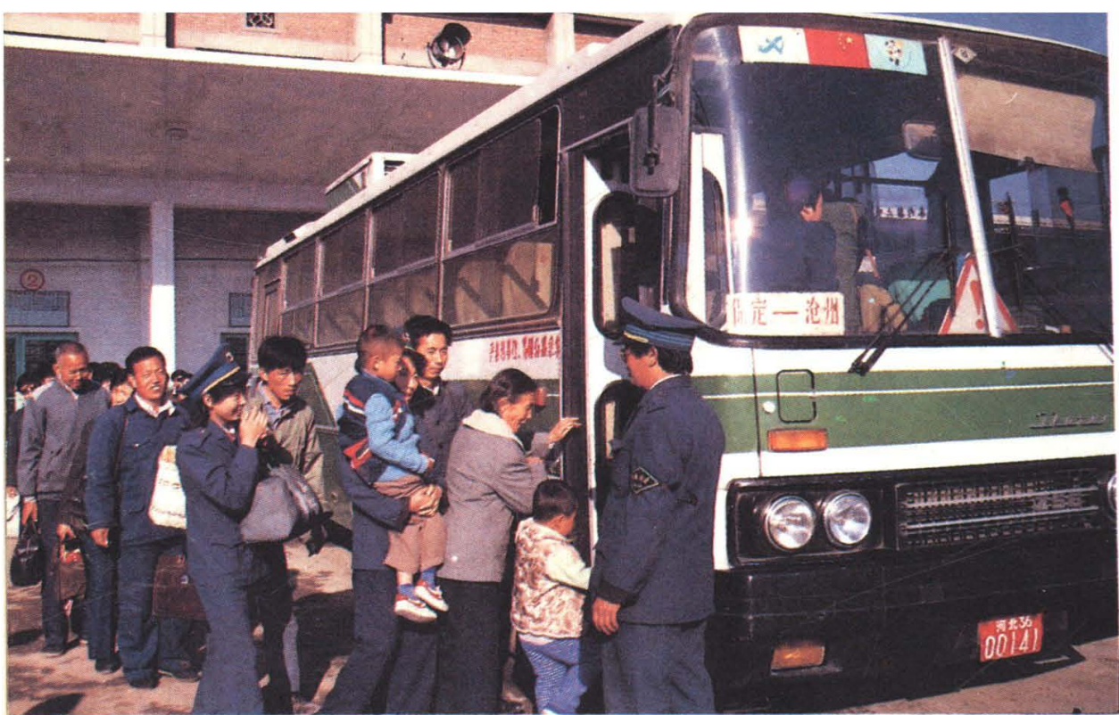
保定地区国营公路运输职工文明热情为旅客服务（1989年）

保定运输总公司积极开展零担运输业务，与全国10个省市共开辟了39条运输线路，图为奔驰在保定城乡的零担班车（1989年）