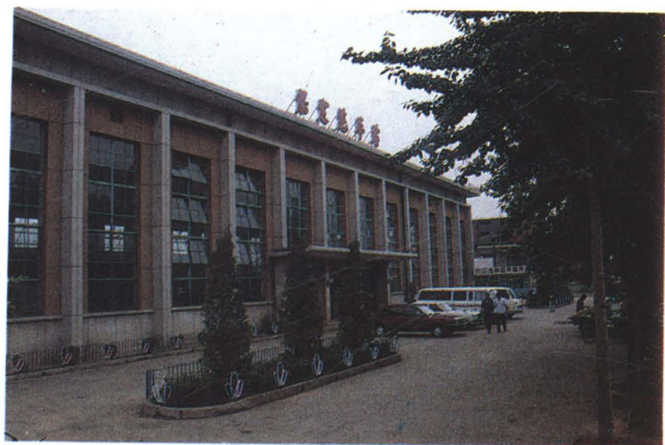
保定地区“全国文明车站”之一——国营保 定汽车站南站外貌（1989年）