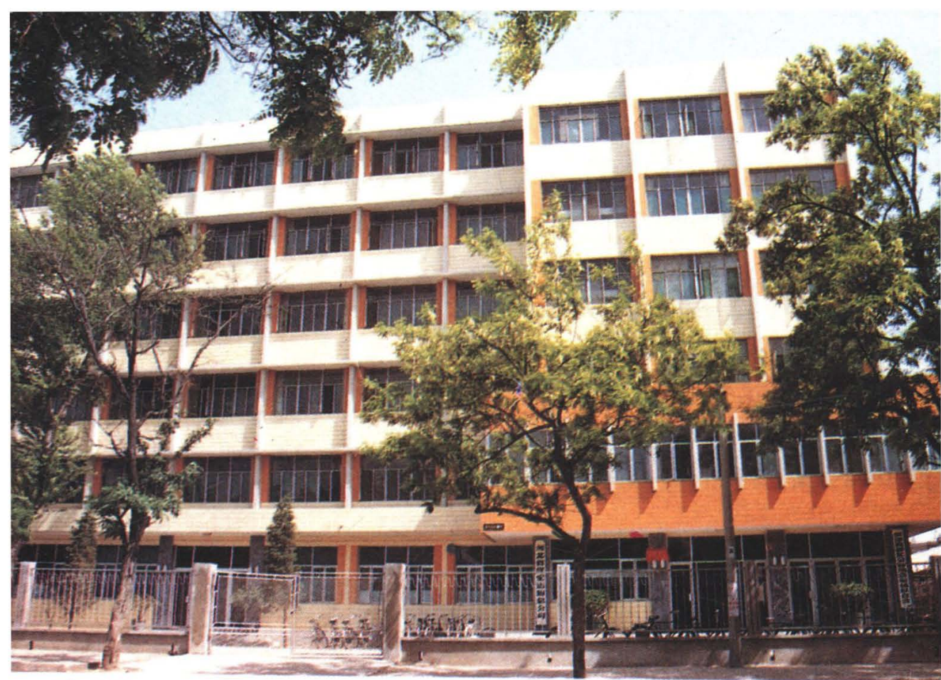
保定地区国营公路运输企业——保定运输 总公司的机关办公大楼（1989年）