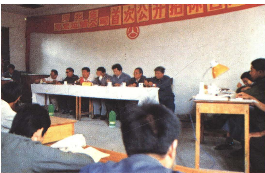
保定运输总公司大胆革新,勇于创新,对中层干部实行公开招标,图为招标答辩会(1987年)