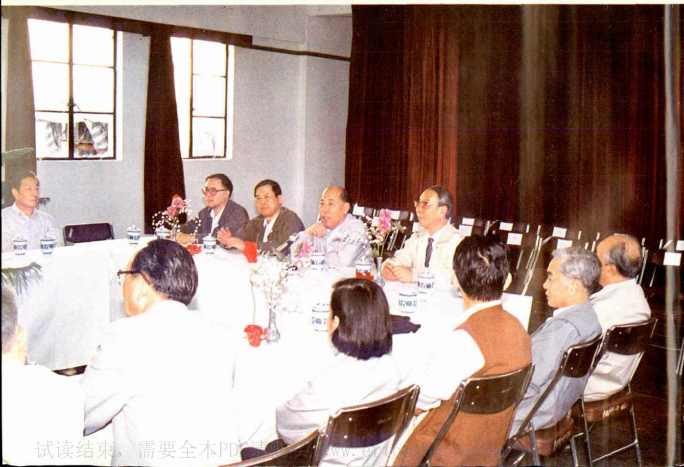
●1990年10月财政部部长王丙乾(右二)向市财税局干部讲话