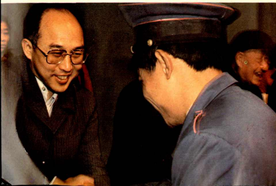
●1987年4月财政部副部长项怀诚 接见财税专管员