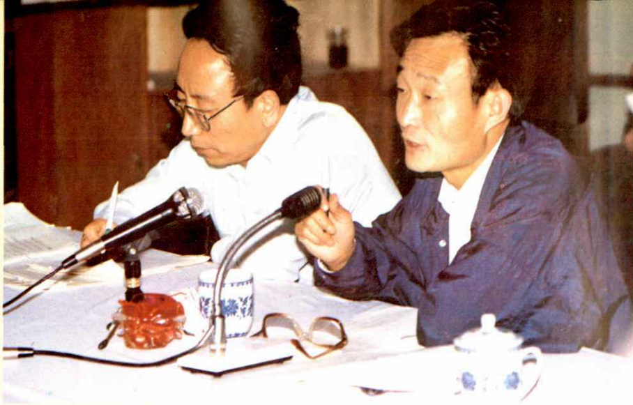
●1991年5月中共上海市委书记吴邦国(右)在市财政局、税务局作调查研究