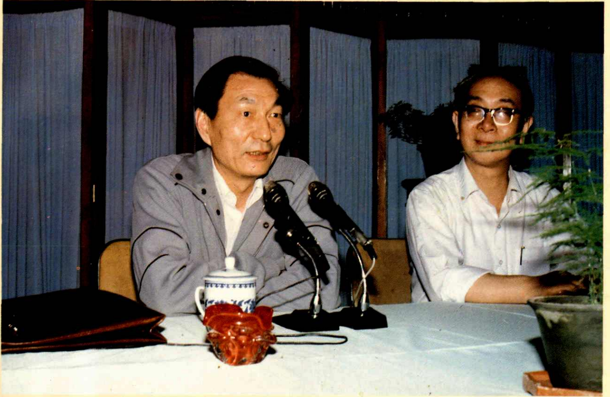
●1988年5月19日上海市市长朱镕基在上海财税系统干部座谈会上讲话