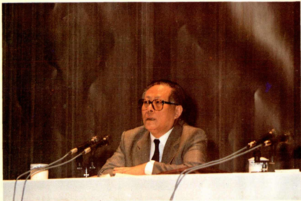
●1988年10月19日中共上海市委书记江泽民在上海市1988年税收、财务、物价、信贷大检查动员大会上作重要讲话