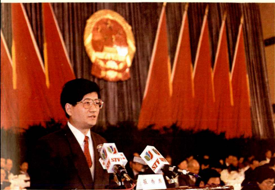
●1994 年 2 月上海市副市长孟建柱在市人大十届二次会议上作上海市 1993 年预算执行情况和 1994 年预算(草案)的报告