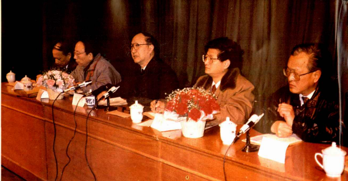
●副市长徐匡迪(左三)出席 1993 年市财税工作会议并讲话