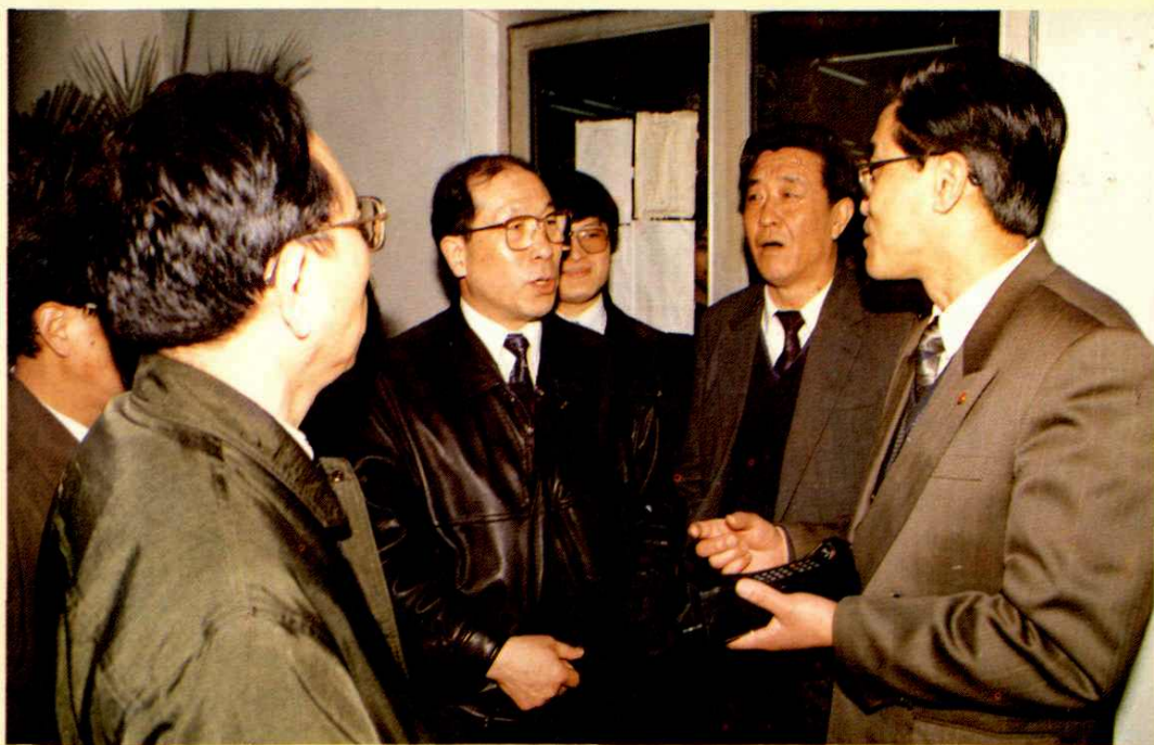
●1993年2月财政部部长刘仲藜(中)视察上海财政证券公司