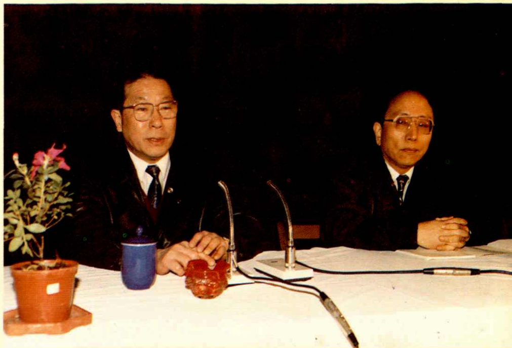
●1993年2月财政部部长刘仲藜(左一)在上海视察工作时向市财税局干部讲话