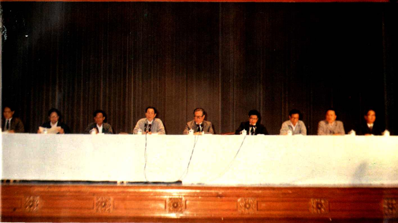
●1988年10月19日中共上海市委书记江泽民(右五)、上海市市长朱镕基(左四)在大会主席台上