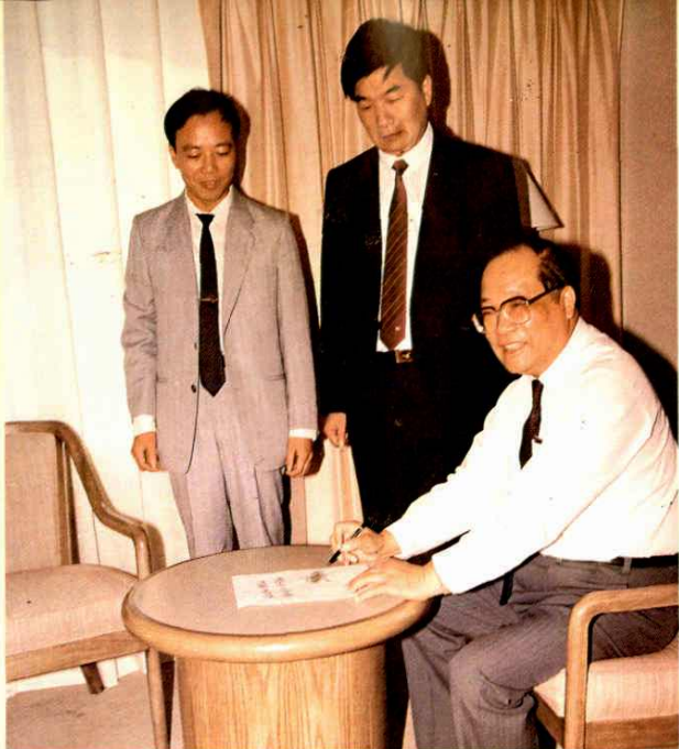
●1991年10月国家税务总局局长金鑫(右一)为《上海财税》题词