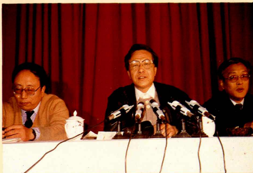
● 财政部副部长张佑才(中)在 1991 年上海市财政工作会议上讲话