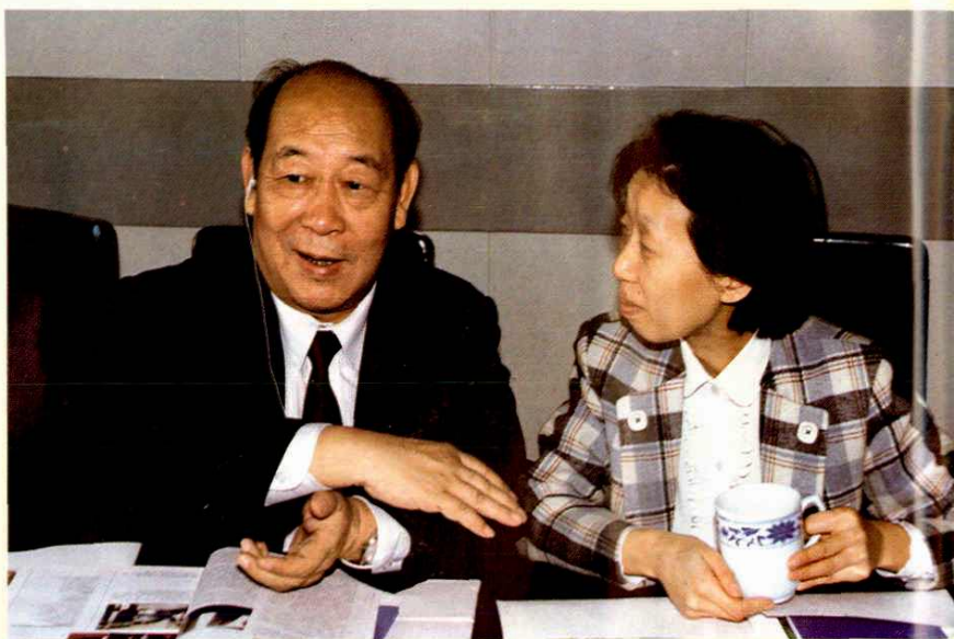
●财政部副部长田一农(左一)在市财税局视察工作