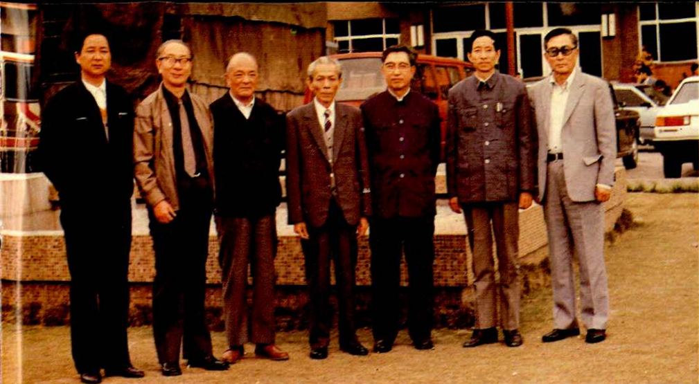
● 财政部副部长陈如龙(左四)与上海财税局领导合影