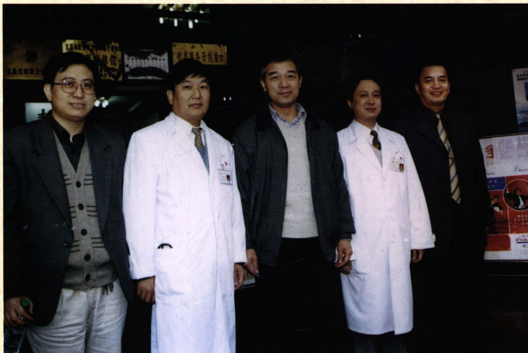
2000年10月，卫生部副部长王陇德（中）在宜昌市卫生局党组书记吴诗权（右一）、副局长何克春（左一）陪同下来院视察工作