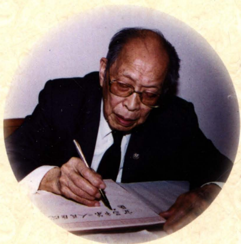
中国科学院院士、著名医学家 裘法祖