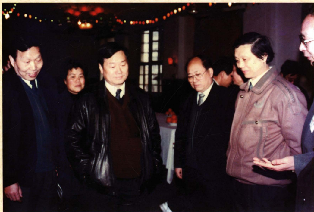
1993年2月，卫生部副部长孙隆椿（左三）在湖北省卫生厅厅长李清泉（右三）、宜昌市副市长符利民（右二）陪同下视察医院工作