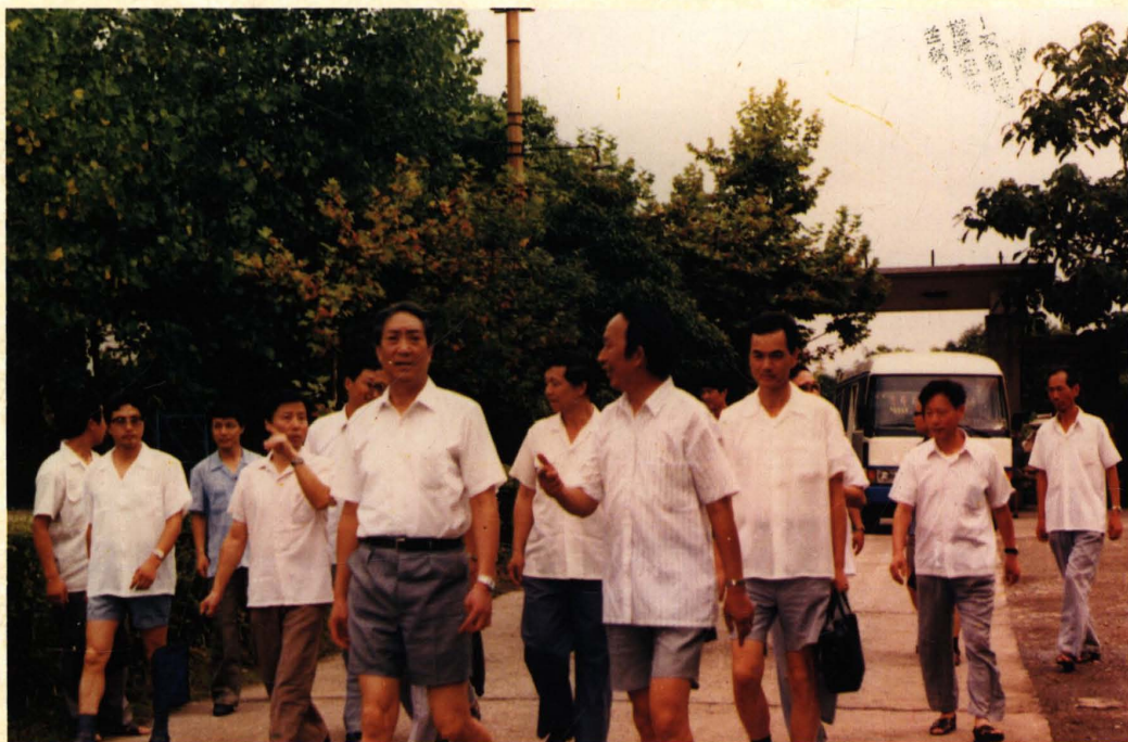
1986年6月，湖北省副省长韩南鹏（前排左一）来医院视察工作