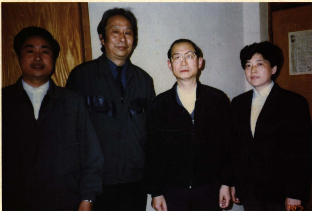
1992年4月15日，卫生部部长陈敏章（左三）与医院领导合影