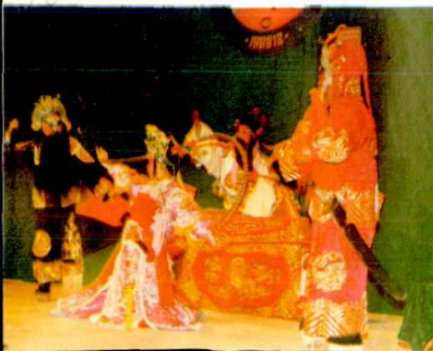
△庵埠汉剧团演出《辕门斩子》