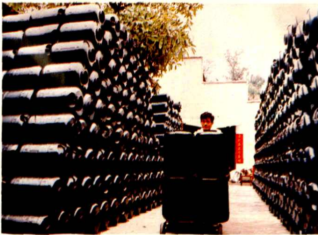
△庵埠镇塑料工艺厂生产蘑菇桶