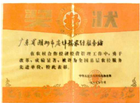
▽土专家李绍辉培育 水稻良种，亩产达 1365 公斤