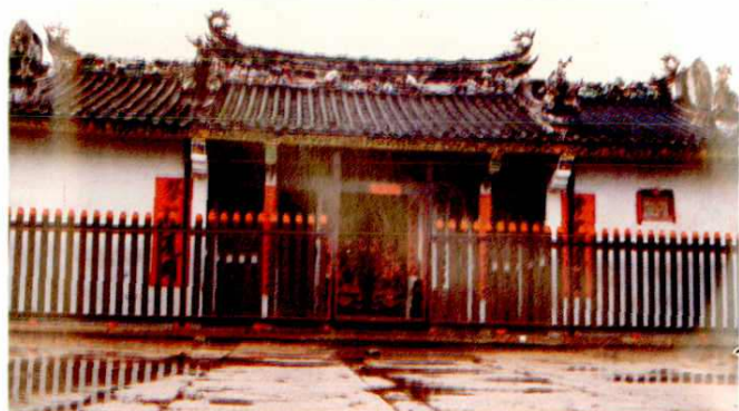
△潮州市文物保护单位——洪氏家庙、王氏大宗祠