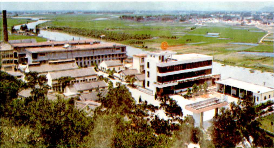
◁潮州市第二电气植绒布厂