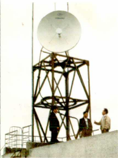
△庵埠邮电支局微波接收天线