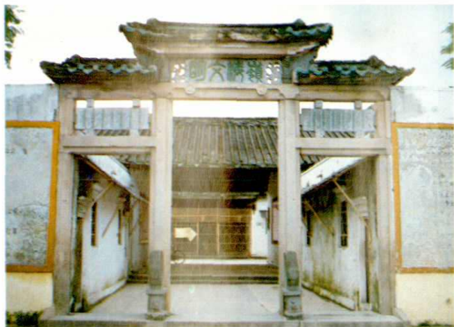
△潮州市文物保护单位—文祠