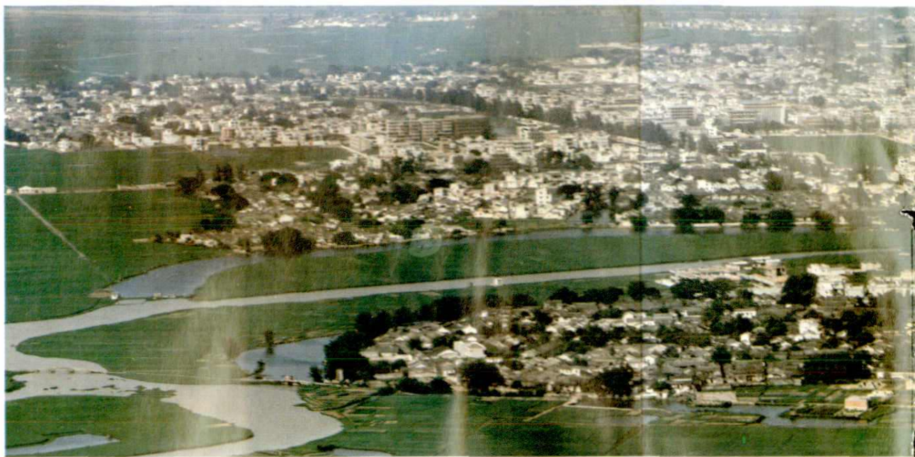
▽潮州市文物保护单位—海蚀遗址一角