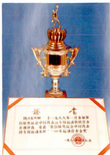
▷乡镇企业名优产品及奖杯奖状