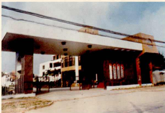
镇政府办公大楼▷ (上大门、右主楼)