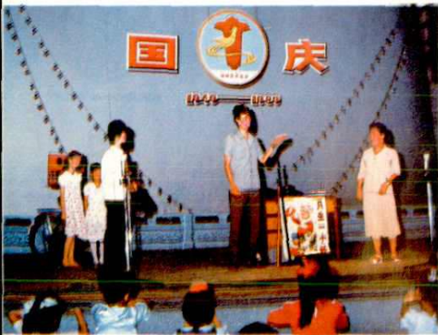
▷《〈虚拟大奖赛〉》 庵埠话剧队演出