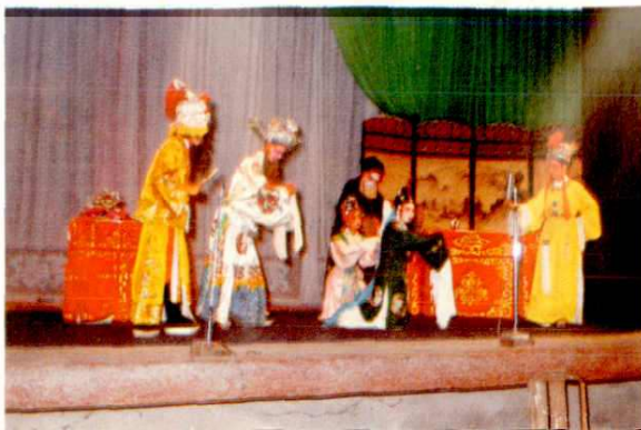
▷《房夫人吃醋》 庵埠潮剧团演出