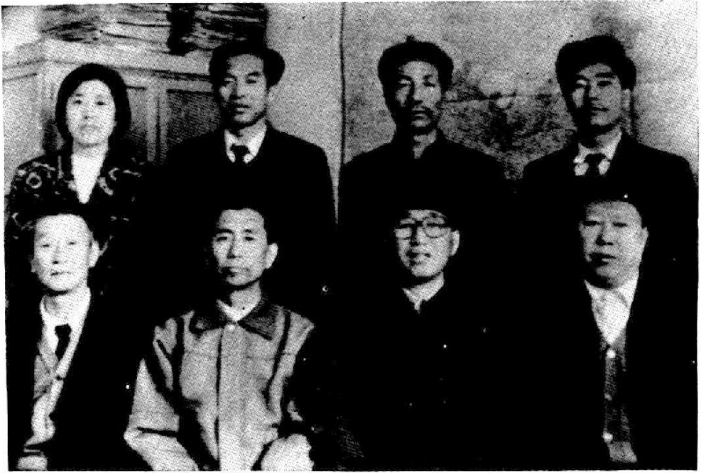
编 撰 人 员 合 影