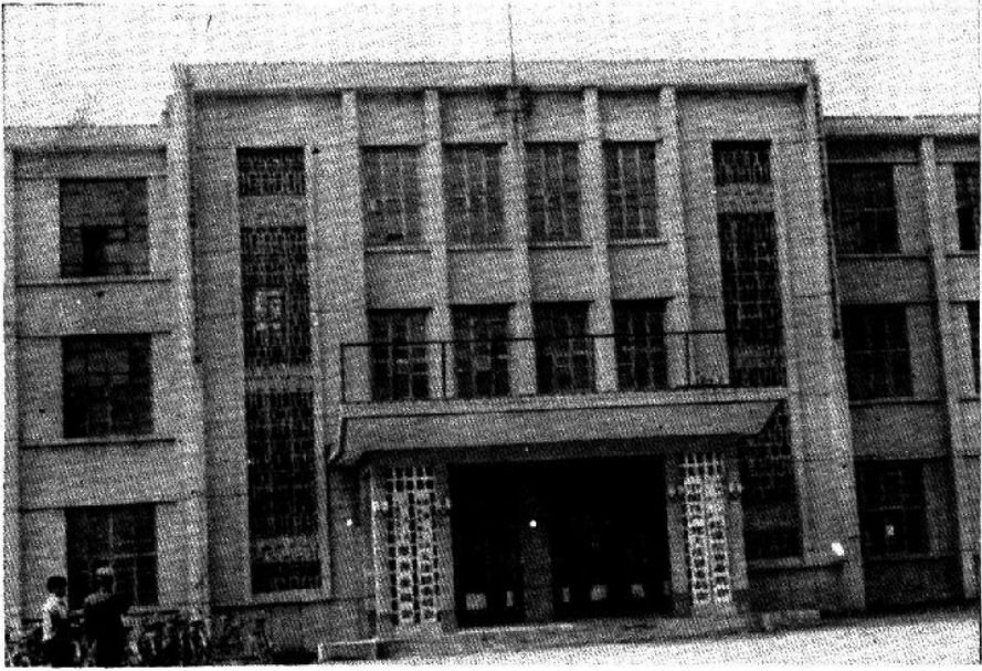
县委、县政协办公楼