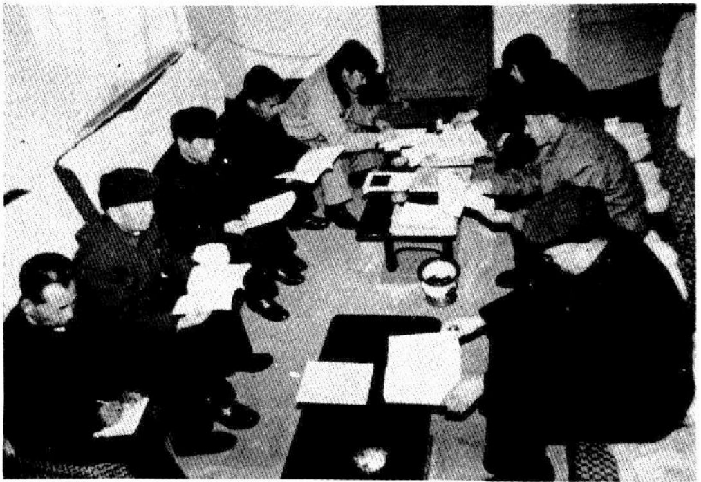
集体审阅《大洼县政协志》初稿