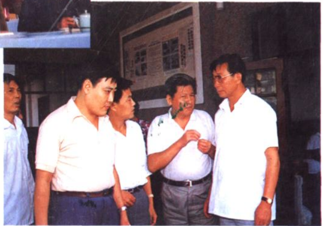
上海市原副市长倪鸿福(右二)出席桃浦副食品综合商场开张典礼