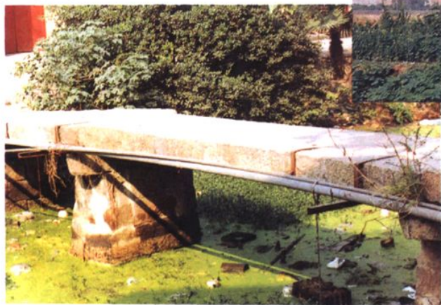
洛阳古桥(即绿杨桥), 桥下即李家浜 (清乾 隆戊子年即1769年建)