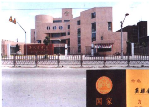
英雄金笔厂及其 国家一级企业证书