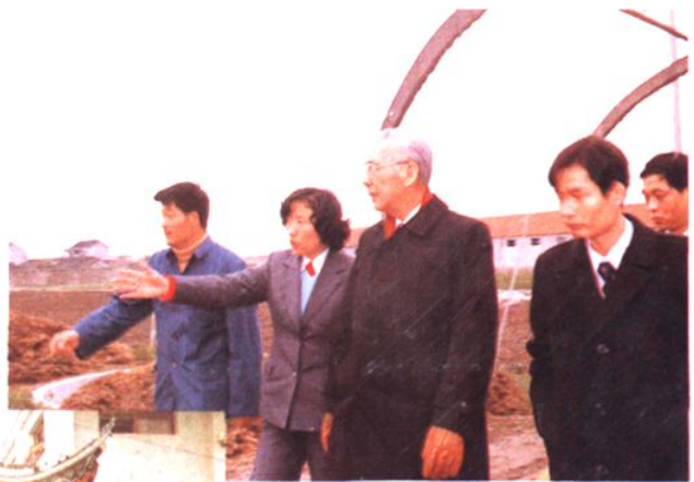
泰国王国副总理披猜·达拉军(中)及其夫人一行来乡参观