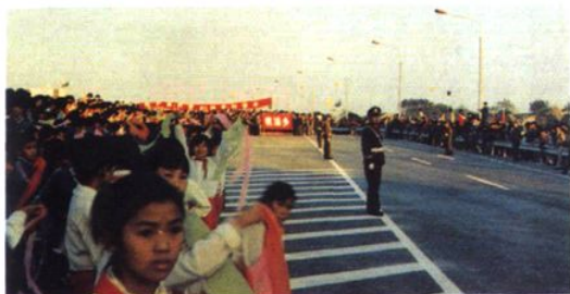
1988年10月31日，沪嘉高速公路通车典礼