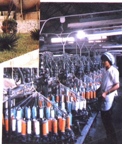
上海宽紧带厂桃浦联营厂织带车间