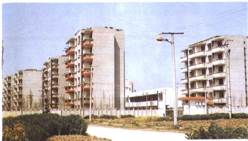
桃浦工业区总体规划一期工程——桃浦三村