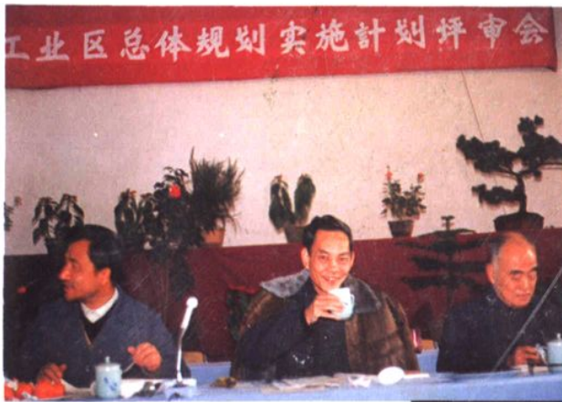
上海市原副市长倪天增(中)主持桃浦工业区总体规划实施计划评审会