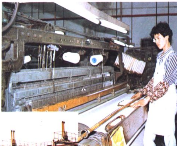
上海第一毛纺厂桃浦联营厂织造车间