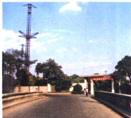
上海国际无线电台真如发讯台