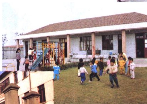
桃浦乡祁连幼儿园