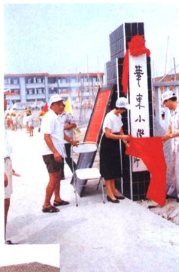
华东小学（前身为华东农业技术学校）校牌揭幕