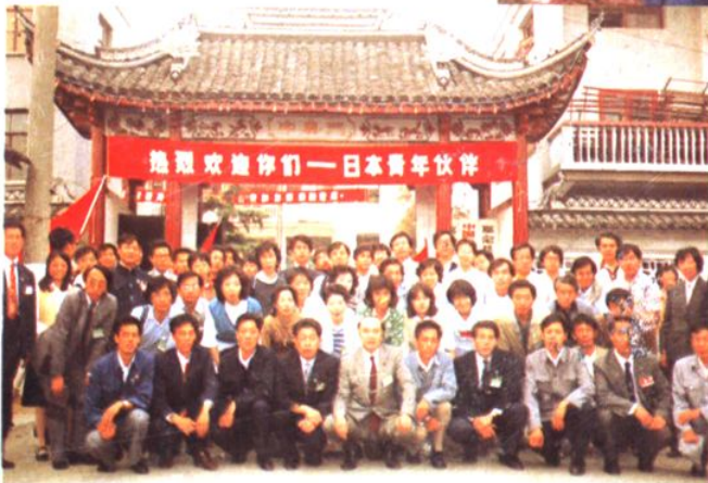
1984年9月,日本青年访华团来乡参观访问