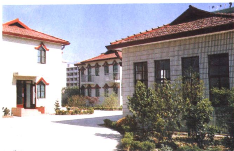
1993年10月23日桃浦敬老院新址落成