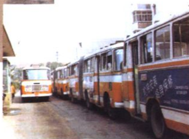
公交汽车62路绿杨桥起点站