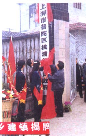
1994年3月18日 桃浦镇人民政府揭牌