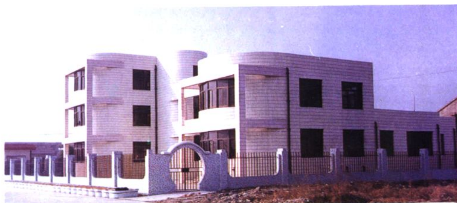
桃浦一号仓库外景