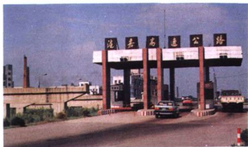
沪嘉高速公路祁连山路入口处