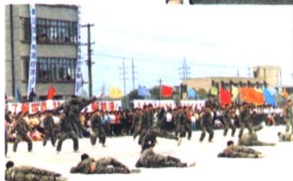
农民运动会上武警指战员技术表演