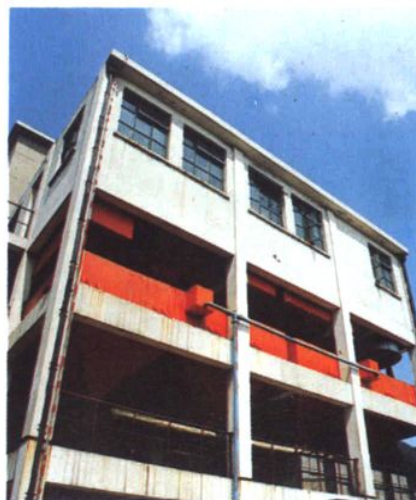
上海玻璃化工厂含铅废水治理设施