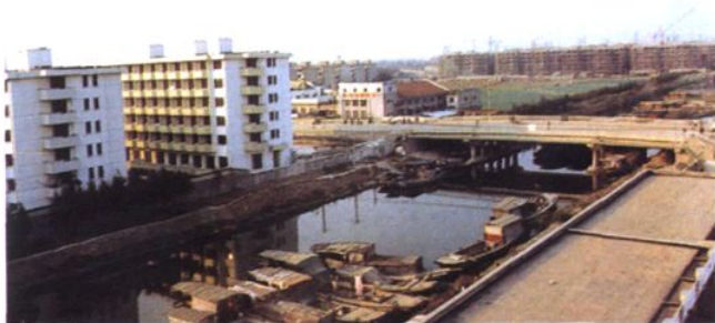
新槎浦河武威路桥及水运码头