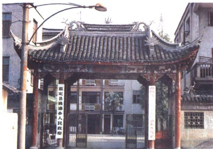
1992年前桃浦乡人民政府原址(绿杨桥)