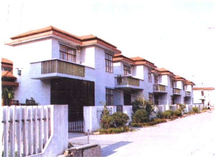
桃浦乡农民别墅型住宅——李子园二村