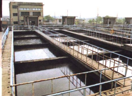
上海第二制药厂生化池