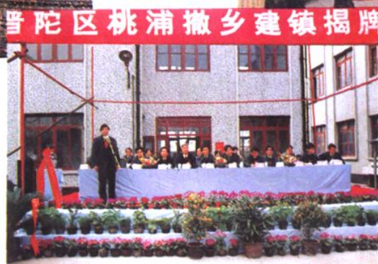
1994年3月18日 桃浦乡撤乡建镇揭牌仪式