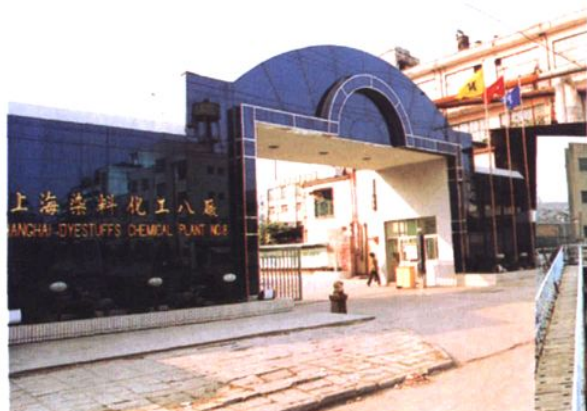
上海染料化工八厂