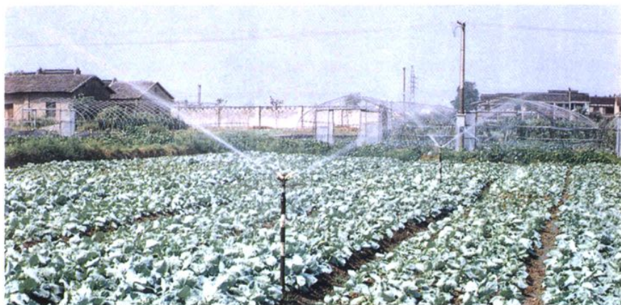
桃浦乡金光村十队大田喷灌