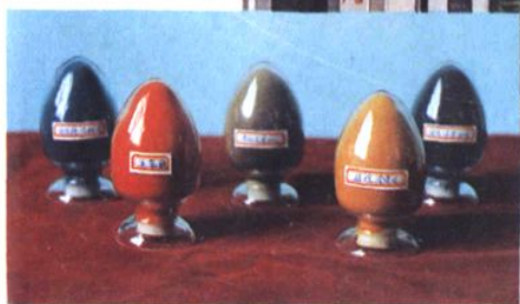
上海桃浦染料厂及其产品