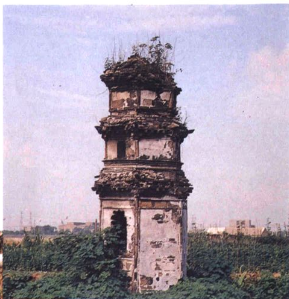
南宋建炎四年(1130年)韩世忠 建的白塔(也称韩塔)