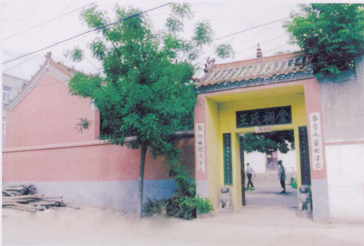
河沟王村王氏祠堂大院