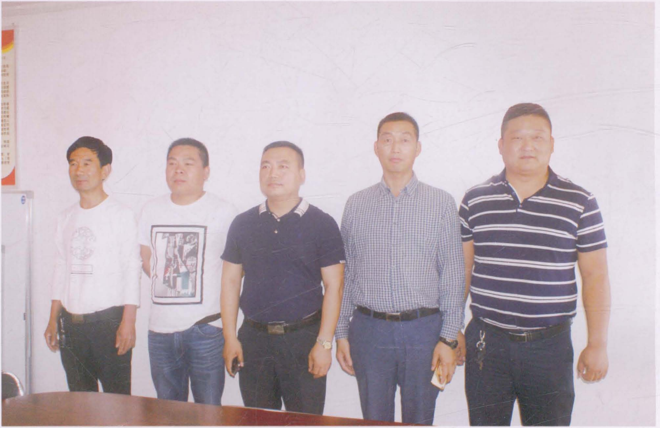
河沟王村党支部成员