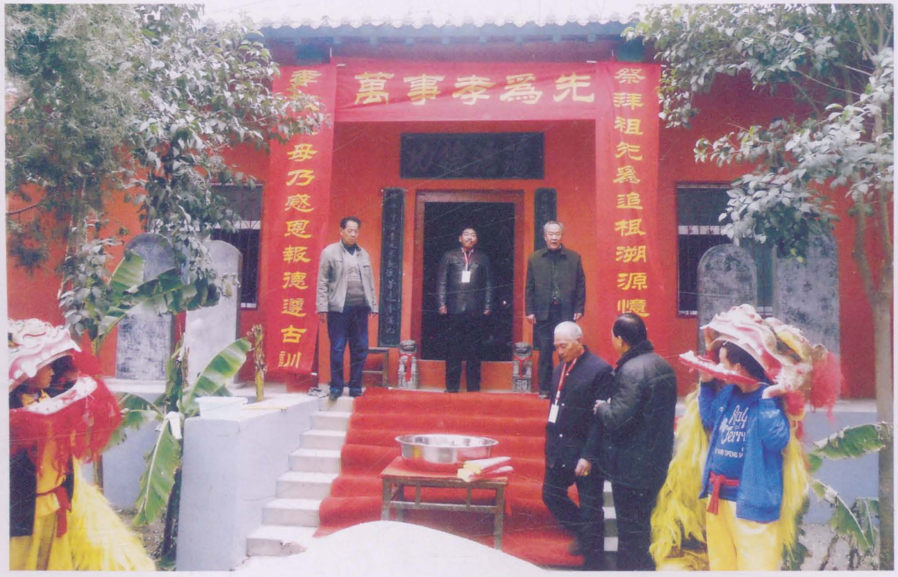
王氏家族祭祖活动