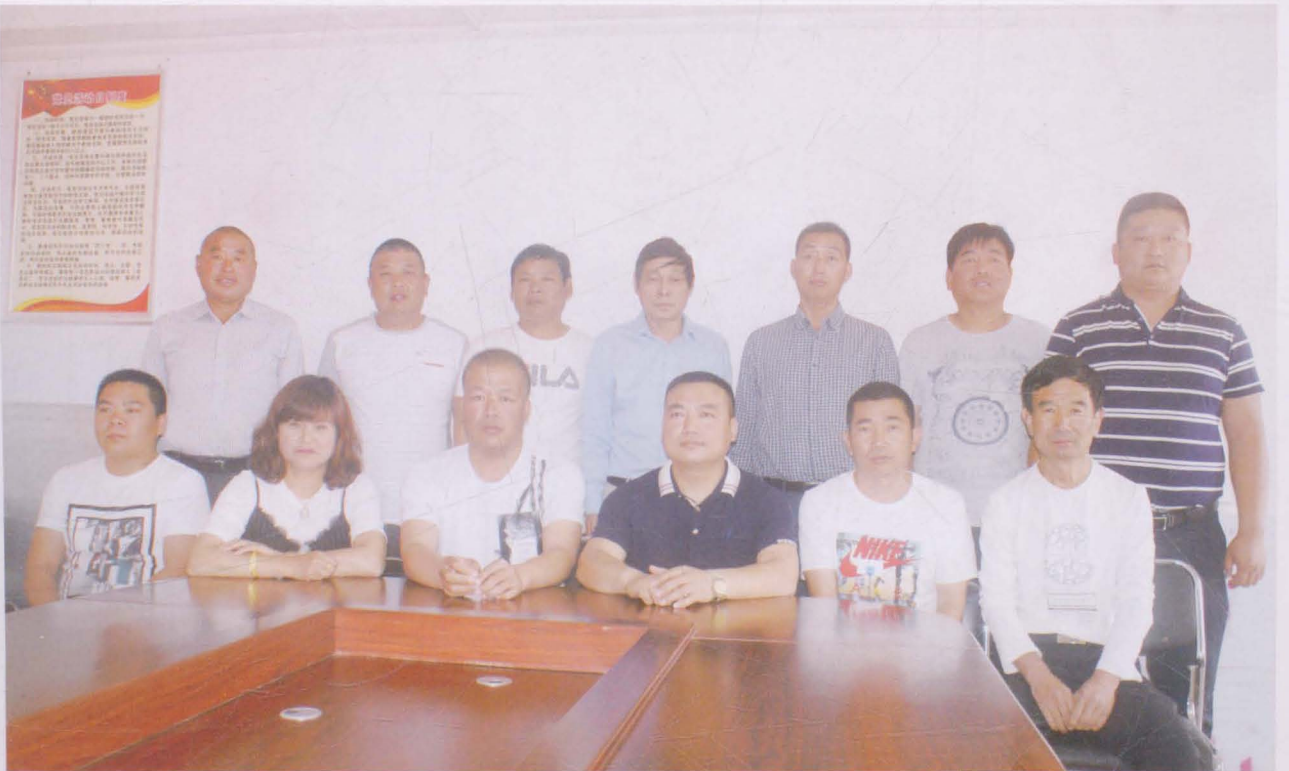
河沟王村支部委员会、村民委员会、监督委员会全体成员