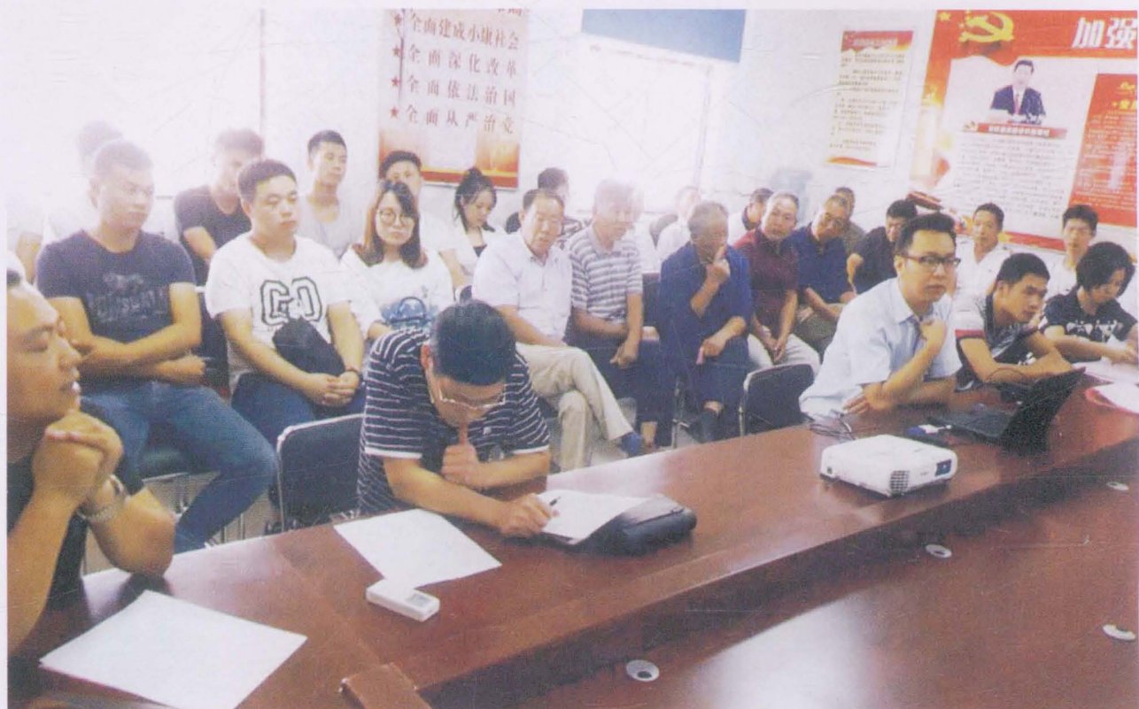
村全体党员表决公司改制