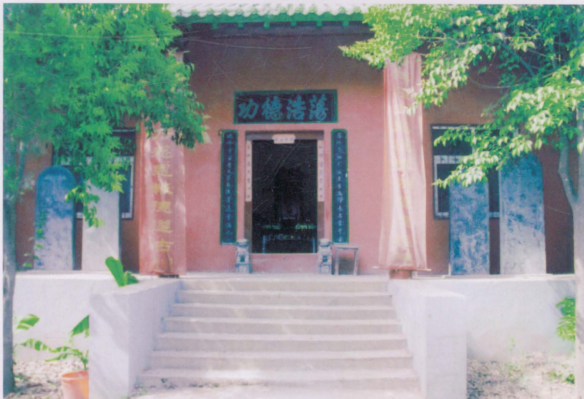
河沟王村王氏祠堂