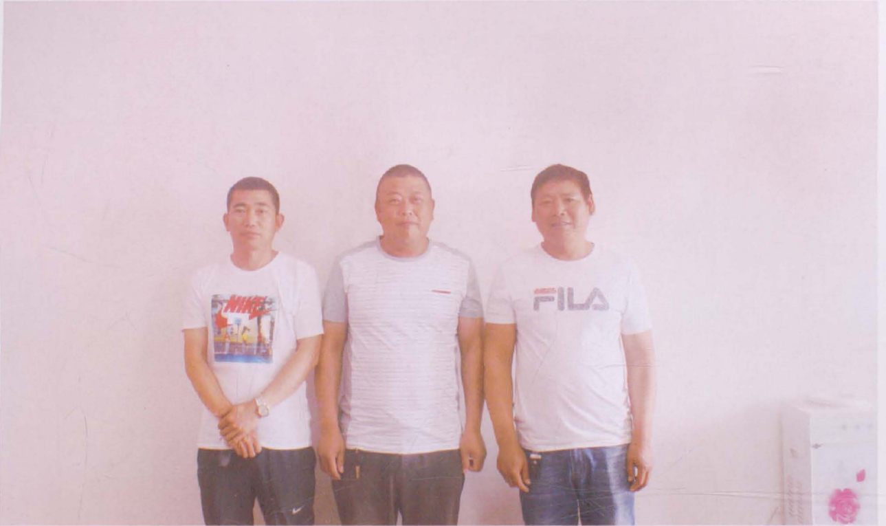
河沟王村监委会成员