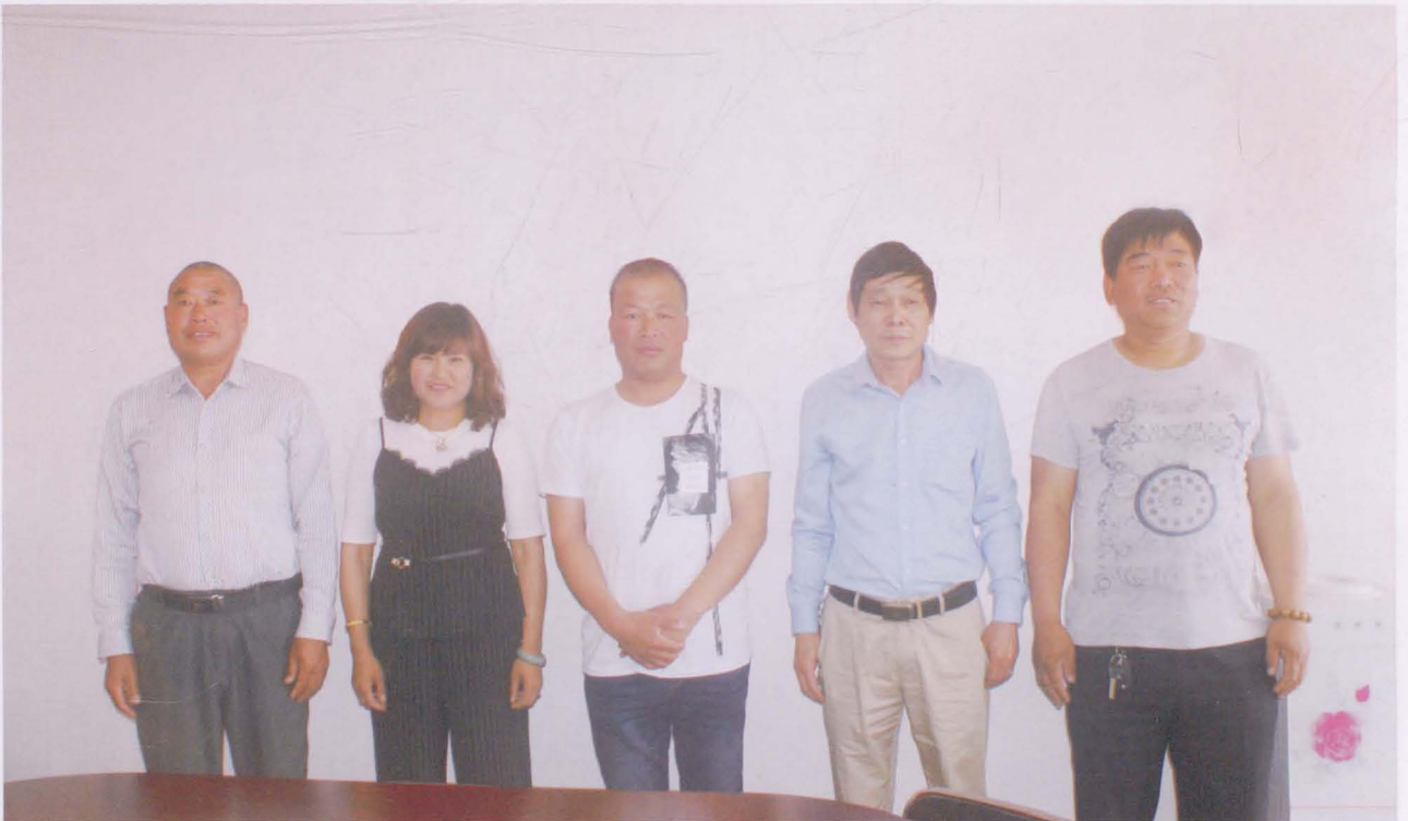
河沟王村村委会成员