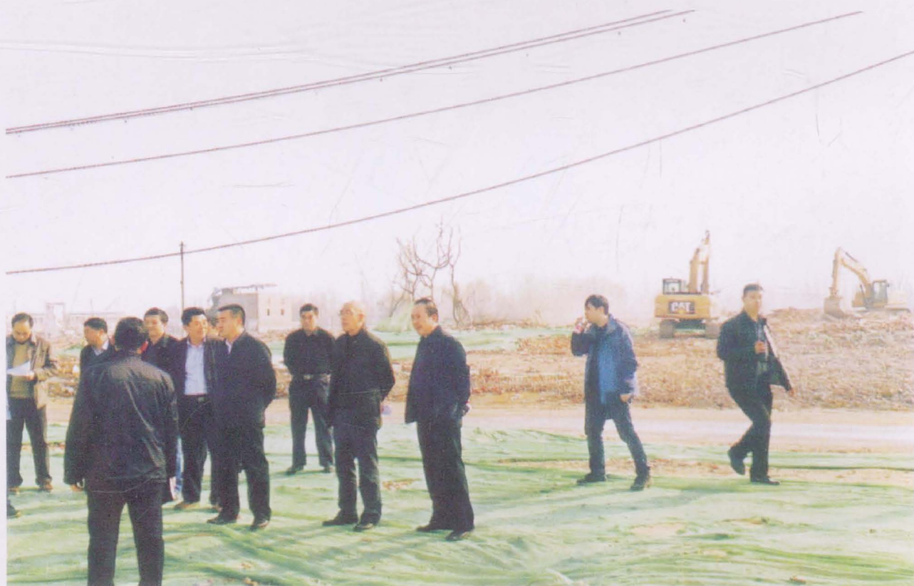
郑州市副市长杨福平来我村检查工作