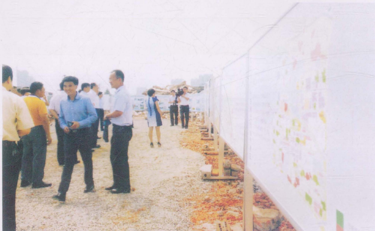
郑州市市长马懿到我村视察工作