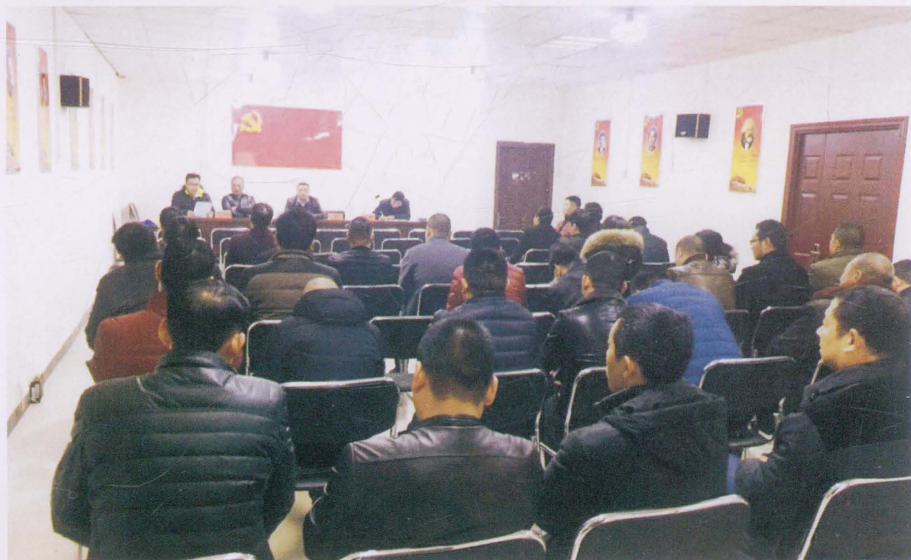
村代表表决公司改制