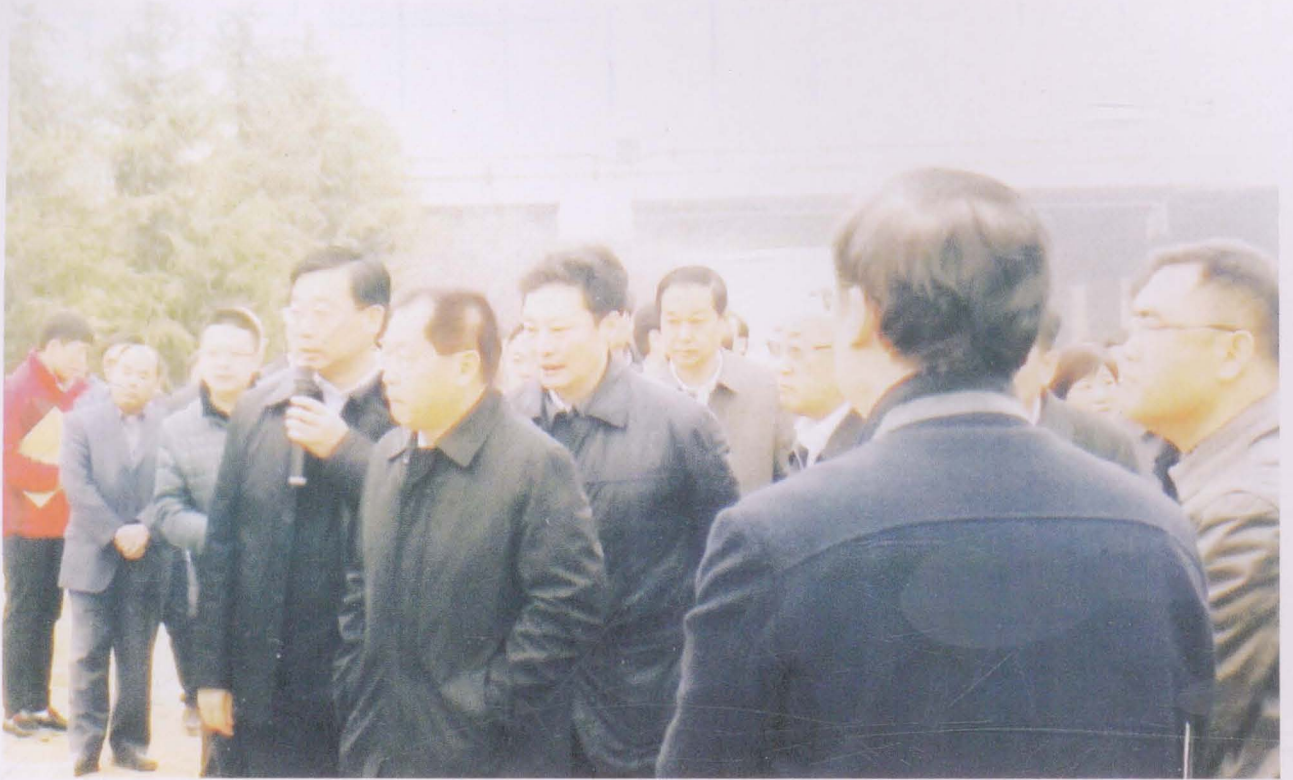
郑州市委主要领导到我村视察工作