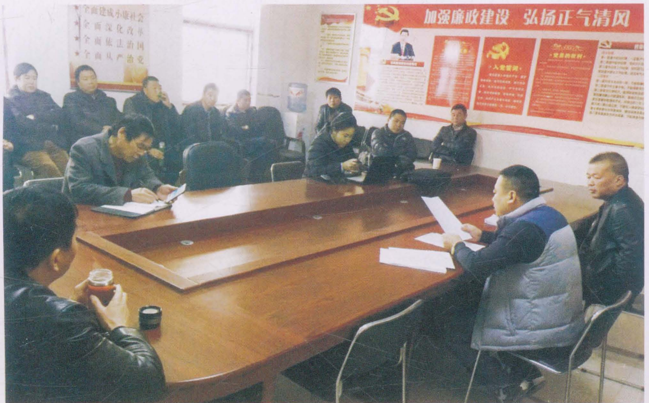
村三委会研究公司改制