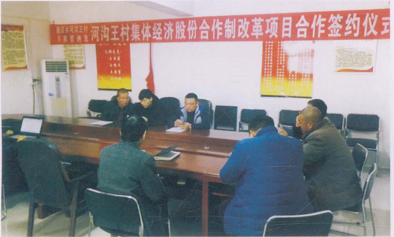
河沟王村集体经济股份合作制改革项目合作签约