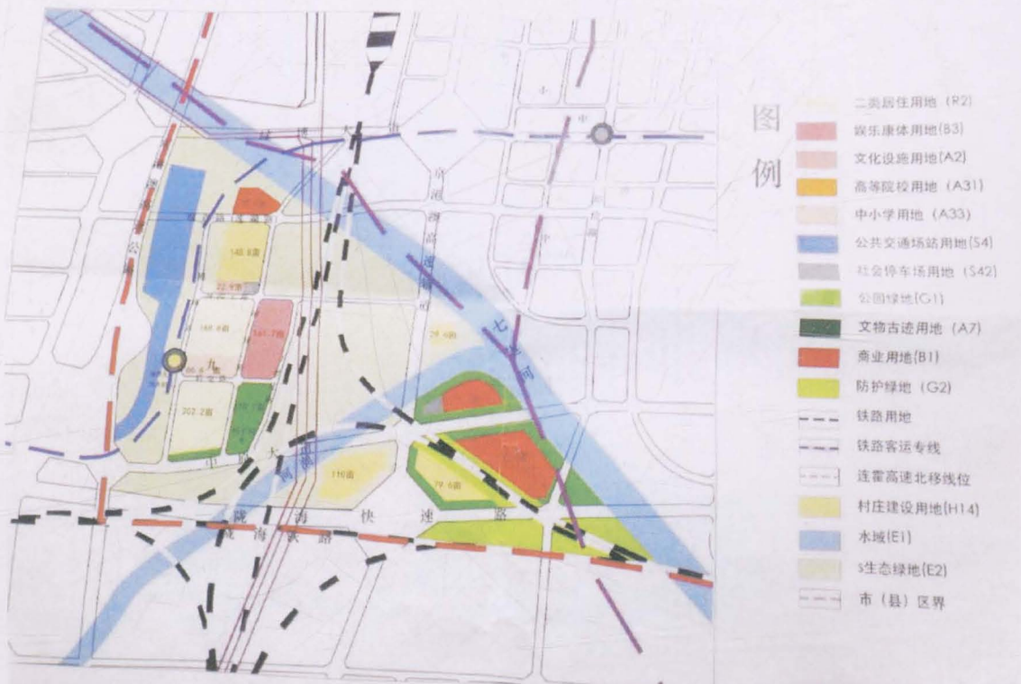
规划批准的河沟王村集体发展用地