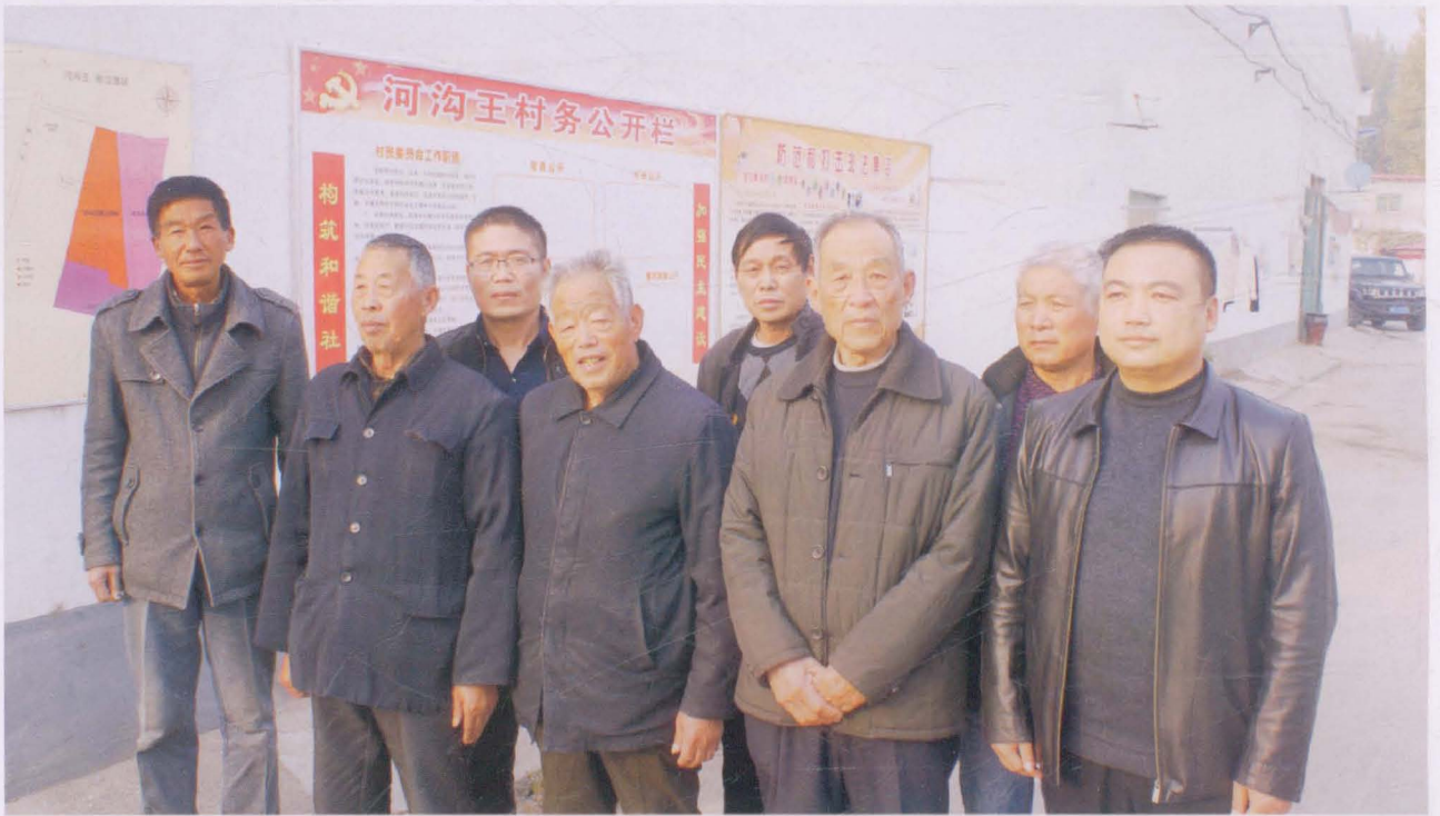
河沟王村志编纂人员合影