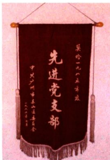
广州市东山区人民检察院从1985年起连续五年被中共广州市东山区委员会评为先进党支部。