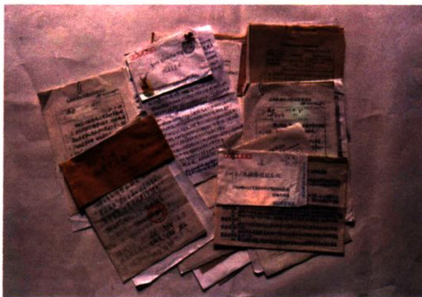
上图：广州市东山区人民检察院受理群众来信。