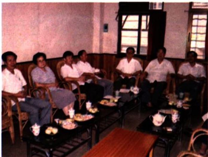
东山区人民检察院 新老正副检察长合影