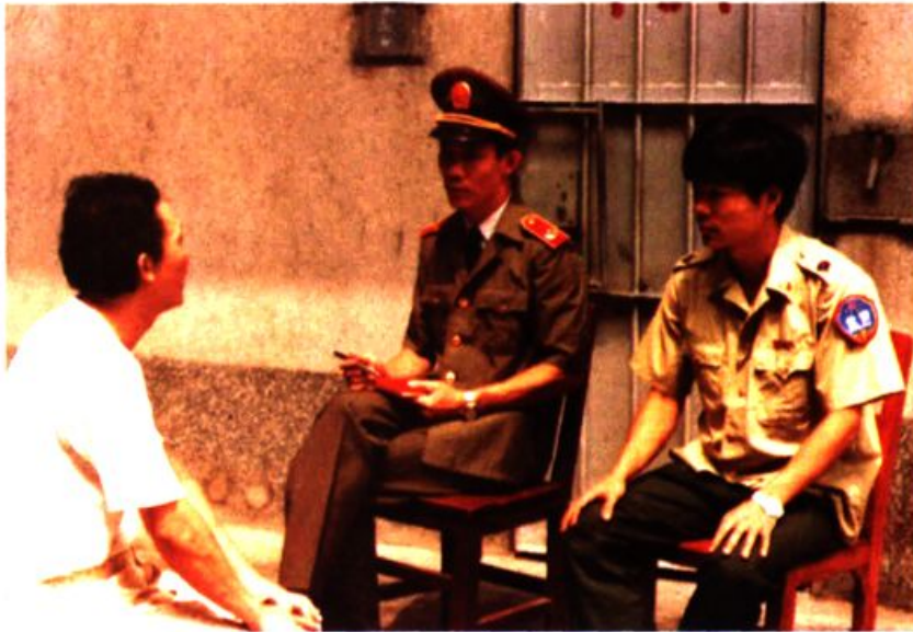
东山区人民检察院监所检察科干部与东山区公安分局看守所的管教干部共同对在押人犯谈话教育。