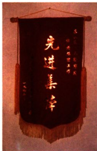
广州市东山区人民检察院被中共东山区委保密委员会评为保密工作先进集体。