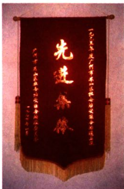
广州市东山区人民检察院被广州市东山区社会治安综合治理委员会评为1993年度先进集体。