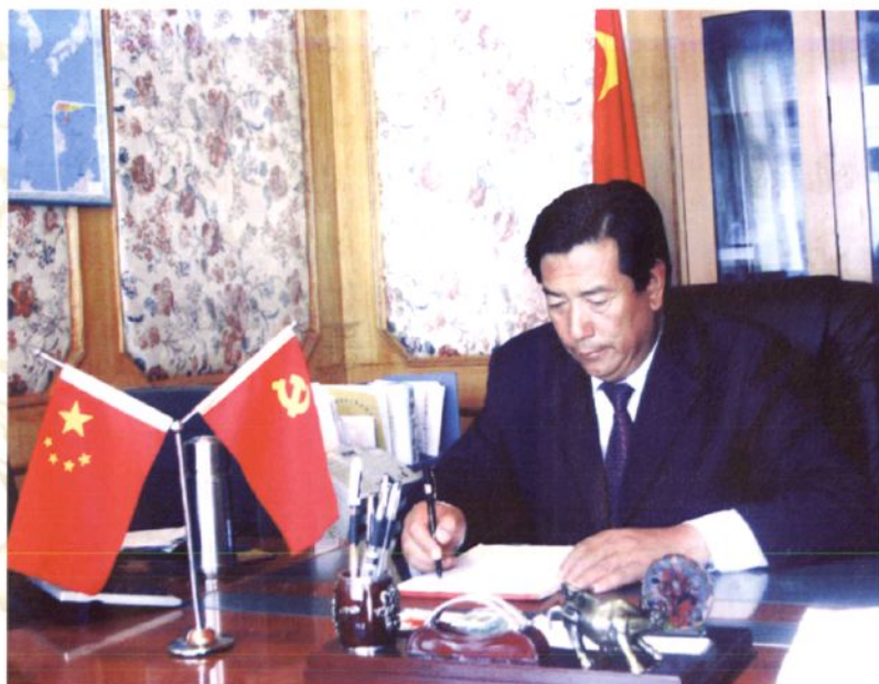
中共称多县委副书记、县人民政府县长 更太