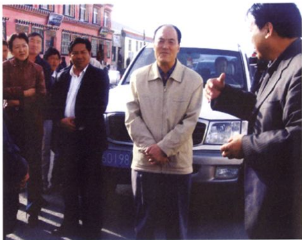
全国人大常委会委员、省人大常委会副主任马福海赴称多视察生态移民工程