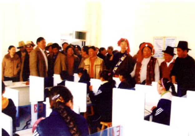
人大代表关心教育事业，视察 县第一民族中学