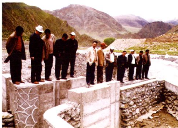
部分县人大代表视察全县重点工程 和重大项目实施情况