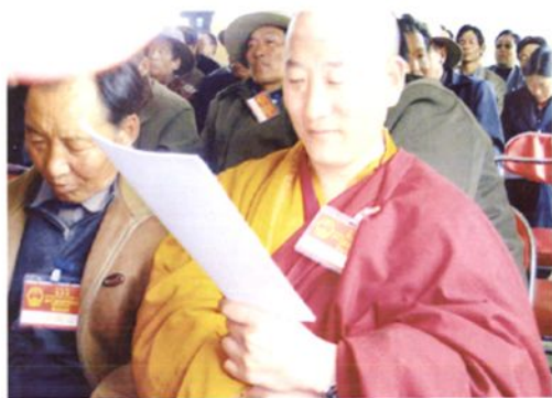
代表们认真听取工作报告