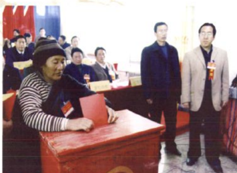
基层代表投上神圣一票