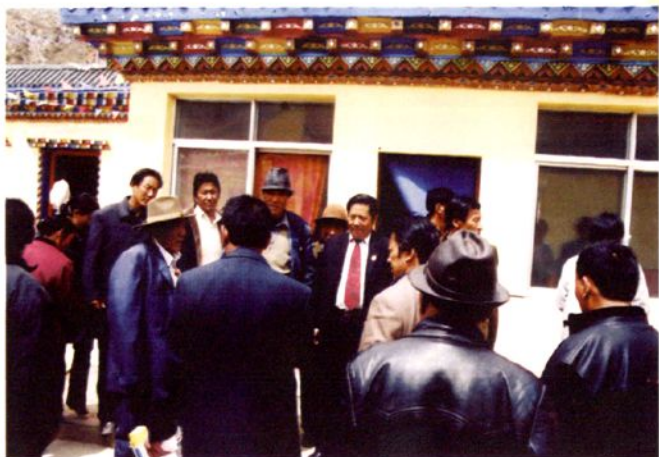
人大代表视察称文镇敬老院