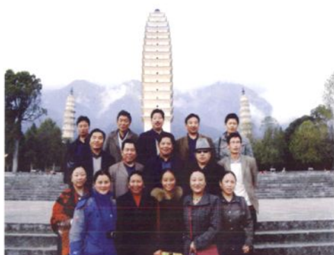
市人大常委会机关全体干部赴外地考察留念