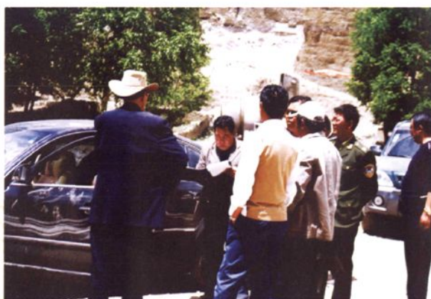
部分人大代表调研基础设施建设情况