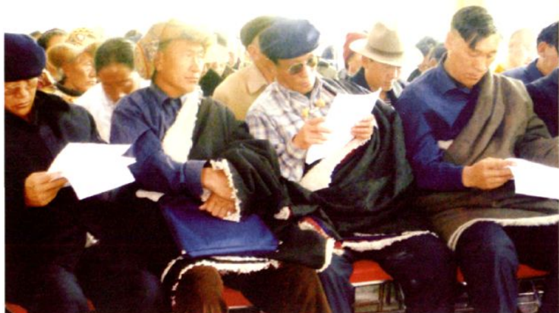
基层人大代表认真学习《监督法》