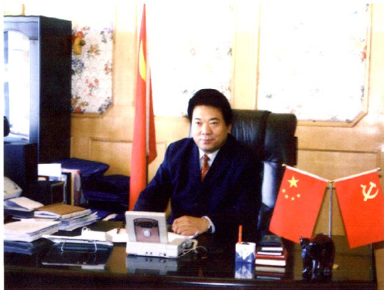
州委常委、原中共称多县委书记 白加扎西