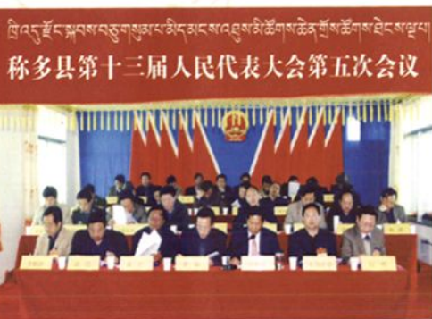
在称多县第十三届人民代表大会第五次会议上