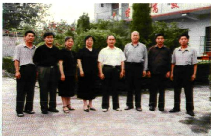
团结、务实、高效、进取、 的白河镇教办室领导班子