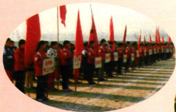
盛大的运动会开幕式