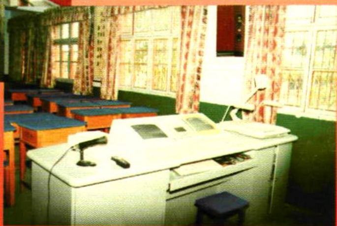
功能完备的电教室