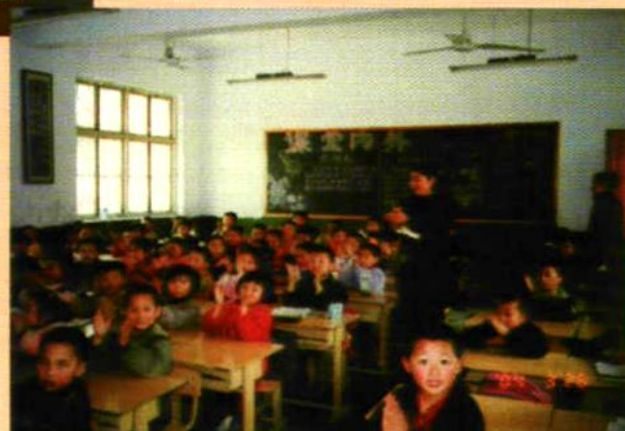
创新课堂教学模式