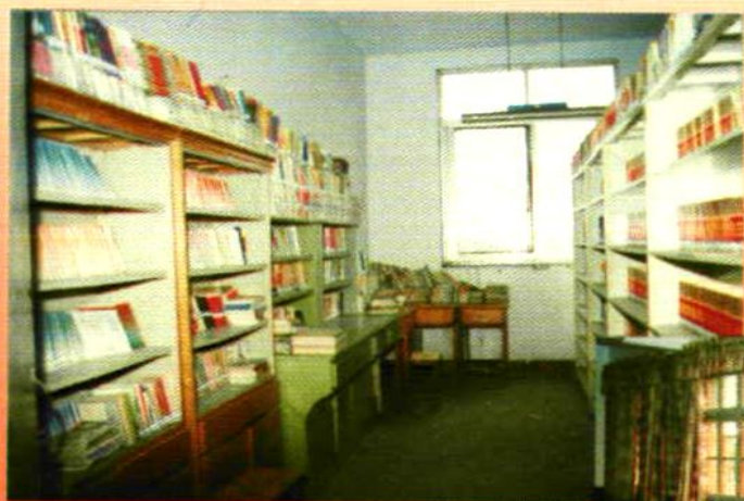
藏书丰富的图书室