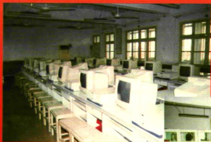
一网知天下的网络教室