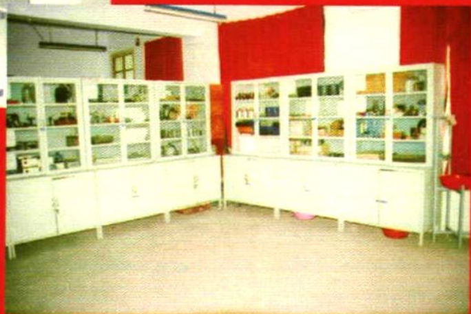
品种齐全的仪器室