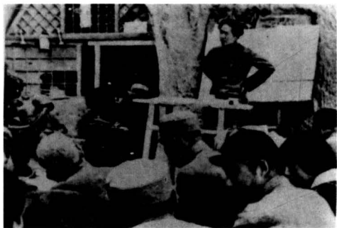
图 1.2 延安时期毛泽东给鲁艺师生作报告