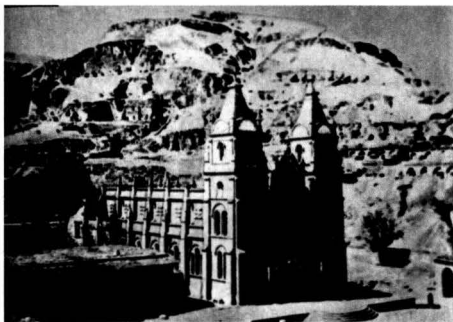
图 1.3 1939 年 8 月 鲁艺在延安东郊桥儿沟校址

1939 年 5 月，鲁迅艺术学院举行创立一周年纪念大会（图 1.3）。毛泽东等莅会并为鲁迅艺术学院题词。毛泽东的题词是：“抗战的现实主义，革命的浪漫主义”。1940 年，鲁迅艺术学院改称为“鲁迅艺术文学院”。在建校两周年纪念日，毛泽东亲笔题写校名，并题写了“紧张、严肃、刻苦、虚心”的八字校训，成为鲁艺的革命校风与教育准则。同时期，中央还明确规定鲁艺教育方针的基本要求：团结与培养文学艺术的专门人才，以致力于新民主主义的文