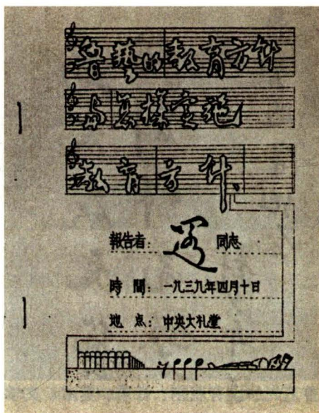
图 1.1 1939年4月鲁艺的教育方针

1938年春，为了培养抗战艺术干部，提高抗战艺术的思想及艺术水平，使艺术的武器在抗战中发挥最大的效能，在革命圣地延安，毛泽东及党中央领导创办了“鲁迅艺术学院”，简称“鲁艺”。毛泽东、周恩来、林伯渠、徐特立、成仿吾、艾思奇和周扬等同志联名发出的鲁迅艺术学院《创立缘起》一文中指出：“我们决定创立这所艺术学院，并且以已故的中国最大的文豪鲁迅先生为名，这不仅是为了纪念我们这位伟大的导师，并且表示我们要向他所开辟的道路大踏步前进”。同时，中央书记处为鲁迅艺术学院规定了教育方针（图 1.1）：“以马列主义的理论与立场，在中国新文艺运动的基础上，建设中华民族新时代的文艺理论与实际，训练适合今天抗战需要的大批艺术干部，团结和培