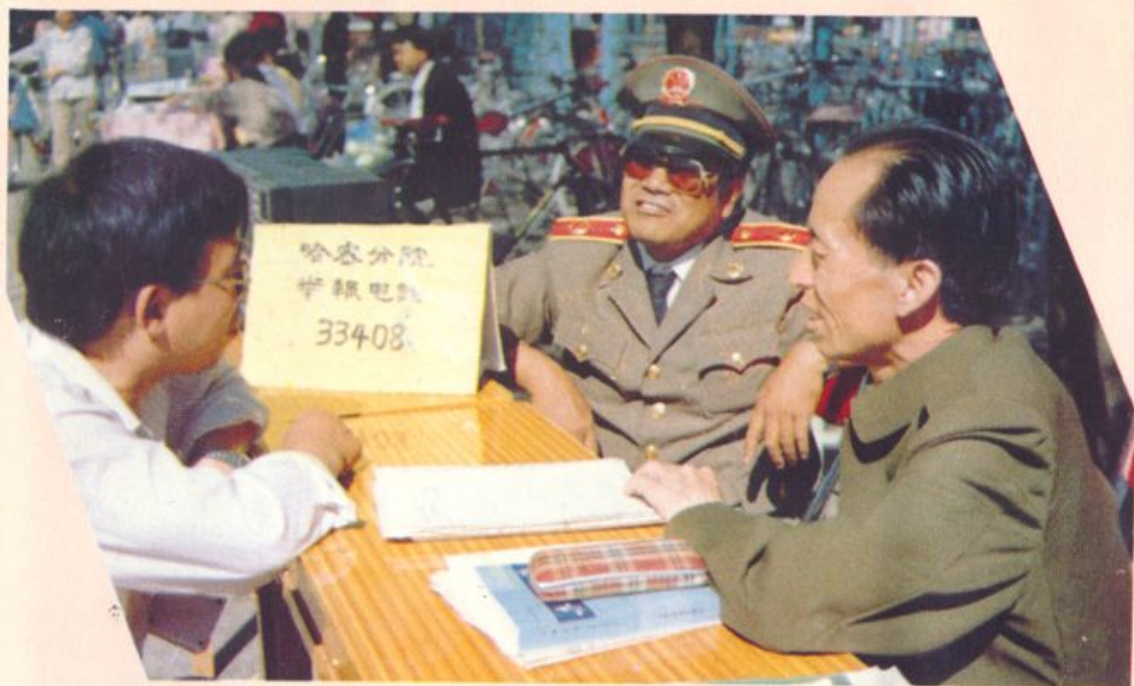
分院领导和干警一起上街开展法律咨询