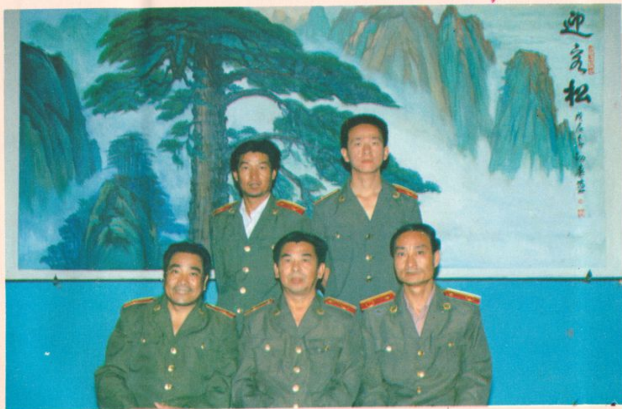
《检察志》编撰人员合影