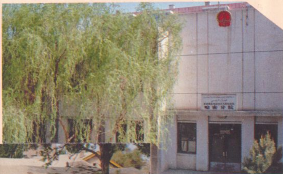
哈密分院办公楼外影 (左下角办公室旧址)