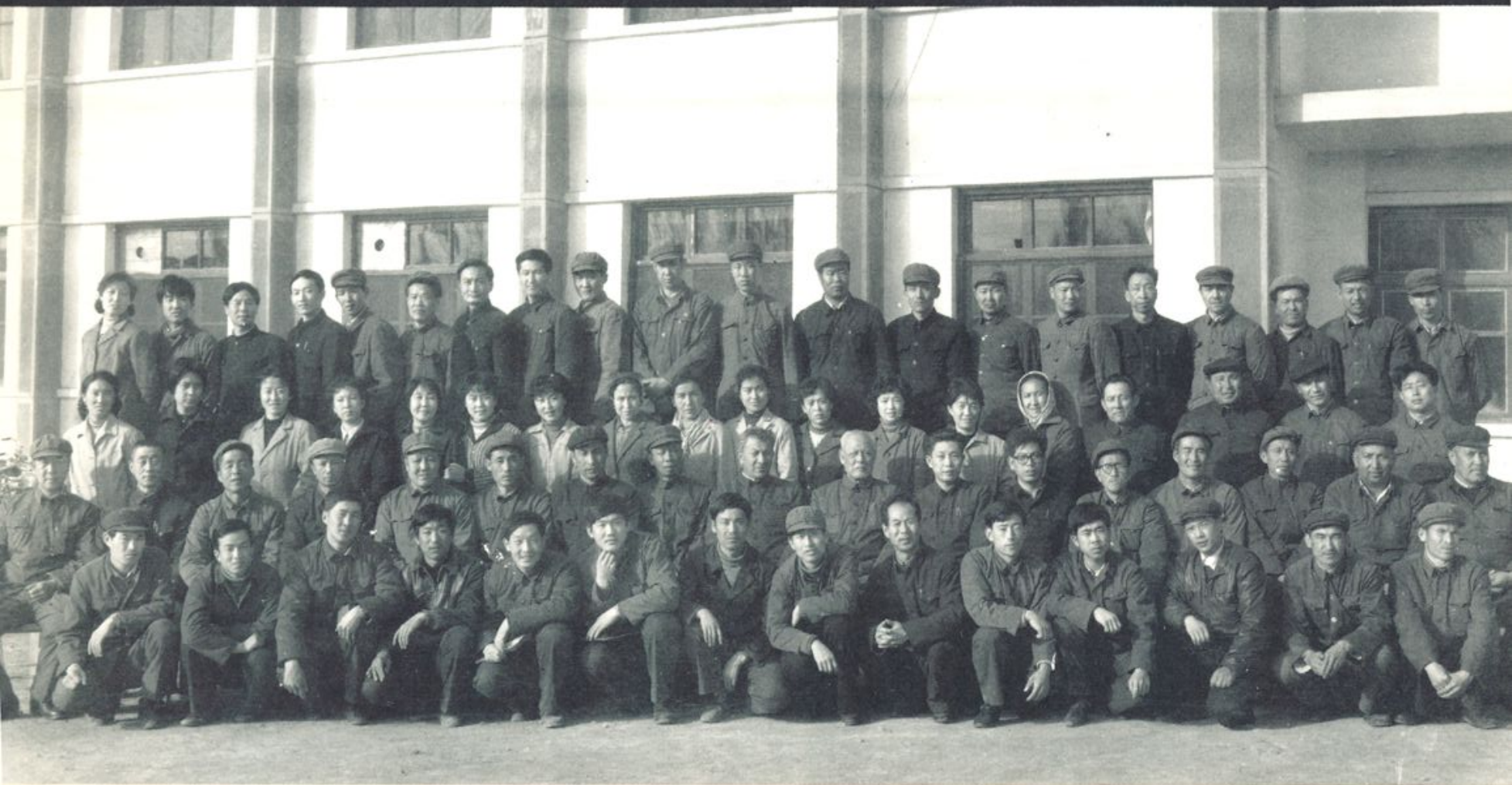
自治区检察院领导与哈密部分干警合影