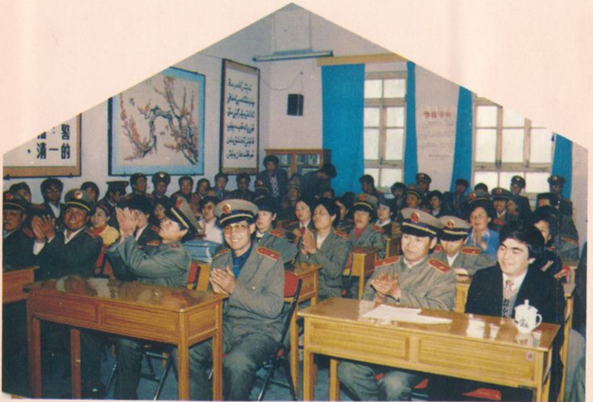
分院和市院干警聆听米吉提·库尔班检察长的讲话