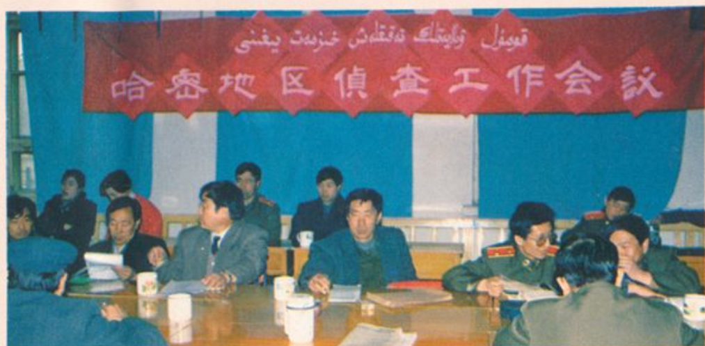
分院召开侦查工作会议