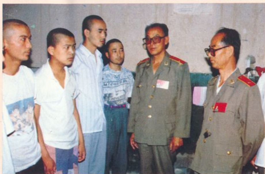
经常向在押人犯进行 认罪服法教育