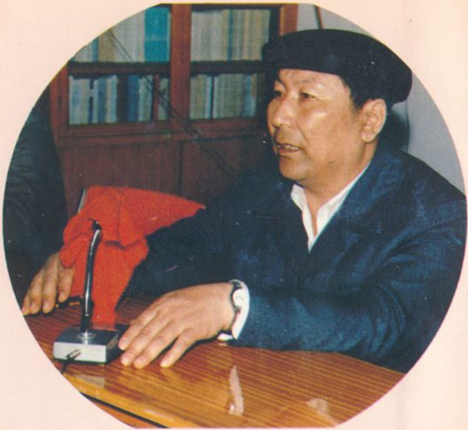
自治区检察院检察长米吉提·库尔班 来哈密检查工作，到分院作重要讲话