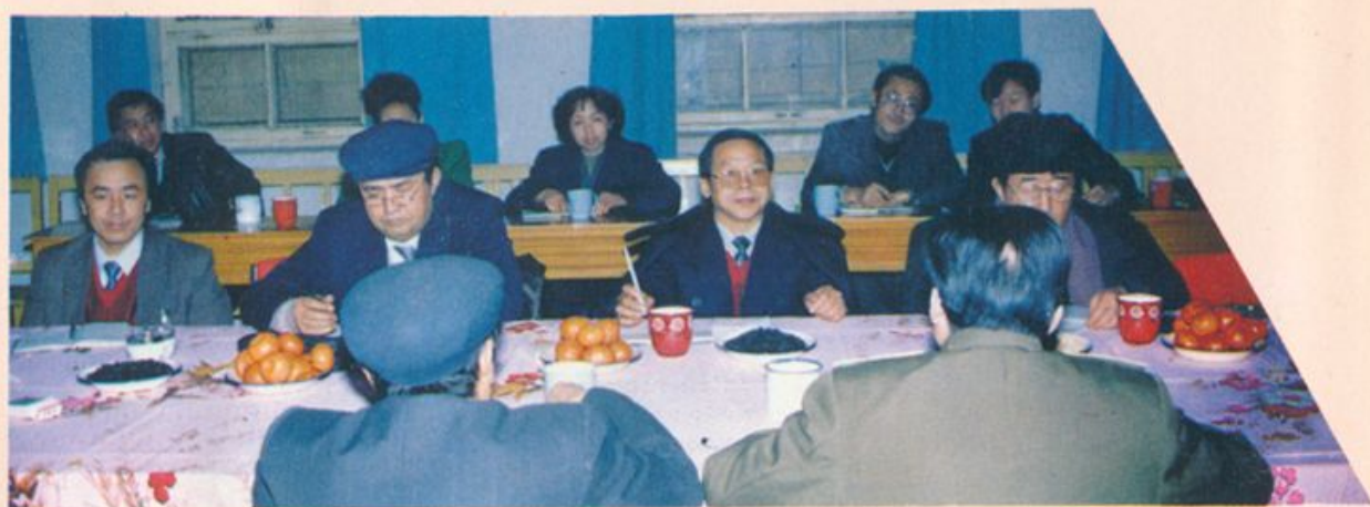
地委,行署主要领导听取分院的工作汇报