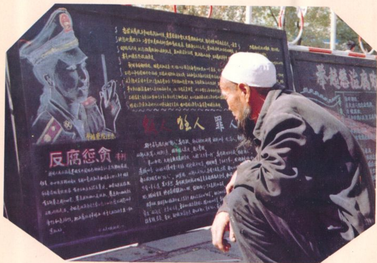
开展反贪污, 贿赂犯罪的宣传