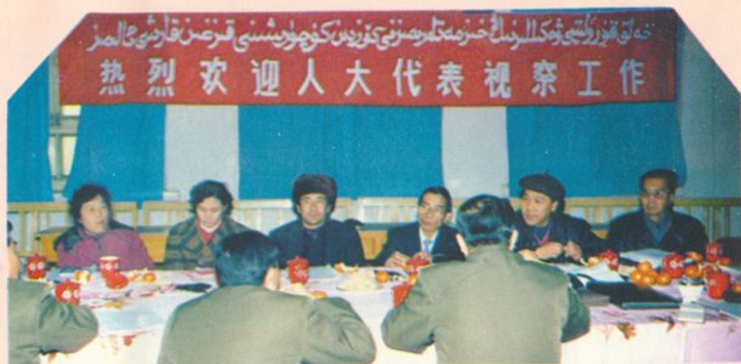
部份在哈密地区的自治区人大代表来分院视察工作