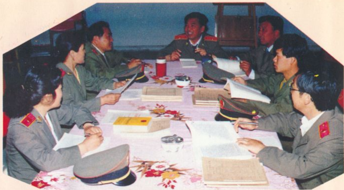
刑事检察科讨论案件