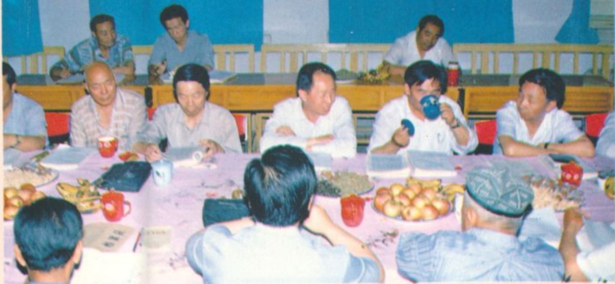
分院召开《检察志》评审会