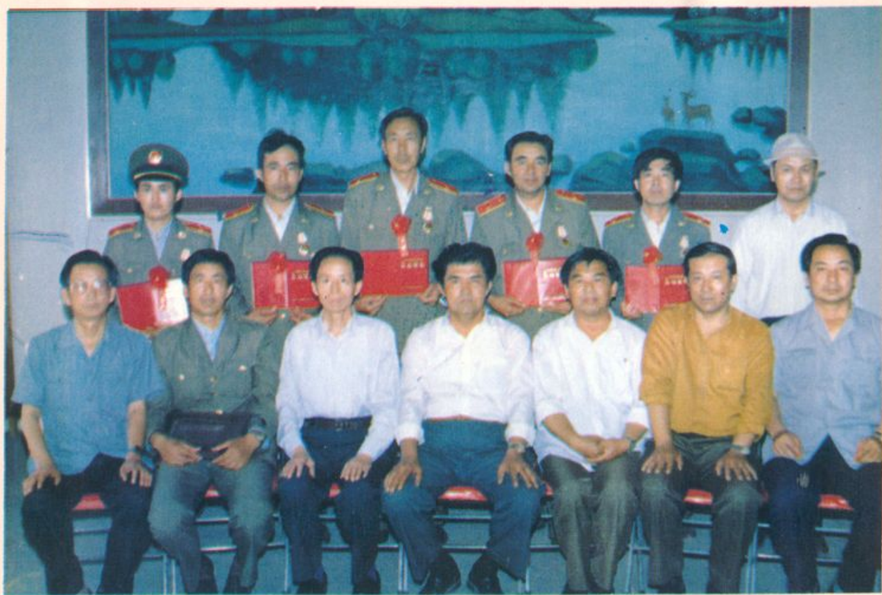
及时表彰查处贪污贿赂重大案件的有功人员，地委副书记，政法书记和分院领导同立功人员合影