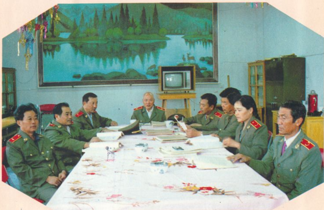
检察委员会会议讨论重大案件