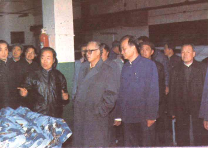
△一九八九年元月十一日起 察阳总书记来厂视察。