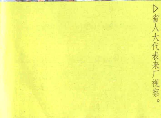
△省人大代表来厂视察。