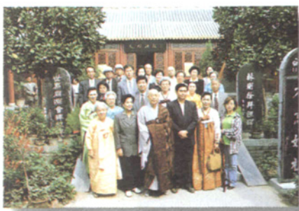
韩国华裔代表团拜祖