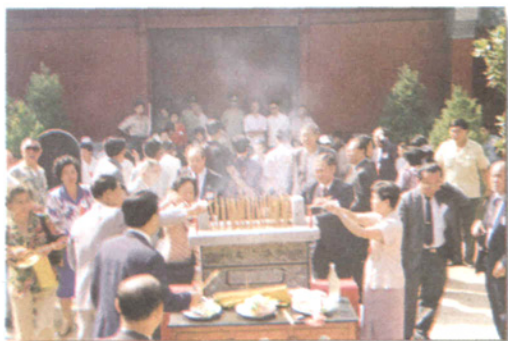
世界客家族总会代表团拜祖