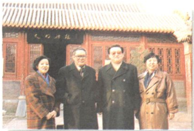
李长春、宋健同志考察黄帝故里