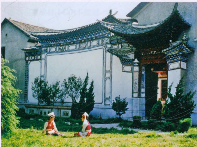
三坊一照壁的白族民居