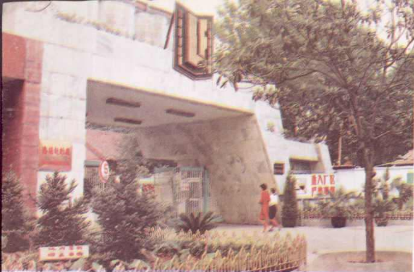
日处理原料五十吨的洛宁油厂