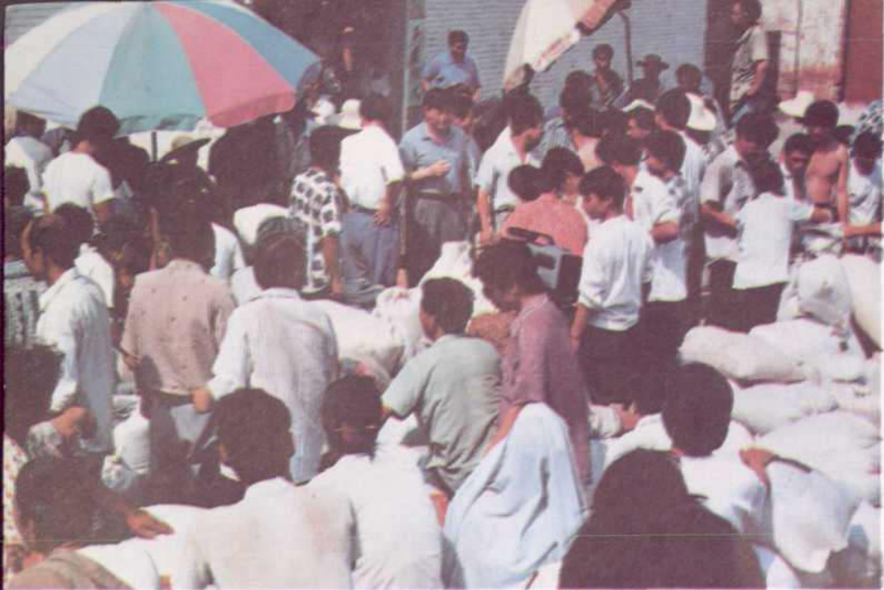
孟津农民踊跃交售定购粮