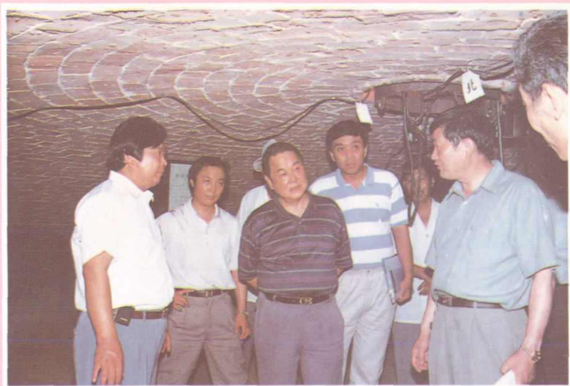
国内贸易部部长陈邦柱视察洛阳市地下粮仓