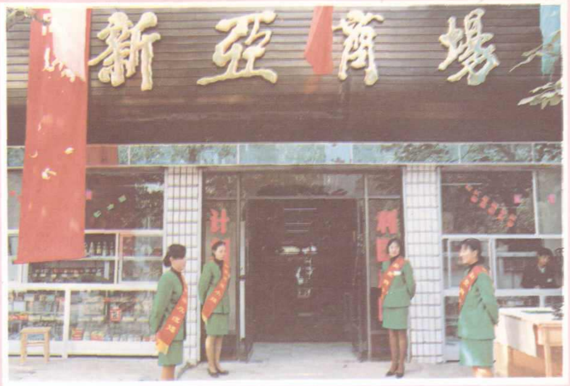
三门峡市粮食局湖滨分局设立的新亚商场