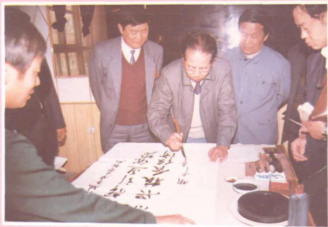
原商业部部长胡平在洛阳视察粮食工作并题词留念