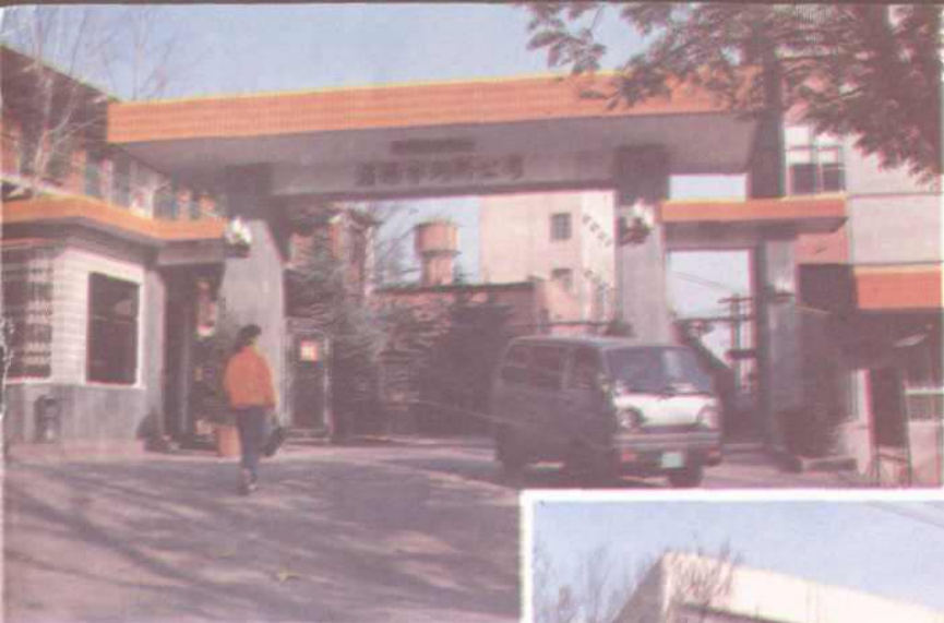
洛阳市饲料公司外景