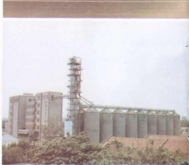
容量一五〇〇万公斤钢筋混凝土立筒库