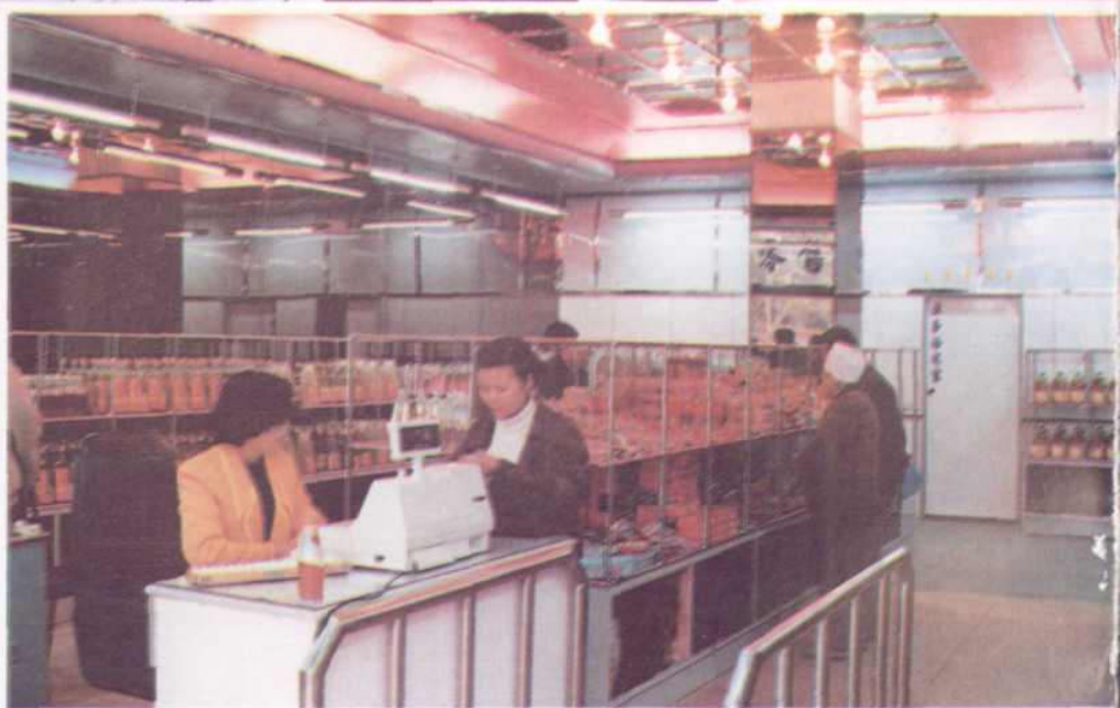
军烈属送粮上门 “三八”红旗粮店职工为老红军