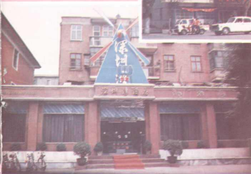
洛阳市粮食总公 司西苑公司兴建 的深圳湾酒店