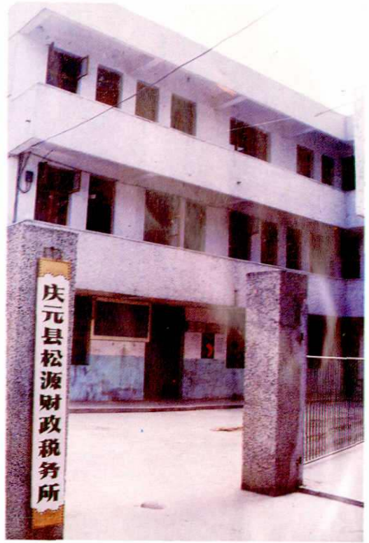
12. 松源财税所办公楼