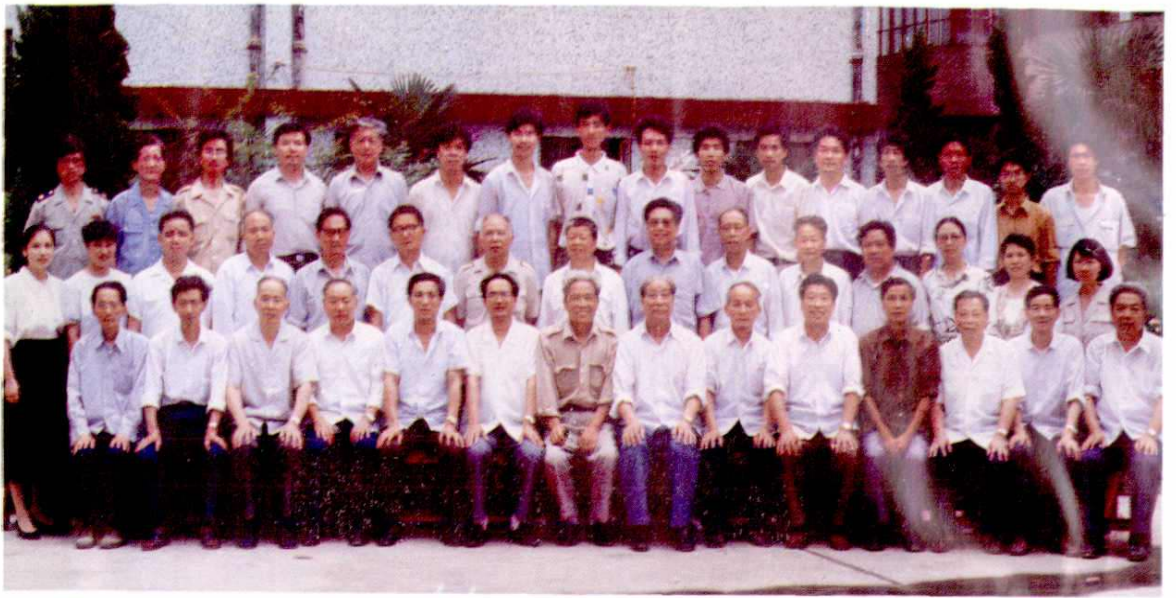
3. 财税志审稿会议留影