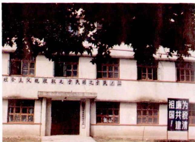
19. 荷地财税所办公楼