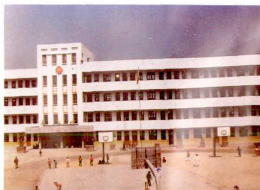
35. 庆元县实验小学教学楼