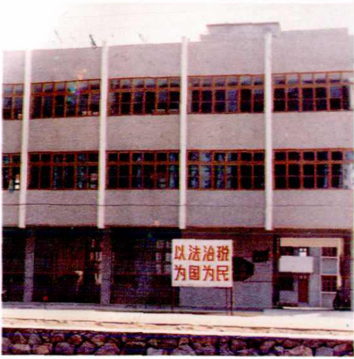
15. 菊隆财税所办公楼