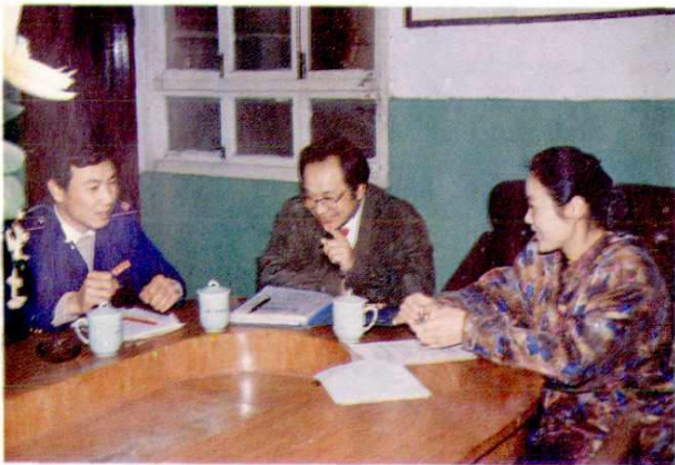
2. 财税局领导研究工作