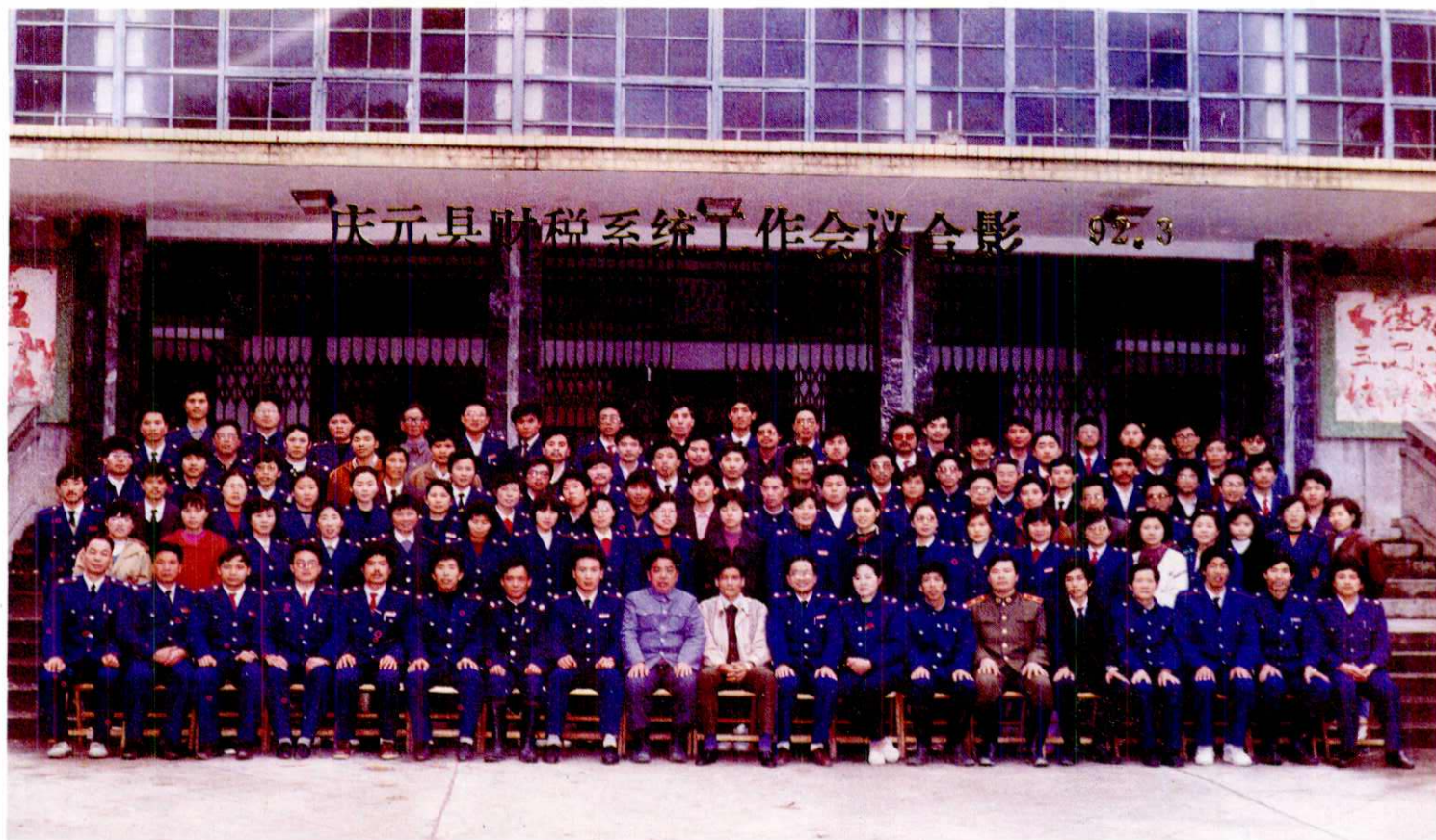
1. 庆元县财税系统工作会议合影