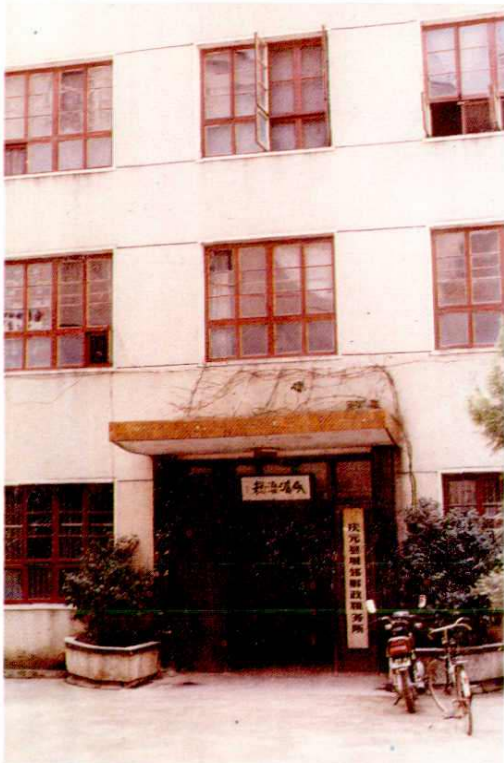
13. 城郊财税所办公楼