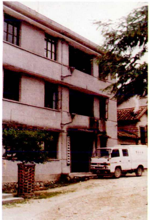
18. 万里财税所办公楼