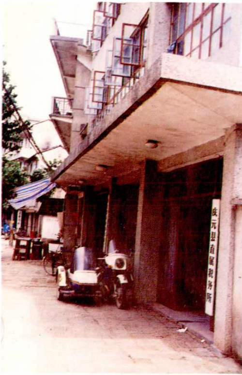
11. 直属财税所办公楼