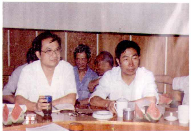
4. 庆元县委和财税局领导在财税志审稿会议上