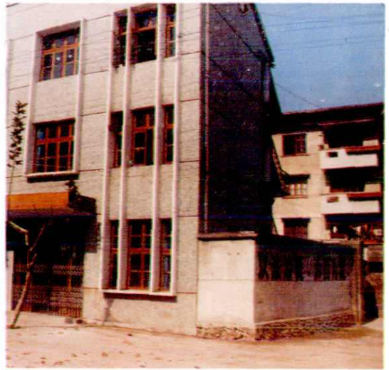
16. 竹口财税所办公楼