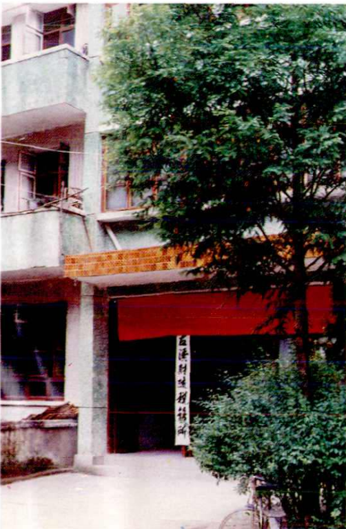
17. 左溪财税所办公楼