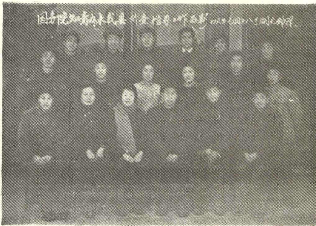
志，同省、地知青办负责人和县领导同志合影。 图五、一九七六年元月，国务院知青办来我县视察的同