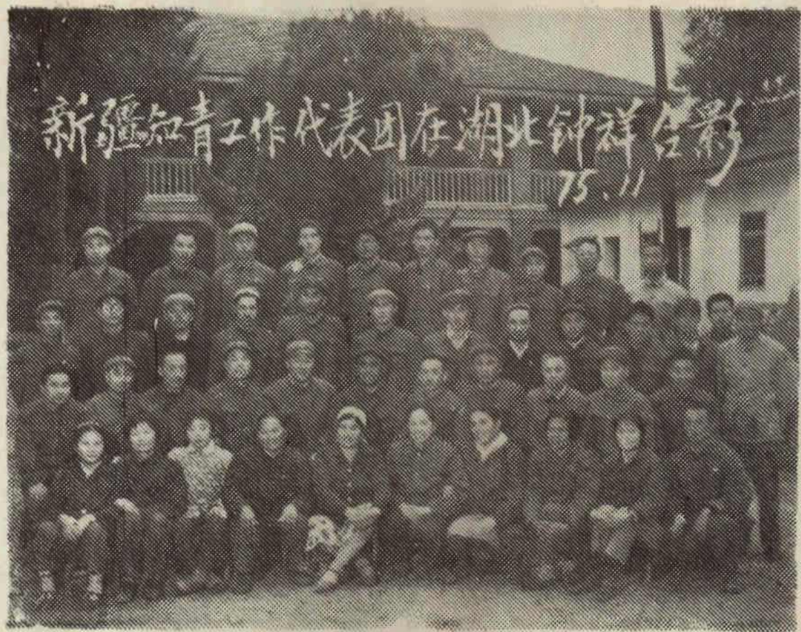
图六、一九七五年十一月，新疆维吾尔自治区知青工作 参观团在钟祥。