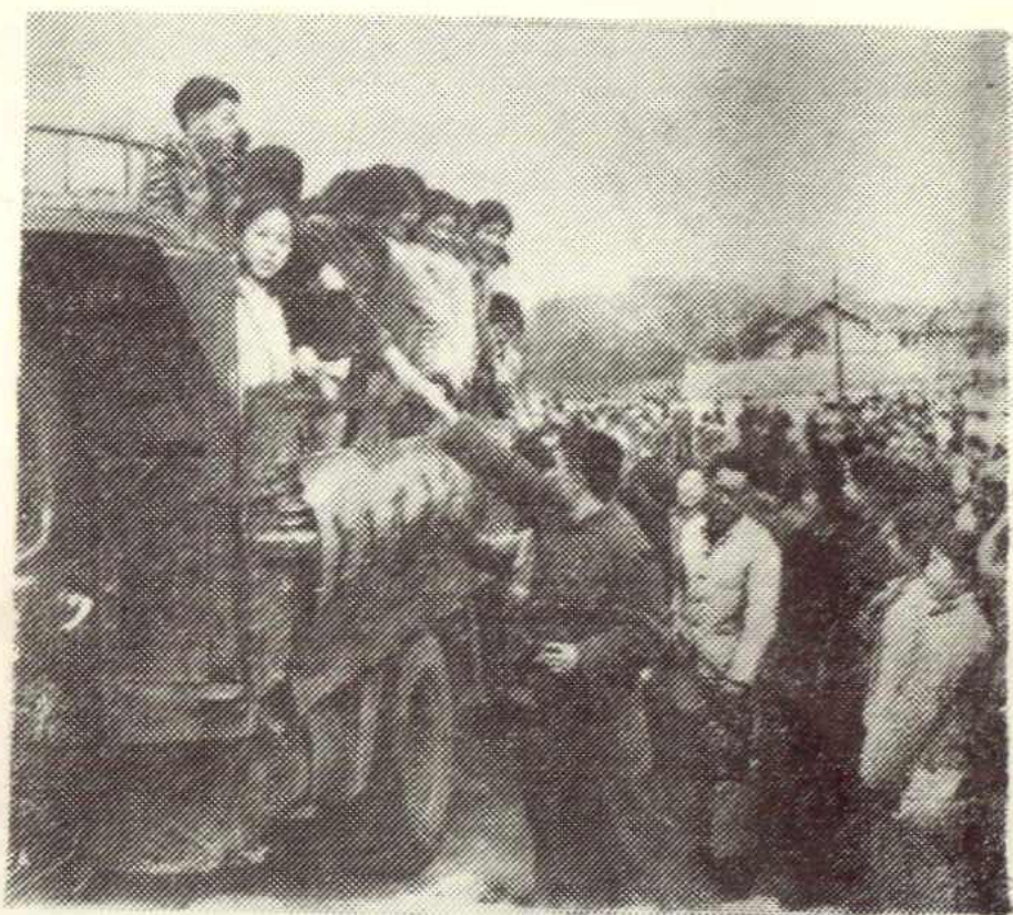
图二、一九七三年秋，城关地区欢送县一中城镇中学毕业生上山下乡的情景。