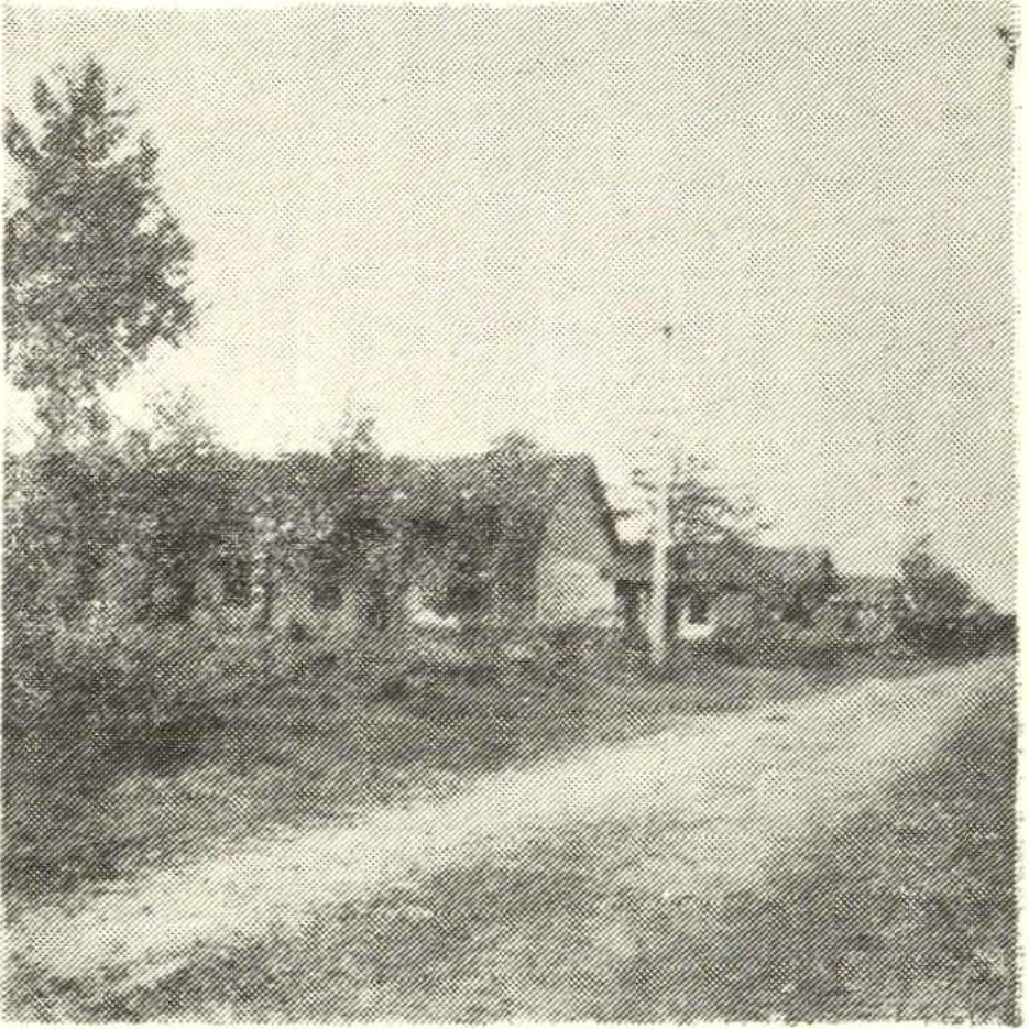
图三、县直工交战线对口安置的双桥农场平桥大队知青 林场部分知青宿舍照片