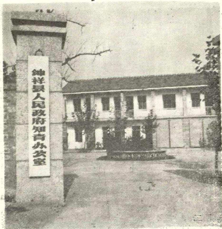
图一、鍾祥县人民政府知青办公室。