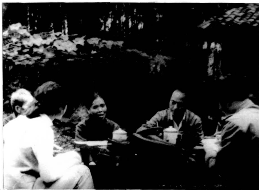
民政干部慰问军属。 ▲ 1988年乡