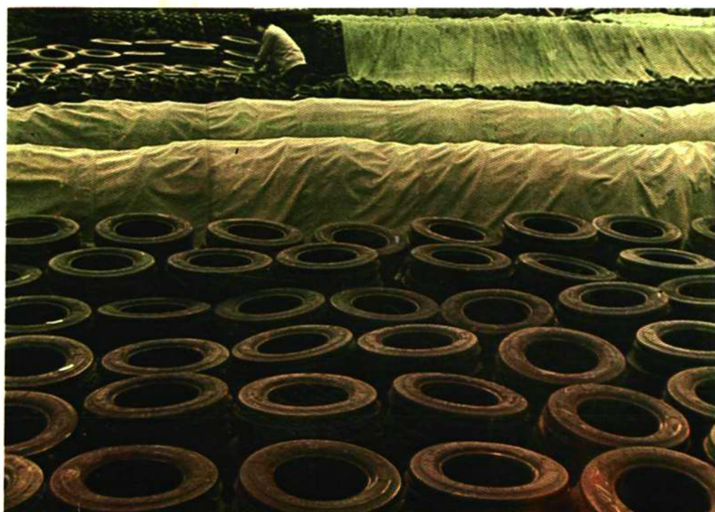
供销科轮胎放置库