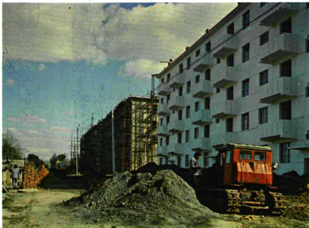
基建队白房宿舍楼施工现场