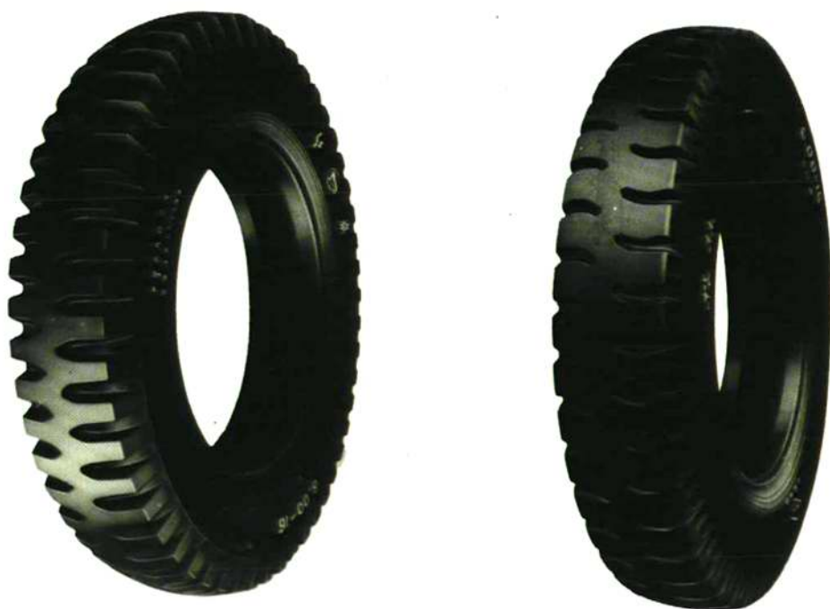
旅游车轮胎 规格：6.50—16 6.00—16 4.50—12