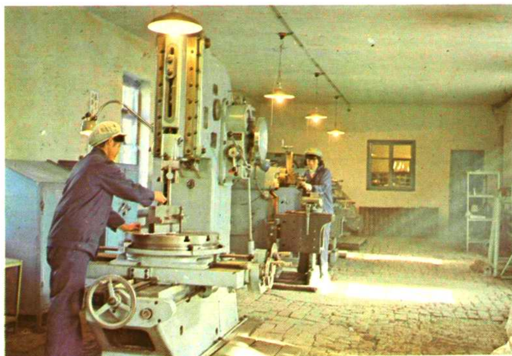
修配车间机床间一角