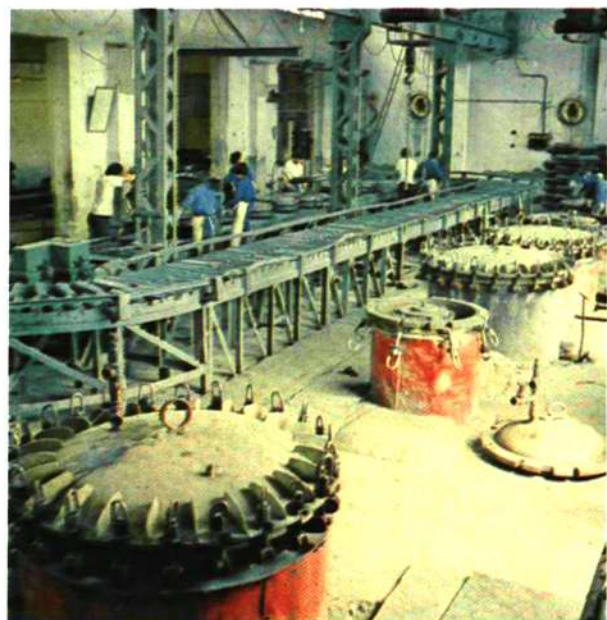
轮胎外胎硫化工艺