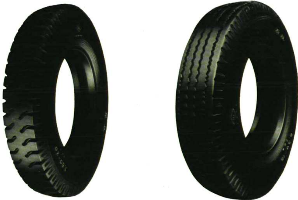
载重、轻型载重轮胎 规格：7.50—20 6.50—16