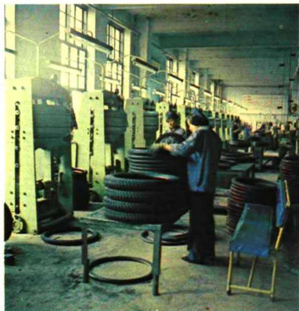
“小三胎”外胎硫化工艺