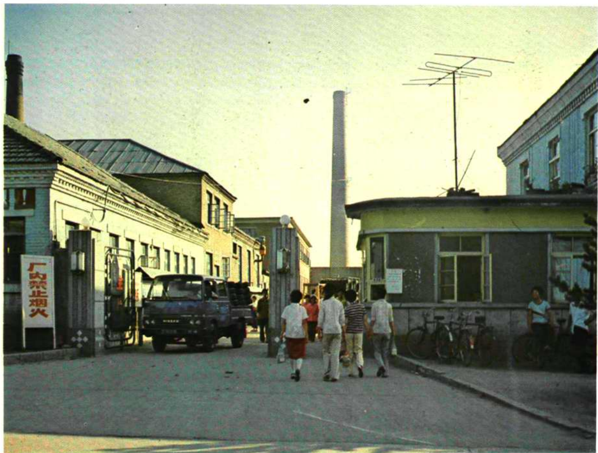
公司主要生产区正门