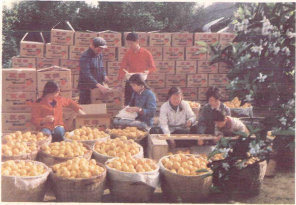
江安夏橙丰收景象