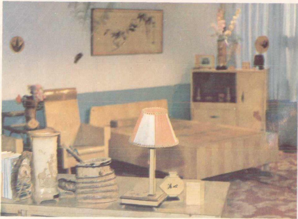
江安部分竹簧工艺品