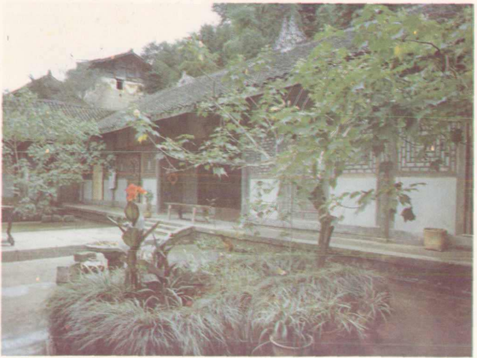
全国第二民俗博物馆——锡家山