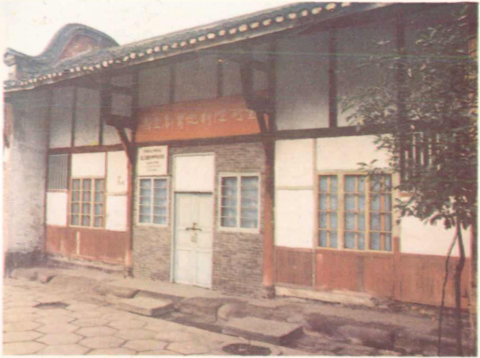
国立剧专江安旧址一角