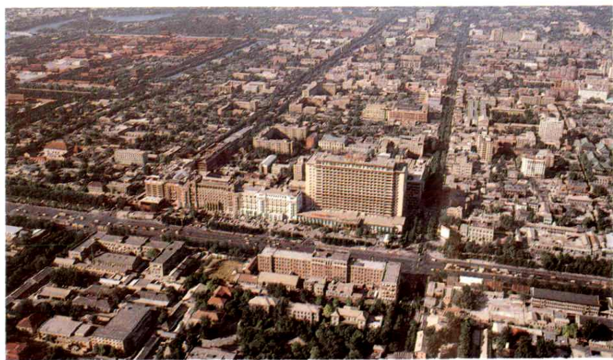
王府井、南河沿大街俯視