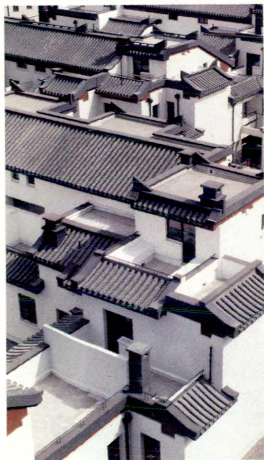
座落在菊儿胡同的楼房式四合院