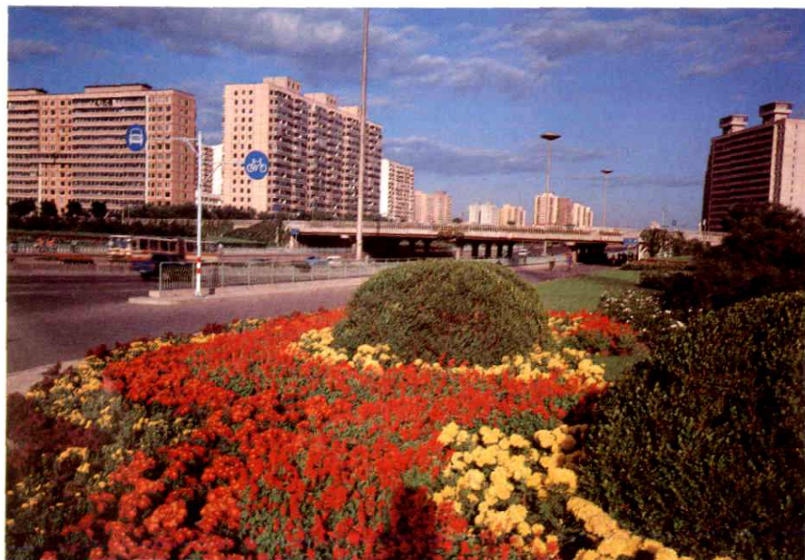
朝阳区安贞里居住区