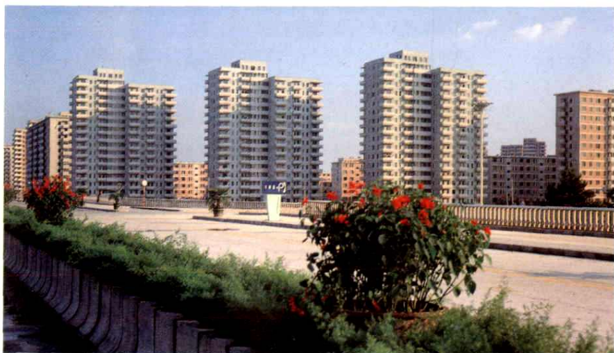
朝阳区左家庄居住区一角