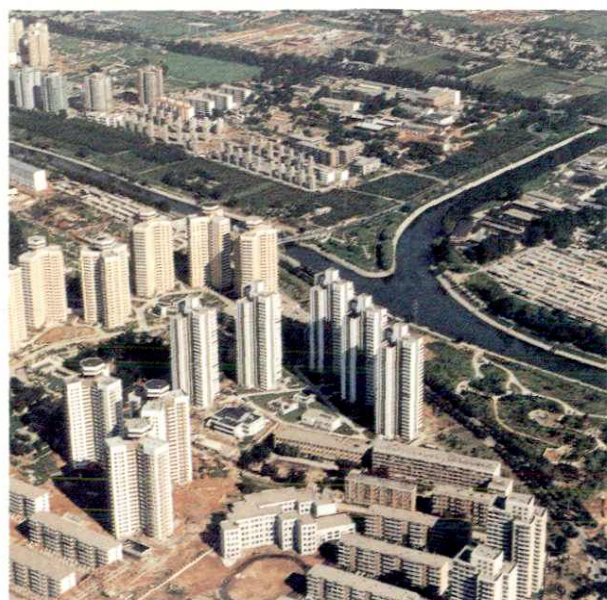
海淀区翠微里建筑群