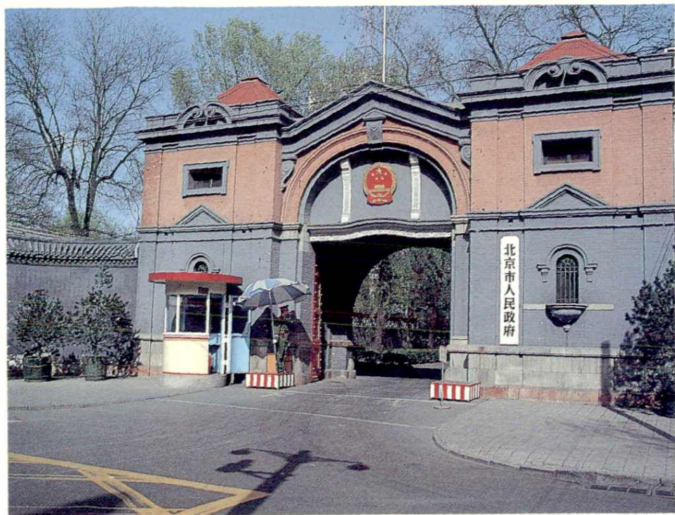
位于正义路东侧的北京市人民政府正门