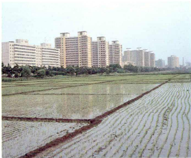
海淀区稻香园居住区