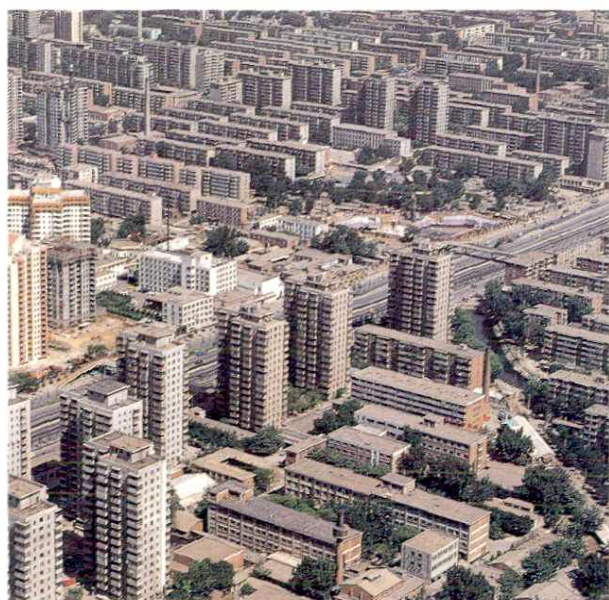
朝阳区劲松居住区