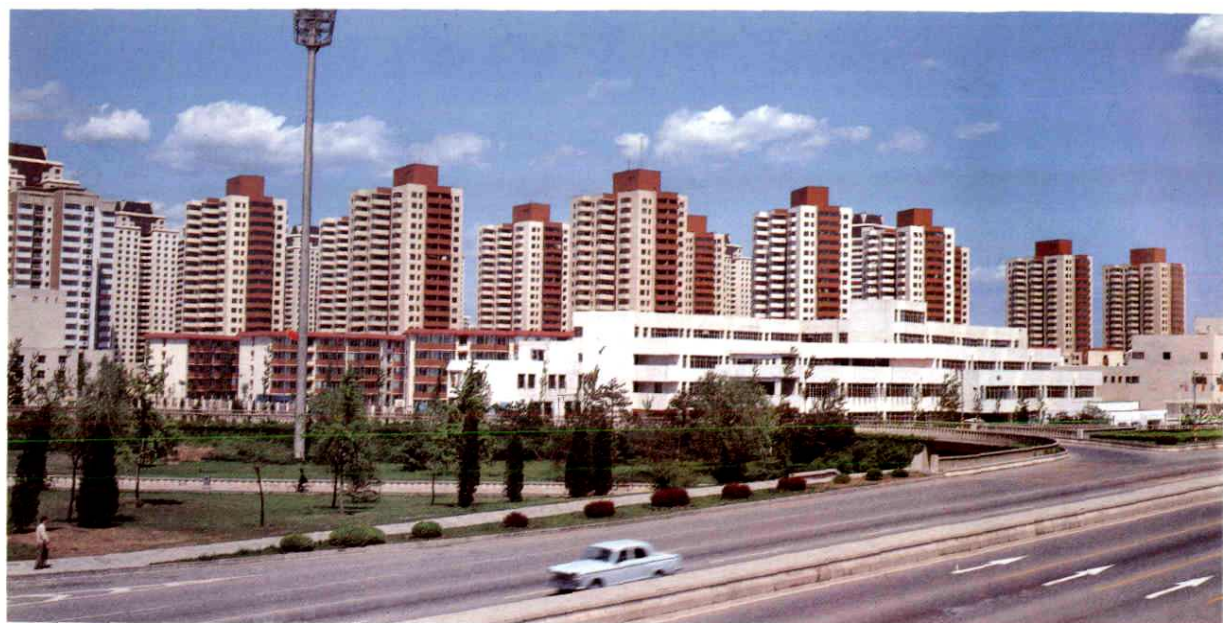
朝阳区安慧北里居住区