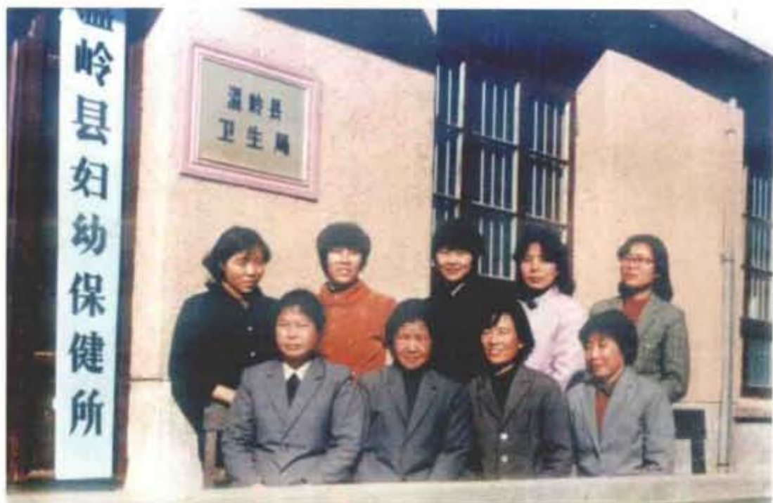
80年代妇保所人员合影