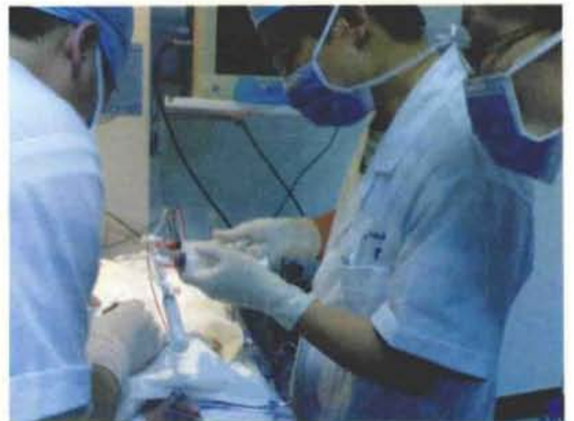
2007年6月开展温岭首例新生儿换血