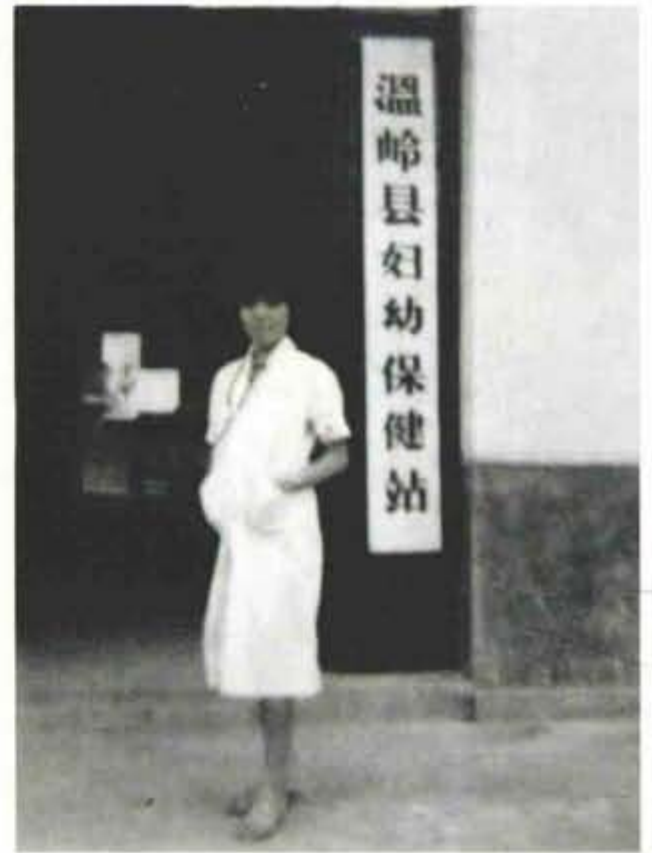
1982年妇幼保健站原址