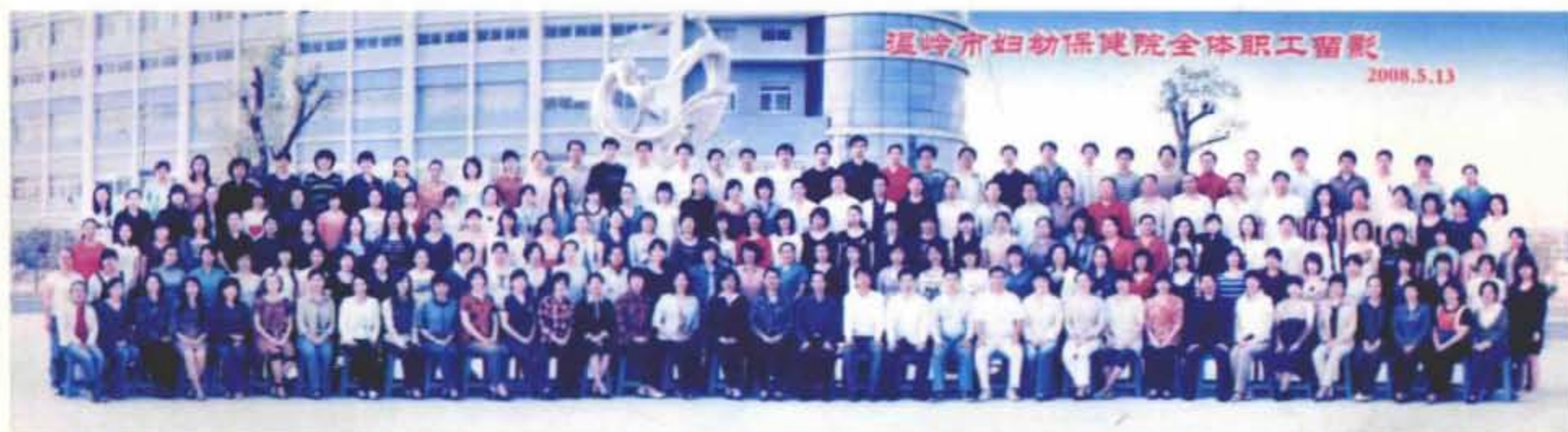
2008年5月，全体职工在大楼南广场合影