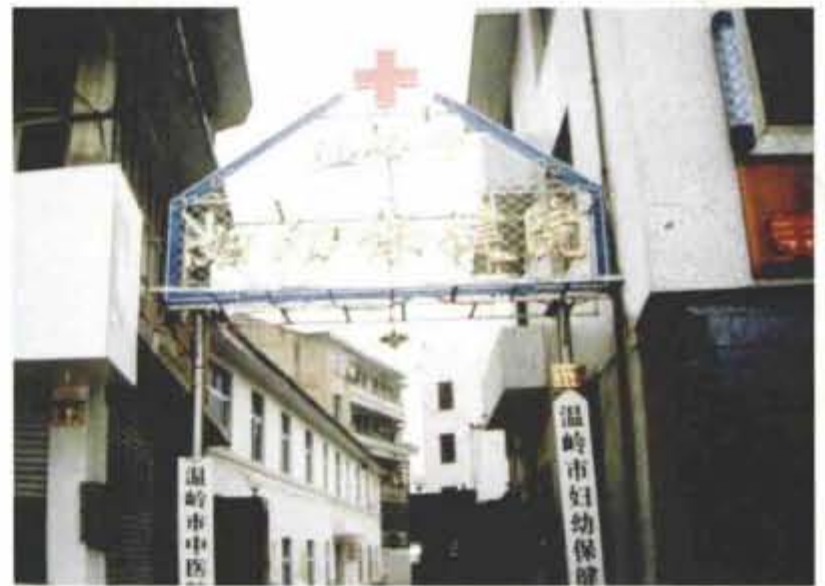
1996年9月，迁至原县中医院旧址组建妇幼保健院