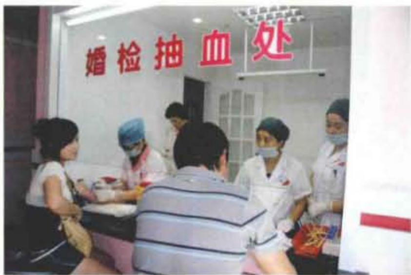
婚登服务中心——婚前医学检查