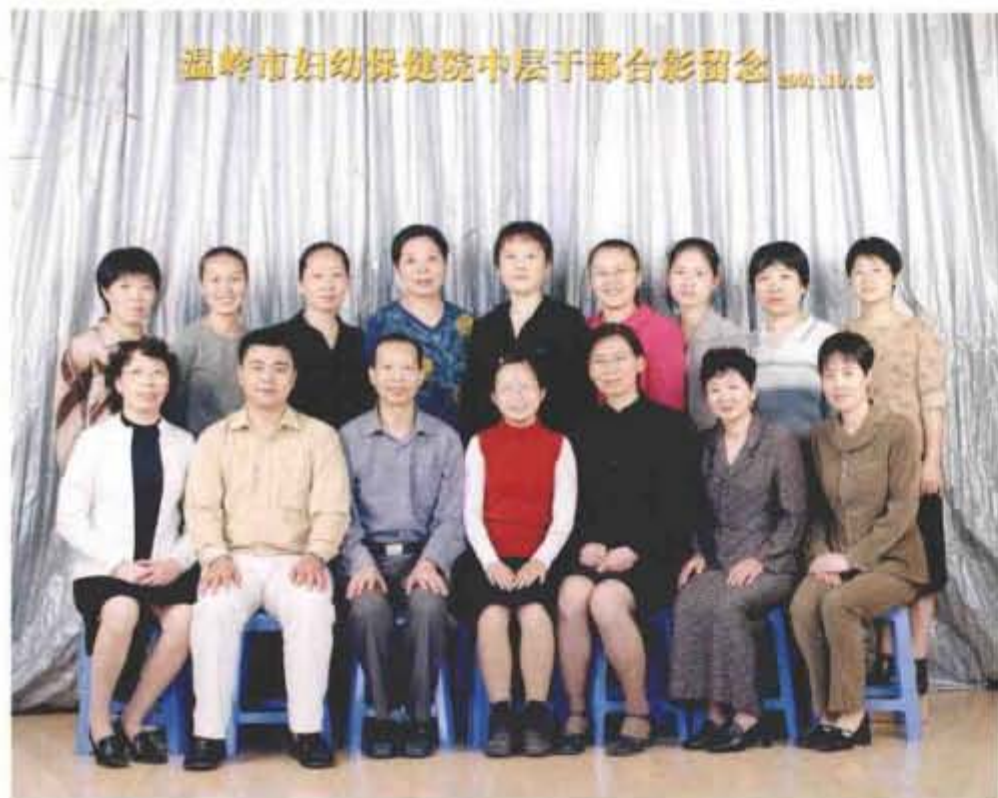
2001年10月，第一 届中层干部合影