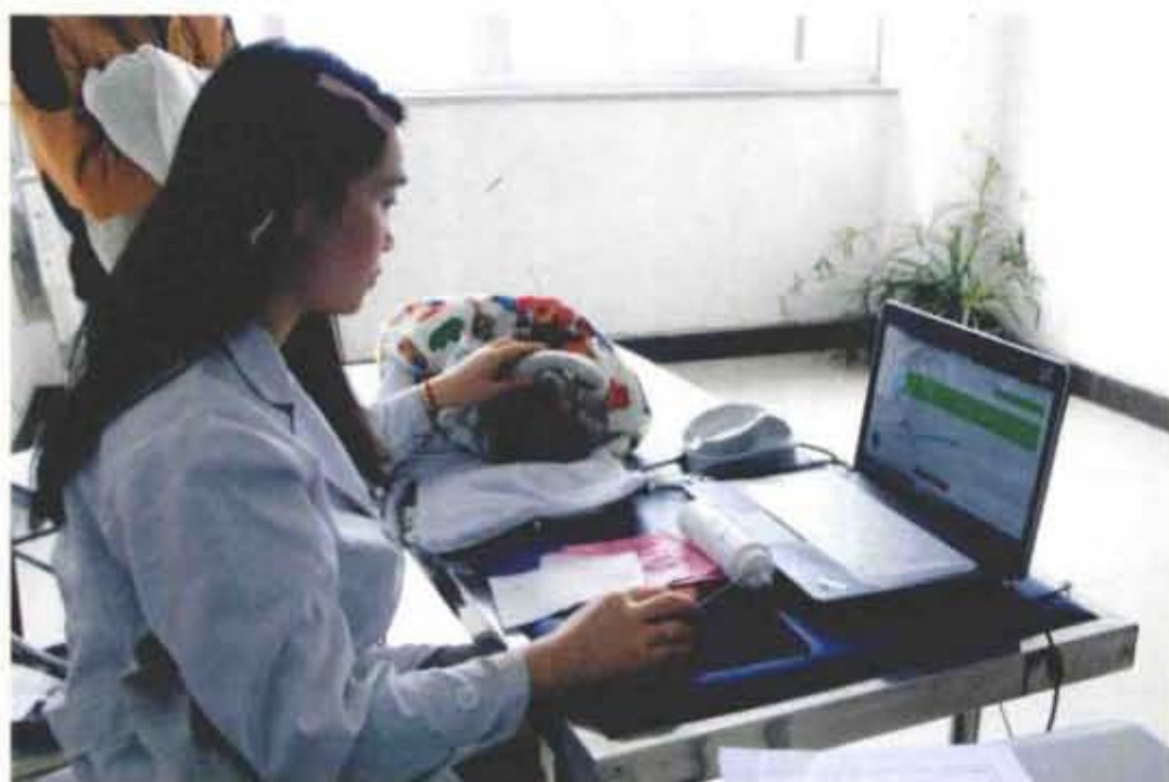
使用听性脑干反应测试仪进行新生儿听力筛查