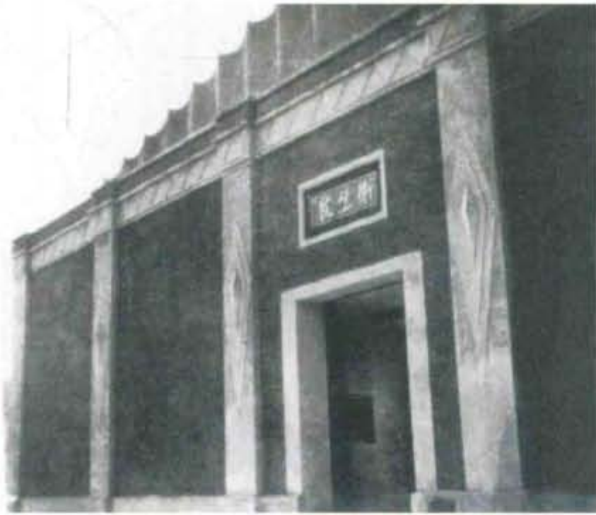
1953年5月，设站时址设县人民政府卫生院