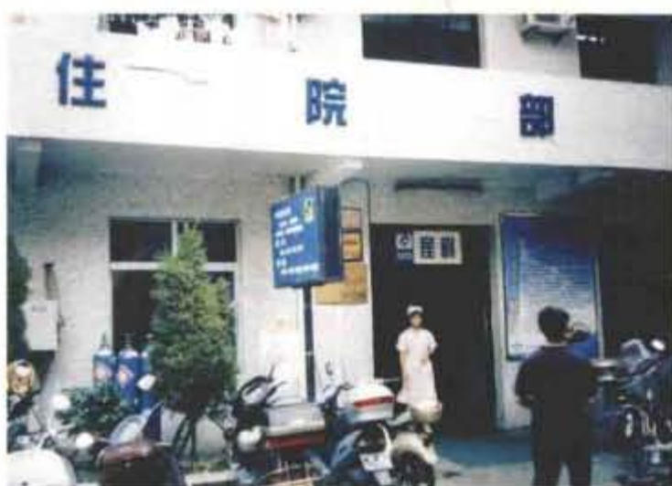
老院妇产科住院部