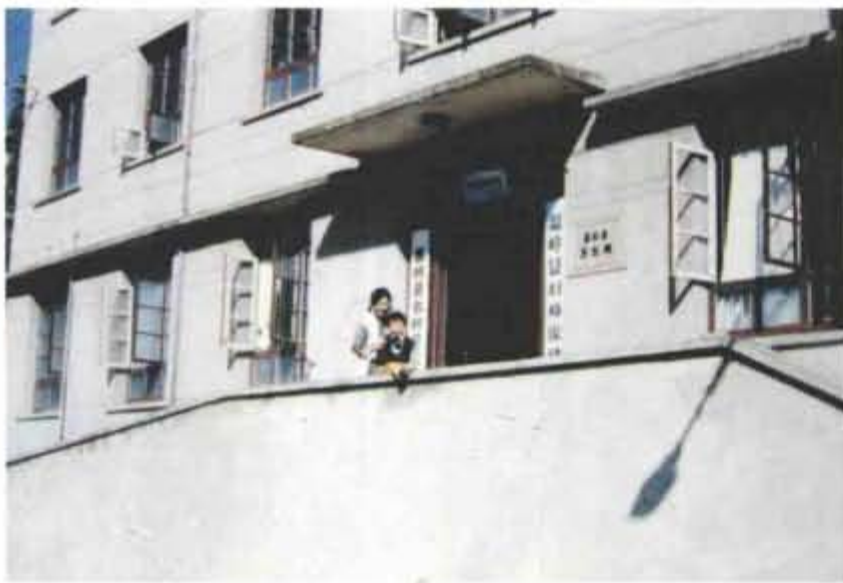
90年代初妇幼保健所原址