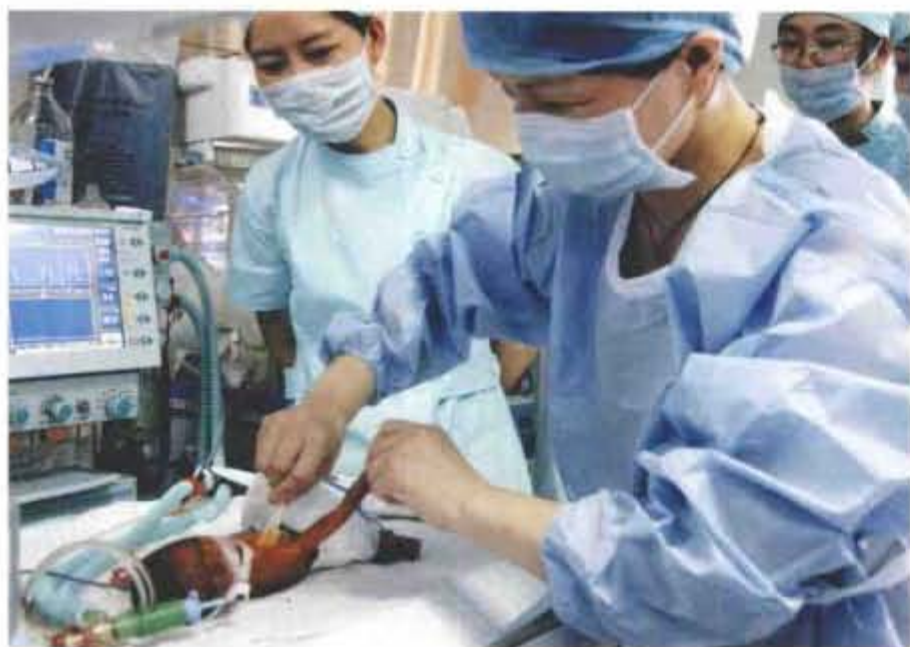
2010年6月开展新生儿 中心静脉置管术