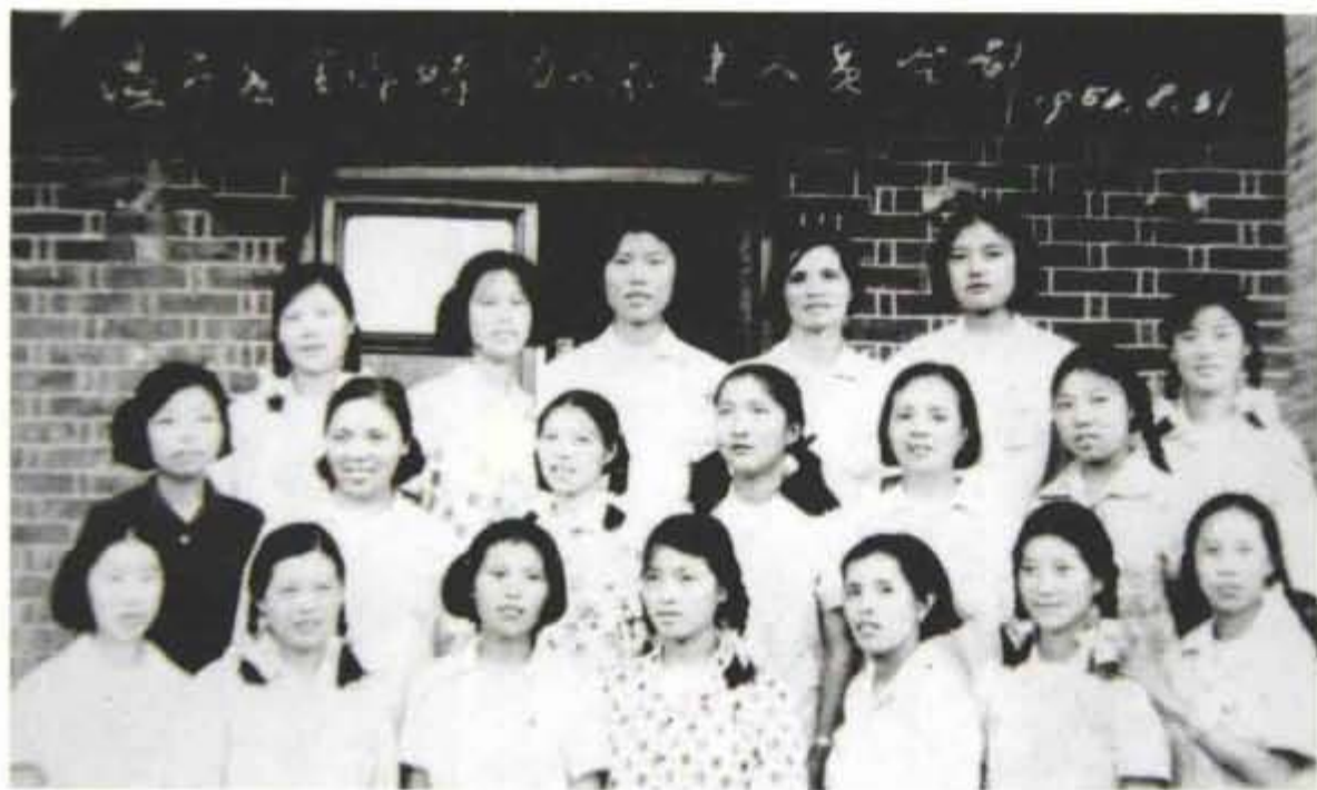
1956年8月， 温岭县全体妇幼保健 人员合影