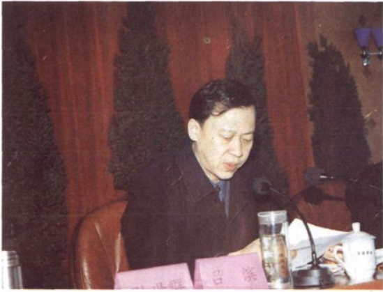
2002年3月，市委副书记、市长吕滨出席全市审计工作会议并发表讲话。