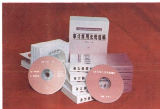
2001年市审计局编写的《审计常用法规选编》（上、下册）及光盘。