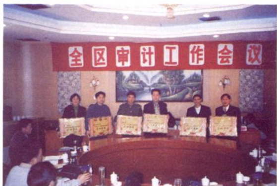
1999年3月4日全区审计工作会议上，获奖县（市）审计局长合影。