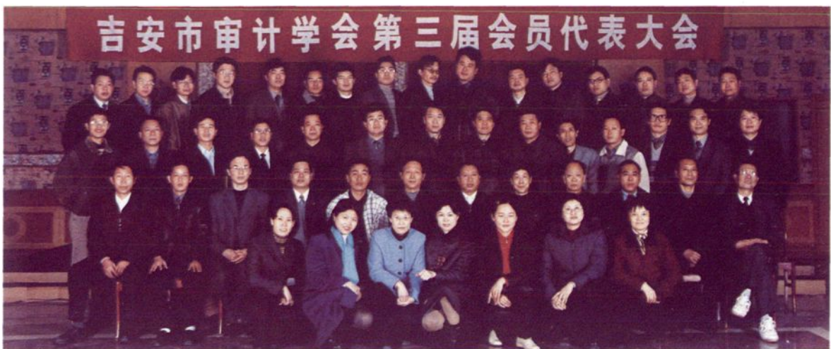
2002年12月19日，市审计学会召开第三届会员代表大会。