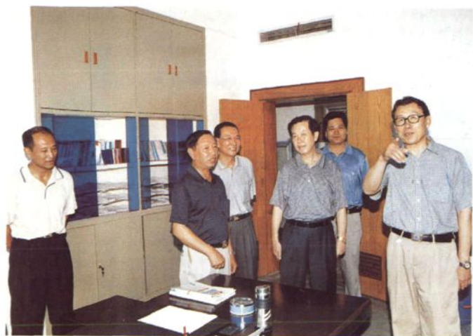
2002年7月10日，国家审计署副审计长令狐安(右一)在省审计厅党组书记李海泉(右三)的陪同下，到吉安考察工作并亲临市审计局机关，看望审计人员。