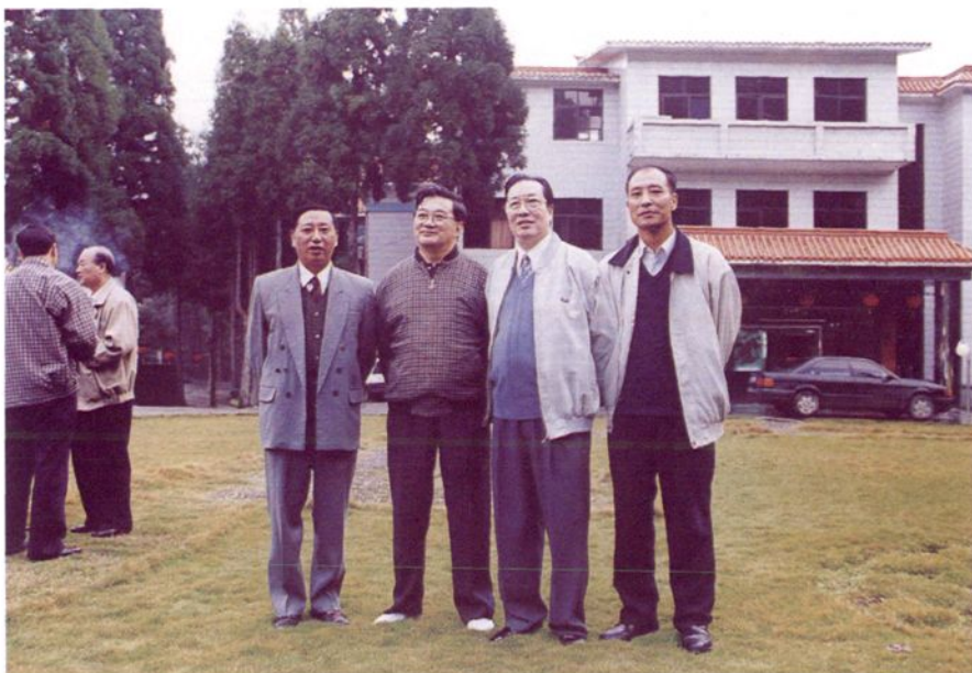
1999年10月31日，国家审计署审计长李金华（右三）在行署常务副专员孙世群（右二）、地区审计局局长李祖江（右四）、纪检组长郭天仪（右一）的陪同下在井冈山考察工作。