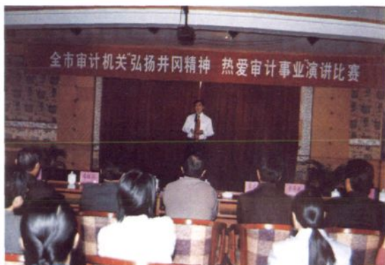
2003年10月9日，市审计局举办全市审计机关“弘扬井冈山精神，热爱审计事业”为主题的演讲比赛活动。