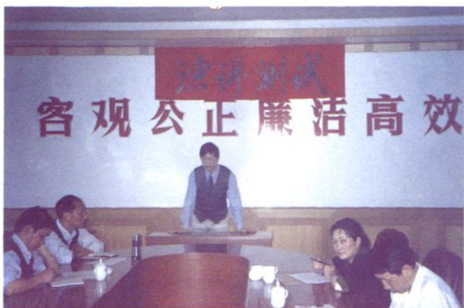
2001年5月18日，市审计局举行副科长职位竞争上岗。