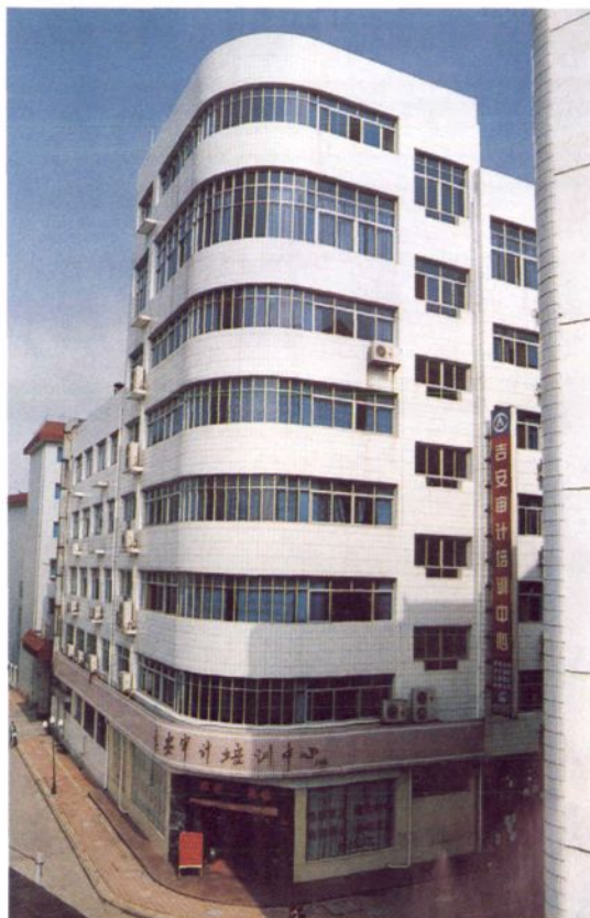
1997年兴建并于1999年12月对外开放的吉安审计干部培训中心。