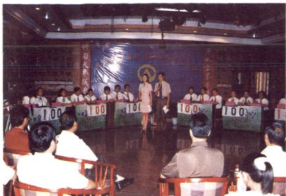
2003年9月13日，市审计局与中国联通吉安分公司举办“联通杯”审计法规知识竞赛。