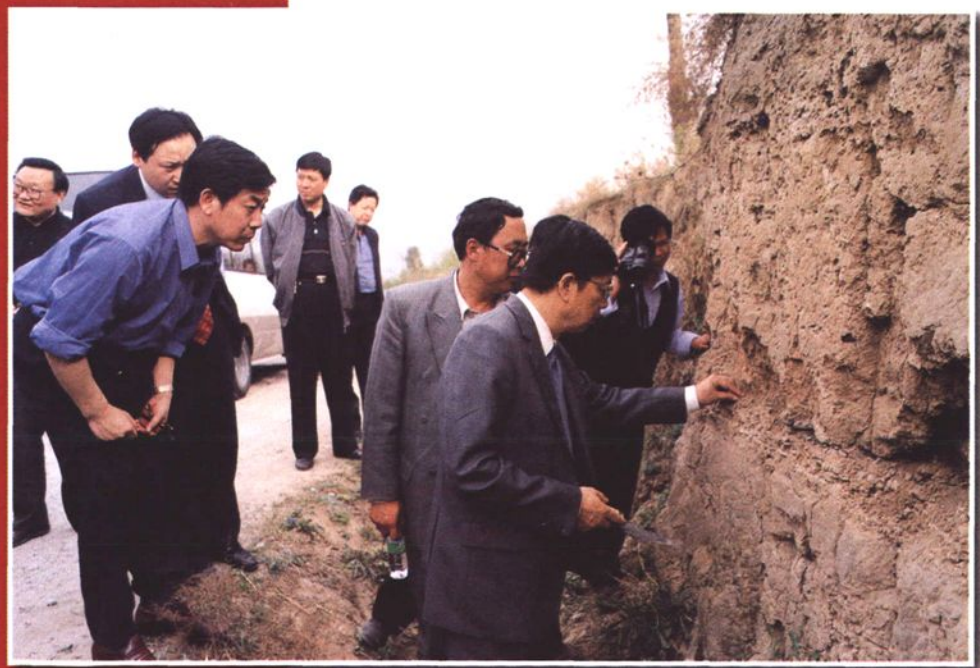
国家文物局局长张文彬在西坡遗址考察(1998年)