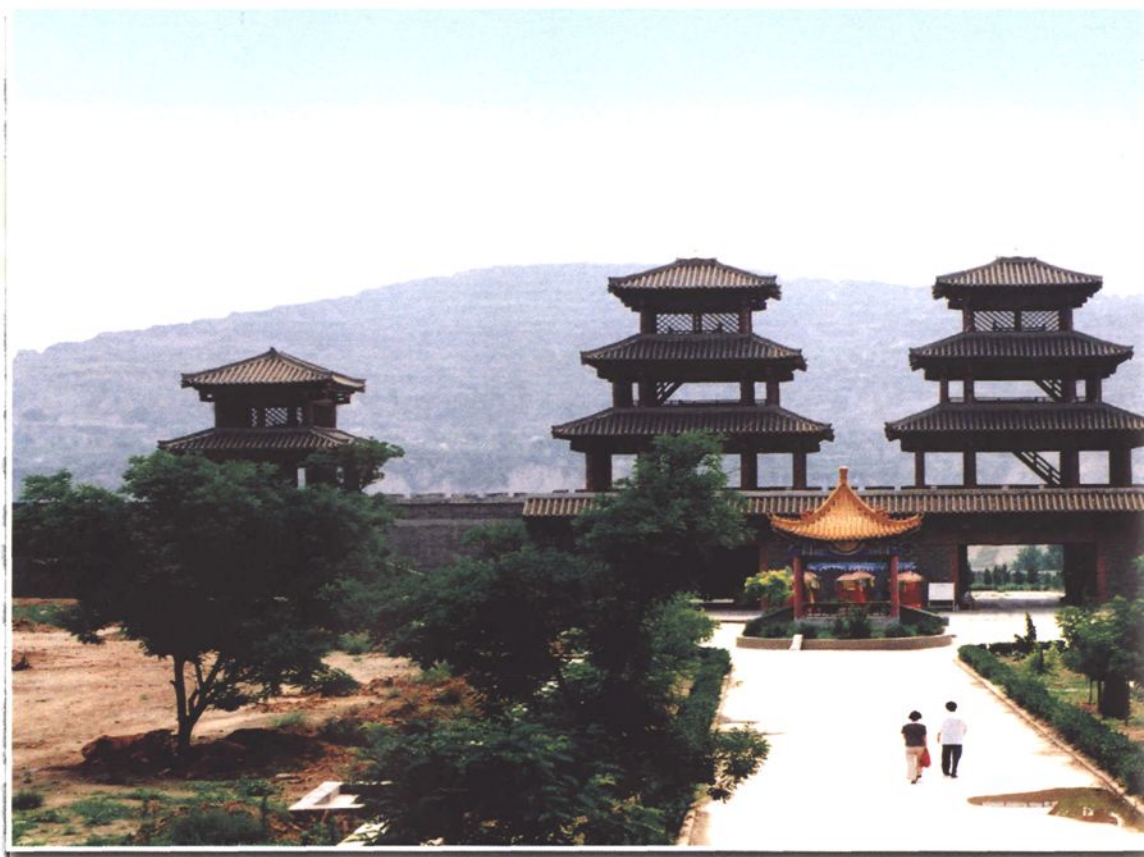
函谷关关楼(1992年重建)