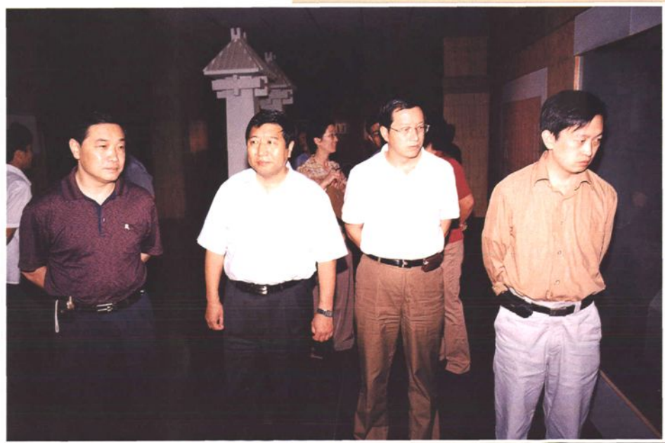
三门峡市副市长郭绍伟(左二)在灵宝市博物馆指导工作(2004年)