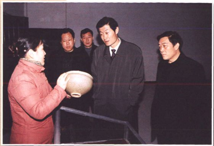
市委书记王跃华（右二）、市长王万鹏（右一）、市委常委、宣传部部长张成宝（左二）在文管所检查指导工作（二〇〇四年）