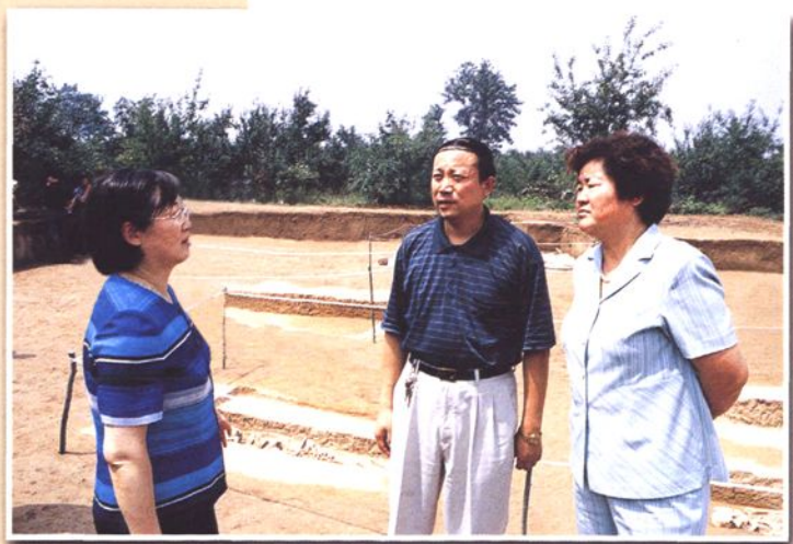
市委副书记、常务副市长、文管会主任高永瑞、市文化局局长杨连珍向省文物局局长陈爱兰（左一）介绍西坡遗址发掘情况（二〇〇五年）