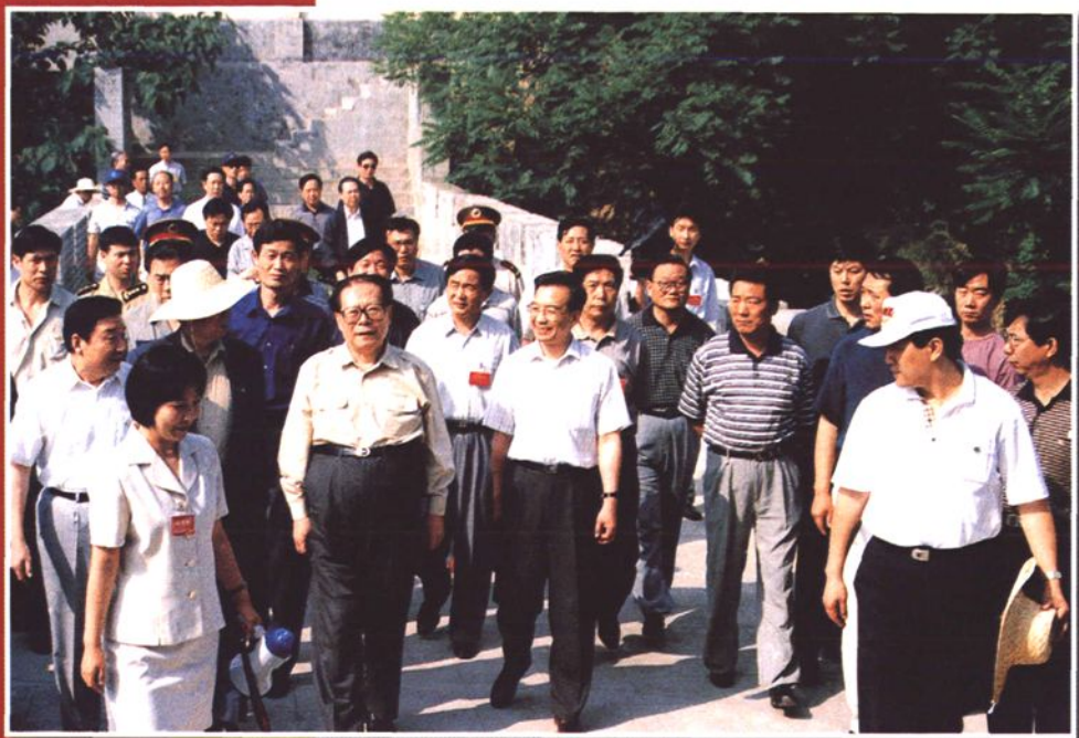
党和国家领导人江泽民、温家宝在函谷关视察（1999年）