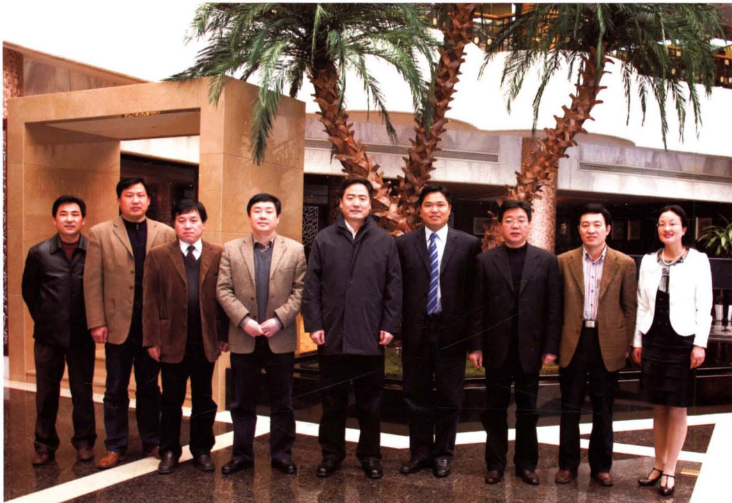
2009年4月2日，浙江省司法厅党委书记、厅长赵光君(左五)，厅党委委员、政治部主任俞世裕(左八)，绍兴市司法局局长周骄德(左四)，嵊州市委副书记、市长盛秋平(左六)和嵊州市司法局领导班子成员合影。