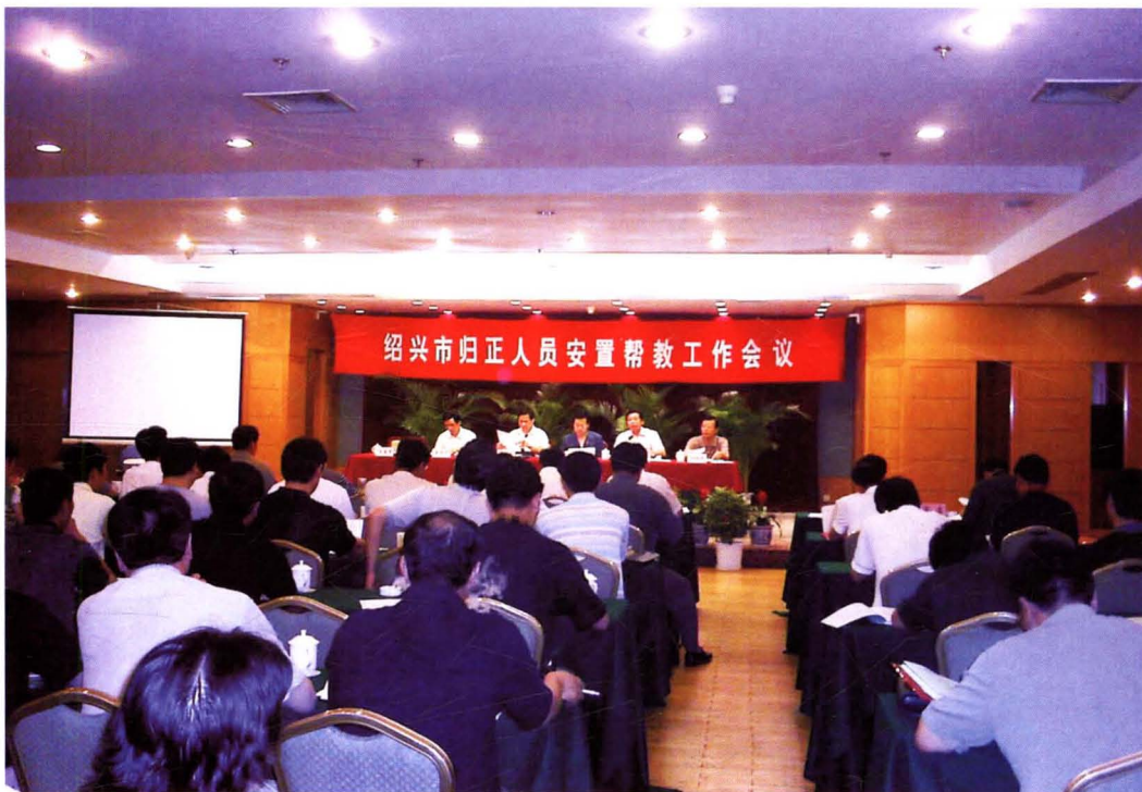
2005年6月23日，绍兴市归正人员安置帮教工作会议在嵊州召开，省司法厅党委书记、厅长胡虎林（右三）出席会议并讲话。