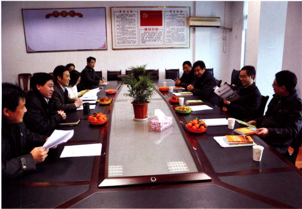
2012年1月31日，嵊州市委副书记、市长阮建尧到嵊州市司法局调研工作。