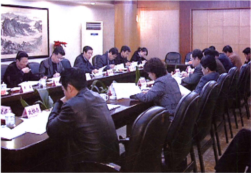
2007年12月5日，省委副秘书长、办公厅主任、法治办主任潘家玮在绍兴市委常委、政法委书记王海仁嵊州市委书记郭敏等陪同下到嵊州市调研法治建设。