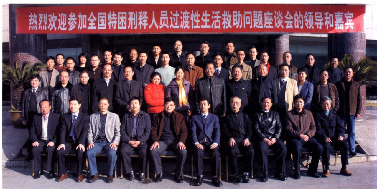
2008年12月10—11日，全国特困刑释人员过渡性生活救助问题座谈会在嵊州召开，中国监狱学会秘书长刘焯（前排左六）等领导出席会议。