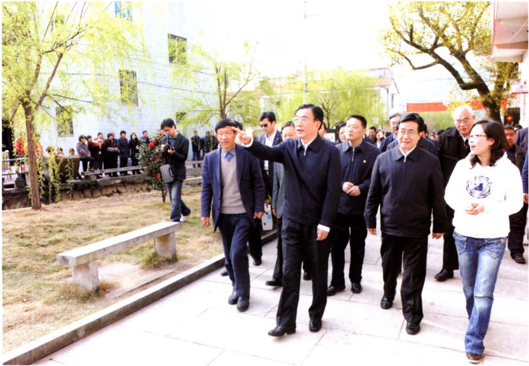
2010年3月27日，中共中央政治局常委、中纪委书记贺国强在浙江省委书记赵洪祝，省委副书记、省长吕祖善等陪同下，在四星级民主法治村——甘霖镇施家岙村视察工作。