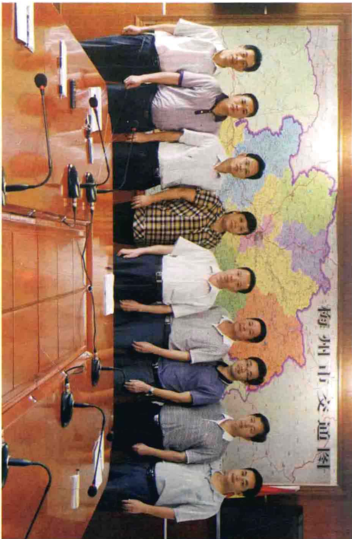
大埔县交通运输局全体党组成员（2013.10）