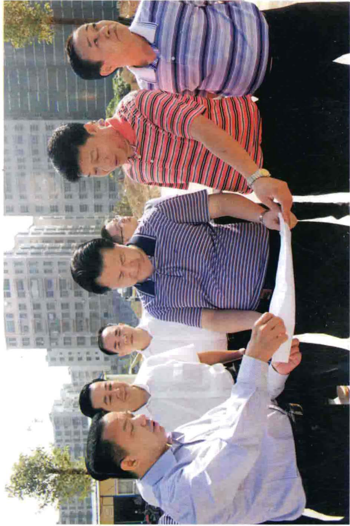
县委书记健雄书记调研交通、公路工作