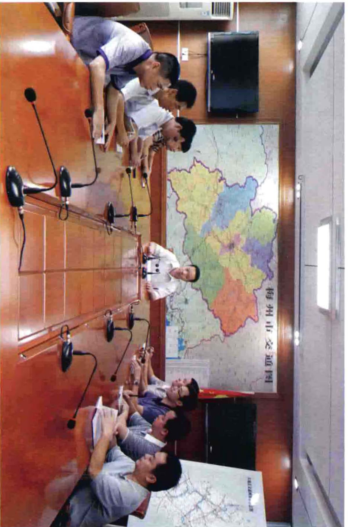
大埔县交通运输局召开党组会议（2013.08）